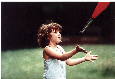
Zirkusworkshop für Schulklassen am Jubiläumsfest