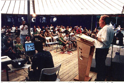
Preisverleihung: Homepage-Wettbewerb WebQuest