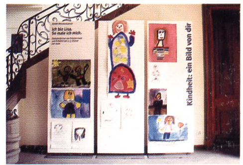
Ausstellung «Kindheit: ein Bild von dir»