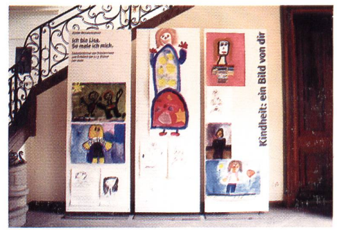
Ausstellung «Kindheit: ein Bild von dir»