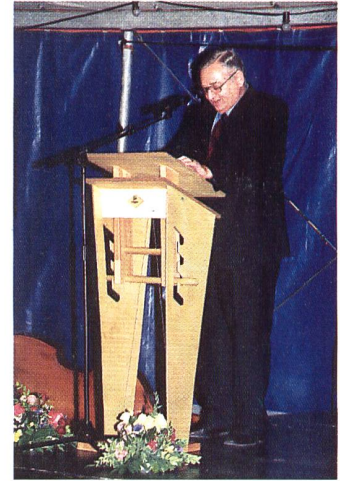
Grusswort Regierungsrat Ernst Buschor

page mit der elektronischen Bestellmöglichkeit weiter ausgebaut werden. Zum Jubiläum hatte das Team einen Comic mit der Geschichte des Informationszentrums und des Beckenhofs herausgegeben, der auf unterhaltensame Art die Geschichte des Pestalozzianums dokumentiert.