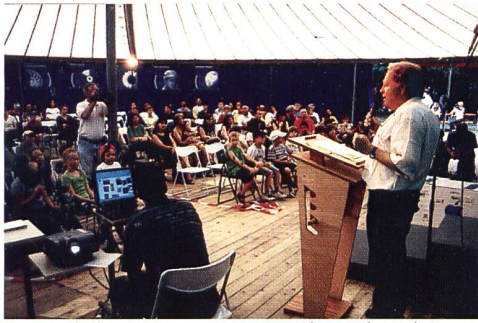
Preisverleihung: Homepage-Wettbewerb WebQuest