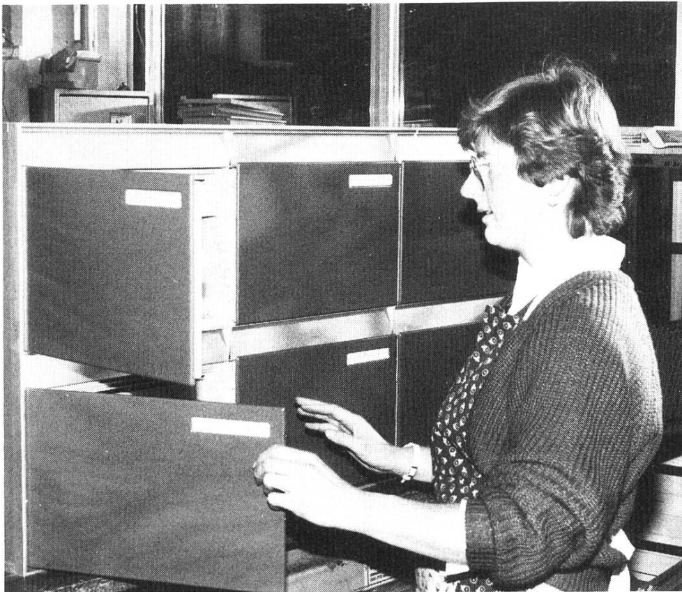
Im Programm der Intensivfortbildung der Kindergärtnerinnen ist auch ein Praktikum enthalten, das Gelegenheit zum Ausüben ungewohnter Berufstätigkeiten bietet.