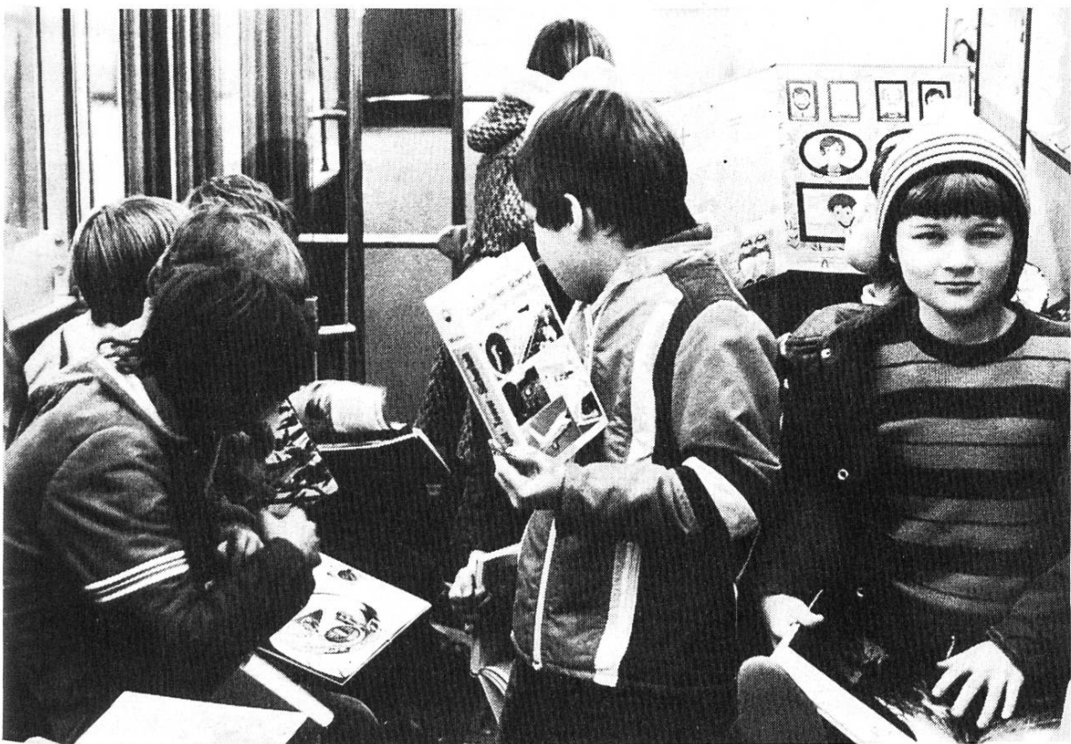
Im November/Dezember 1978 war der «Jugi-Bücher-Bus» des Pestalozzianums in der Stadt Zürich unterwegs, um die alljährliche Jugendbuchausstellung von Schulhof zu Schulhof zu bringen.