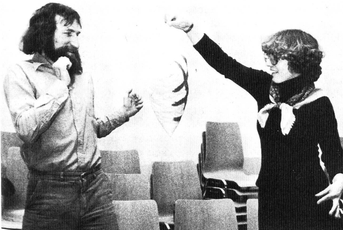
Teilnehmer einer Theaterspielgruppe in Winterthur, die sich nach einer Informationsveranstaltung an einem Schulkapitel spontan gebildet hat. Ziel der regelmässigen Zusammenkünfte ist es, die Lehrer zu befähigen, nach dem Erwerb eigener Spielerfahrungen auch mit ihren Klassen Formen des Schulspiels zu erproben.