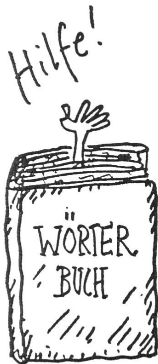
(Illustrationen: Magi Wechsler)