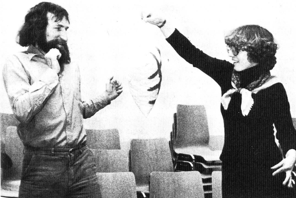
Teilnehmer einer Theaterspielgruppe in Winterthur, die sich nach einer Informationsveranstaltung an einem Schulkapitel spontan gebildet hat. Ziel der regelmässigen Zusammenkünfte ist es, die Lehrer zu befähigen, nach dem Erwerb eigener Spielerfahrungen auch mit ihren Klassen Formen des Schulspiels zu erproben.