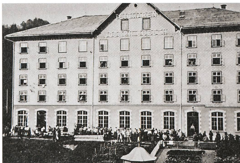
Ankunft der französischen Internierten in Ebnet, 13. August 1940.