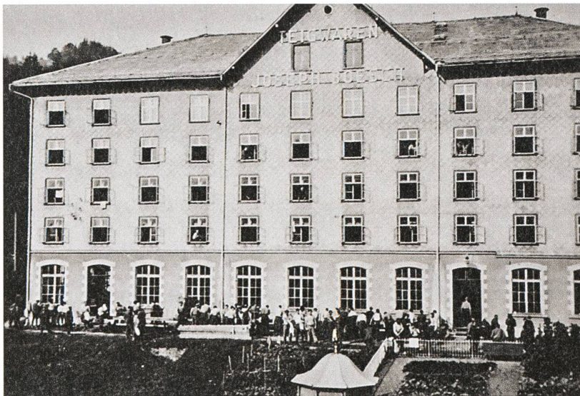
Ankunft der französischen Internierten in Ebnat, 13. August 1940.