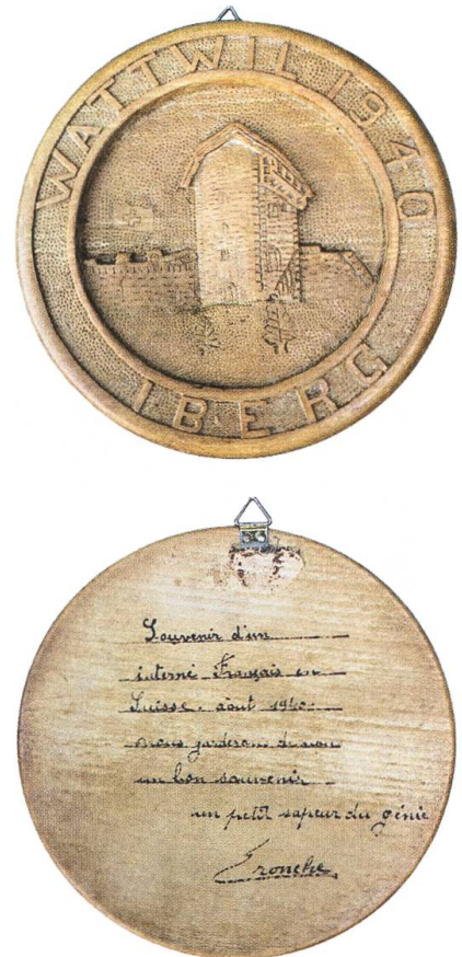
Vorder- und Rückseite eines mit Gravuren verzierten Erinnerungstücks.

Die «Troupe artistique des Internés de Lichtensteig» beispielsweise, die sich aus Amateuren gebildet hatte, konnte ihr Programm gleich mehrmals und in verschiedenen Gemeinden aufführen. Auch andere Theaterformationen, Konzertabende und eine Weihnachtsfeier waren von den Internierten organisiert worden; von Schweizer Seite wurde ein Diavortrag über «die Schönheiten der Schweiz» durchgeführt. Einheimische und als «Zwangsgäste» Anwesende trafen sich auch regelmässig zu Fussballspielen: Anfang September etwa verloren die Internés Français 1:5 gegen den FC Bunt, worauf ihnen nach Spielende dennoch ein grosser Blumenstrauss überreicht wurde. Aber auch Spiele zwischen verschiedenen Interniertenmannschaften waren eine Zeitungsmeldung wert, so spielten etwa die Internés Wattwil gegen die Internés Degersheim und gewannen 4:3. Was