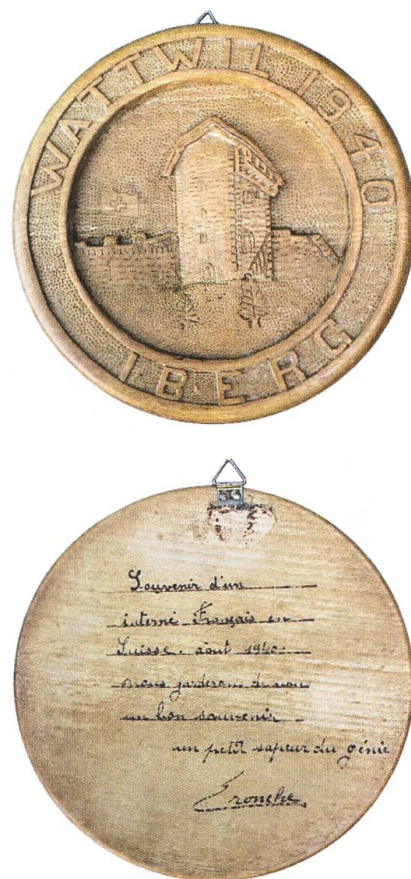
Vorder- und Rückseite eines mit Gravuren verzierten Erinnerungstücks.

Die «Troupe artistique des Internés de Lichtensteig» beispielsweise, die sich aus Amateuren gebildet hatte, konnte ihr Programm gleich mehrmals und in verschiedenen Gemeinden aufführen. Auch andere Theaterformationen, Konzertabende und eine Weihnachtsfeier waren von den Internierten organisiert worden; von Schweizer Seite wurde ein Diavortrag über «die Schönheiten der Schweiz» durchgeführt. Einheimische und als «Zwangsgäste» Anwesende trafen sich auch regelmässig zu Fussballspielen: Anfang September etwa verloren die Internés Français 1:5 gegen den FC Bunt, worauf ihnen nach Spielen dennoch ein grosser Blumenstrauss überreicht wurde. Aber auch Spiele zwischen verschiedenen Interniertenmannschaften waren eine Zeitungsmeldung wert, so spielten etwa die Internés Wattwil gegen die Internés Degersheim und gewannen 4:3. Was