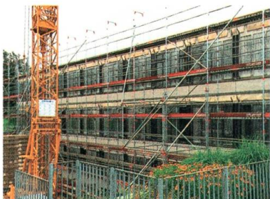
Die Fassade des Oberstufenschulhauses nimmt Gestalt an.

Nach rund 40 Jahren war das Oberstufenschulhaus Sennrütli sanierungsbedürftig. Die Gesamtsanierung des Komplexes wird von Anfang an zweigeteilt. Während des Sommers 2016 wird der westliche Schulhausteil saniert. Spezielles Augenmerk wird auf die energetische Sanierung gelegt. Die neue Fassade besteht aus Naturschiefer. Dieses natürliche Material passt zur Anlage und wertet den optischen Eindruck auf. Das teilsanierte Schulhaus wird im November 2016 bezogen und der normale Schulbetrieb wieder aufgenommen. Im Sommer