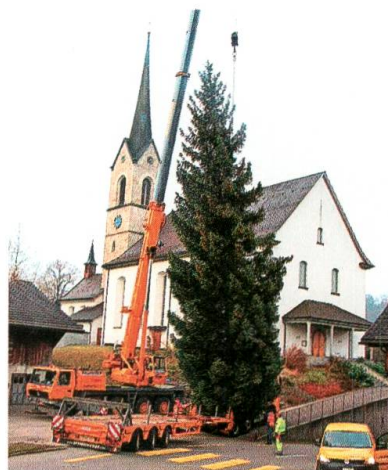
Der Lütisburger Weihnachtstanne auf dem Weg nach Wil.