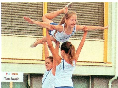
Mädchen am Jugendturnfest Kirchberg.

«David gegen Goliath» – diese Affiche macht den Fussball-Schweizer-Cup immer wieder reizvoll. Diesmal hat der Zweitliga-Klub Bazenheid das grosse Los gezogen. Mit Young Boys Bern kommt ein Super-League-Team auf den Ifang-