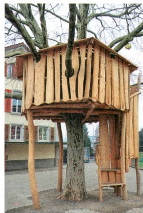
Das Baumhaus auf dem Pausen- und Spielplatz.