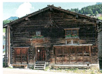
Das Geburtshaus von Huldrych Zwingli.

Bis zur Gründung der Skischule Wildhaus vor 80 Jahren waren Mitglieder des Skiclubs als Skilehrer tätig. In den ersten Jahren der Skischule war der Anteil der Kinder ein