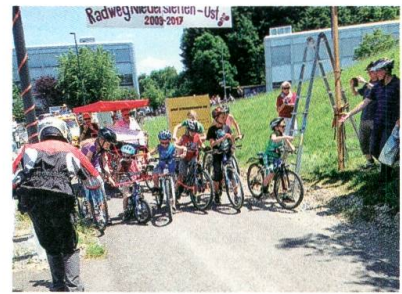
Eröffnung des Radwegs Henau-Niederstetten.