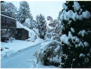
Schwere Schneelast im Frühling.