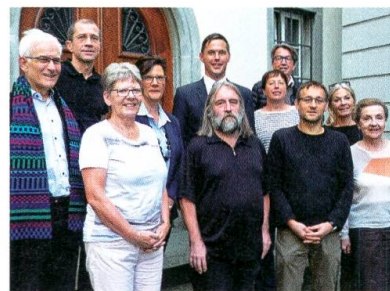
Gründungsmitglieder der Genossenschaft KISS.