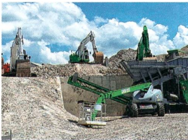
Schwere Bagger tanzen Ballett.

Bei guter Gesundheit feiert Benedikt Egger im Solino den hundertsten Geburtstag. Der ehemalige Bäckermeister aus St. Gallen war 68 Jahre mit einer Bütschwilerin verheiratet und führte mit ihr zusammen 40 Jahre eine Bäckerei.