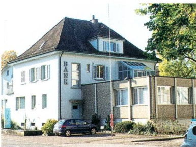
Das jetzige Bankgebäude wird abgerissen.