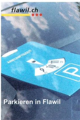
Faltplan und Wegleitung.