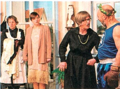
Die Mimik der Schauspieler zeigt den Ernst der Lage.

Die Theatergruppe Brunnadern, gegründet 2002 von Ruedi Näf, öffnet unter seiner Regie den Vorhang zur Premierenvorführung des Dreiakters «Der Meisterboxer». Diese turbulente Produktion im Gasthaus Rössli, Bächli, konnte in zwölf Vorführungen 1400 Besucher begeistern.