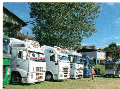
Schwere Brummer in Reih und Glied.