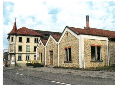
Das markante Eckgebäude muss der Umfahrungsstrasse weichen.

Die Bibliothek Bütschwil feiert ihr 20-jähriges Bestehen. Rund 7500 Medien (Bücher, Hörbücher, DVD-Filme) werden vom engagierten Team verwaltet. Und verstaubt ist die