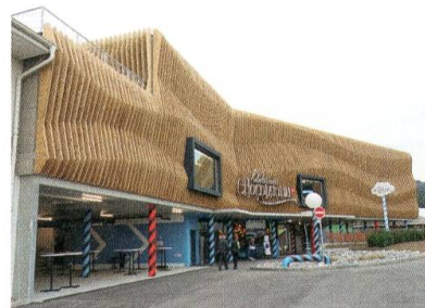
Das Chocolarium am Eröffnungstag.

Die Genossenschaft Gemeinschaftsantenne (GGA) leistet weitere nahnhaftige Beiträge für gemeinnützige Zwecke. Nutzniesser sind u. a. die Gemeindebibliothek Flawil und die Fachstelle Medienpädagogik der Schule Flawil.