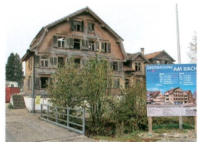
Die Liegenschaft Wenk vor dem Abbruch.