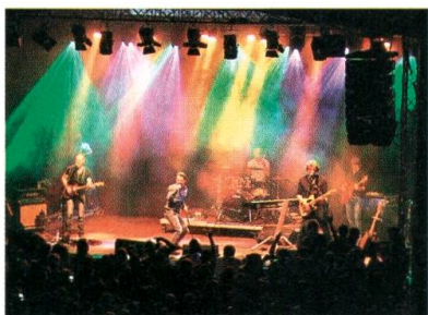
«Rock am Gleis» mit Florian Ast.

Die Schülerzahlen steigen. Deshalb wird im Schulhaus Sennrütli ein neuer Kindergarten eröffnet. Im Schuljahr 2016/17 werden 61 Kinder eingeschult, das sind 18 mehr als im Durchschnitt der Vorjahre. Der Schulrat rechnet auch in den nächsten Jahren mit einer konstant hohen Anzahl von neuen Kindergartenkindern.