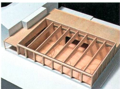
Modell der neuen Mehrzweckhalle.

Die Stimmbürgerinnen und Stimmbürger der Primarschulgemeinde stimmen einem Kredit von 5 Millionen Franken für den Bau einer neuen Mehrzweckhalle deutlich zu. Der Neubau soll die sanierungsbedürftige und zu klein gewordene Halle aus dem Jahre 1966 ersetzen.