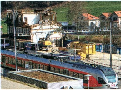
Der Bahnhof Brunnadern wird abgebrochen.

Seit einem halben Jahr zeigen Spuren, dass sich ein Biberpaar, wohl vom Thurtal kommend, auch am Neckertal, in der Gegend von Rennen fest angesiedelt hat.