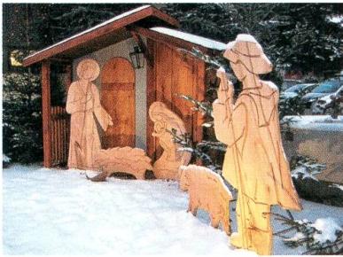
Die neue Krippe am Ochsenplatz Niederuzwil.