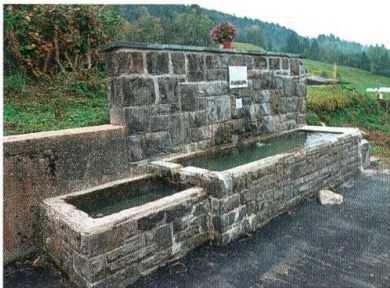
Der sanierte Brunnen beim Kurhaus Rietbad.