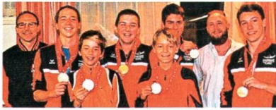
Die Wildhauser Junioren-Curler werden Schweizer Meister.