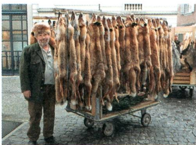
Am traditionellen Lichtensteiger Pelz- und Fellmarkt.