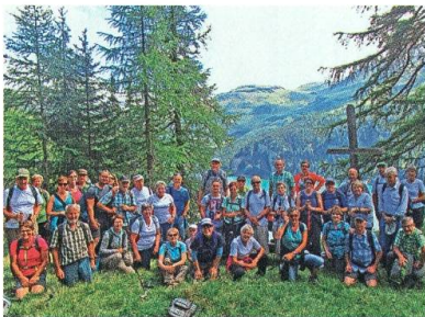
Freizeit bewegt: Wanderung auf die Alp Flix.

Mit dem Lauf nach Wil findet das Bewegungs-Teilprojekt im Rahmen von «Gemeinde Kirchberg bewegt» seinen Abschluss. Die Teilnehmenden sind begeistert: tolles Wetter, gute Organisation, eine schöne Laufstrecke von Kirchberg über Dietschwil und Aegelsee zum Sportpark Bergholz in Wil. 3000 Teilnehmende aus der Gemeinde Kirchberg und der Stadt Wil machen bei diesem Duell mit. Aus Wil sind mehr Leute dabei, doch die Kirchberger können einen viel grösseren Anteil der Bevölkerung mobilisieren. Mehr als zwanzig Menschen im Rollstuhl, Kleinkinder im Buggy oder auf Vaters Schulter zeigen, dass dies ein Lauf für alle ist.