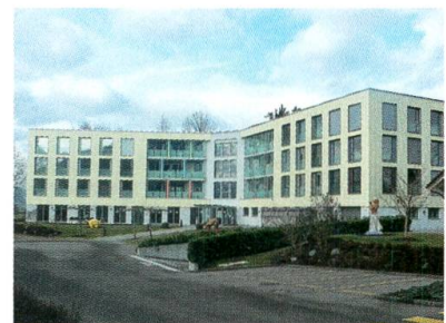
Der Sonnenhof kooperiert mit dem Kinderdörfli Lütisburg.

Der Bagger fährt auf und beginnt mit dem Abbruch der markanten Liegenschaft Wenk am Dorfbach. Es entsteht ein Mehrfamilienhaus mit Gewerberäumen. Zum Glück für das Dorfbild übernimmt der Bauherr die bestehende Form und Dimension.