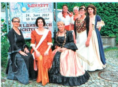
Die Damen am russischen Bankett.

Zum vierten Mal findet in Lichtensteig «Der Lange Tisch» statt, organisiert von den Wilden Weibern Lichtensteig. Dieses Jahr steht der Anlass unter dem Motto Russisches Bankett. Der Tag erinnert an die russische Revolution vor hundert Jahren. Der Verkehr wird umgeleitet, und auf der Hauptgasse ist eine riesige Festbankreihe aufgestellt. Für Unterhaltung sorgen der Russinka-Chor Vorarlberg, Bajanski Bal, Los Buntos und das Chössitheater. Der Anlass soll ein spontanes und