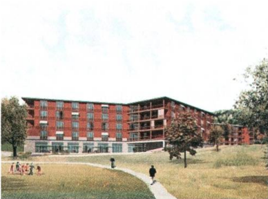
Der geplante Neubau Pflegeheim Wier.

Die Bürgerinnen und Bürger stimmen dem Neubau Pflegeheim Wier mit einer deutlichen Mehrheit zu. Der Neubau soll in den Jahren 2019 bis 2021 realisiert werden.