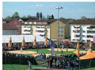
Die Wettkämpfe beim Oberstufenzentrum sind im Gang.