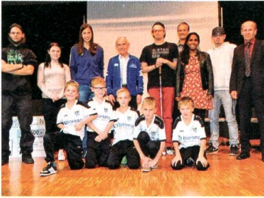
Die Gemeinde Jonschwil ehrt 14 Personen für Erfolge in Beruf oder Sport und für gesellschaftliches Engagement.

Einen schönen Erfolg kann die Firma Elkuch Eisenring AG in Jonschwil feiern. Die Firma mit 120 Beschäftigten wird für ihr Engagement für das Wohlbefinden der Mitarbeiter mit dem Gesundheitsförderungspreis des Vereins Artisana ausgezeichnet. Die Geschäftsleitung verwendet den Preis in der Höhe von 10 000 Franken für ein Mitarbeiterfest.