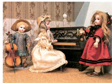
Porzellanpuppen, von Cosette Gall-Claude hübsch in Szene gesetzt.

An der kommunalen Abstimmung wird die Öffnung des Ziegelhüttenbaches abgelehnt. Zustimmung findet der Kauf des UBS-Gebäudes durch die Gemeinde Lichtensteig. Der Verwaltungssitz soll in dieses Gebäude verlegt werden.