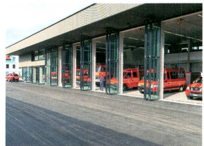
Das neue Feuerwehrdepot an der Wilerstrasse.

Der in Flawil befürchtete Abbau der Fernverkehrsangebote konnte abgewendet werden. Ab Dezember 2018 werden stündlich weiterhin zwei Schnellzüge in jede Richtung halten.