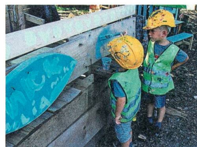
Anstrich für die Wand.