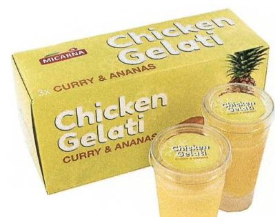
Chicken Gelati – ein Angebot mit Zukunft?

Und wieder sorgt die Micarna in Bazenheid für positive Schlagzeilen. Europäische Medien berichten von «Chicken Gelati», einer Pouletglace, die an der «Anuga», der weltgrössten Ernährungsmesse in Köln mit dem Thema «Wie schmeckt die Welt von morgen?», vorgestellt wird.