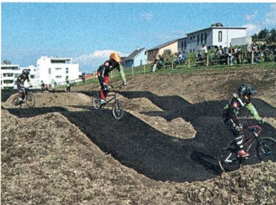
Die Pumptrack-Anlage am Tag der Eröffnung.

Die Genossenschaft Gemeinschaftsantennen-Anlage stellt