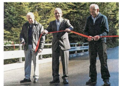
Eröffnung der neuen Brücke über den Zwisler.

Mit einer kleinen Feier wird die neu erstellte Betonbrücke über den Zwisler zwischen Hemberg und Bächli eingeweiht.