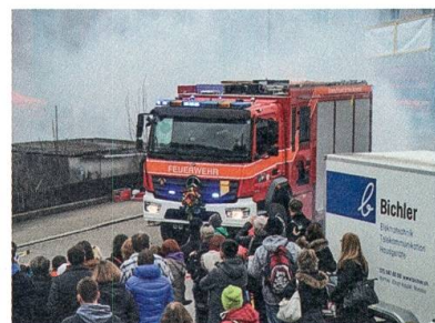
Das neue Tanklöschfahrzeug im Einsatz.