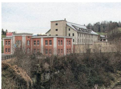
Gewerbepark in der ehemaligen Spinnerei Dietfurt.

Ganterschwil: Nach gut 50 Arbeitsjahren auf den Gemeinde- und Stadtverwaltungen von Wittenbach, St. Gallen, Wil, Niederhelfenschwil, Ganterschwil und Bütschwil-Ganterschwil