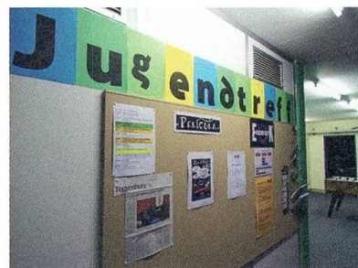
Der neu gestaltete Jugendtreff.