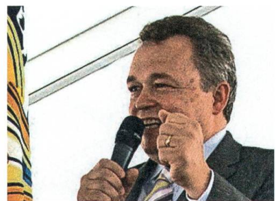
Festansprache in Ennetbühl.

Mehrere tausend Besucherinnen und Besucher geniessen das abwechslungsreiche Programm an den 8. Internationalen