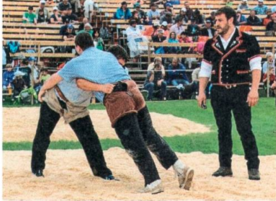
St. Galler Schwingfest in Uzwil.