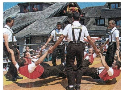
Starke Ausstrahlung des Senn- tums.

Das viertägige Klangfestival Naturstimmen hat rund 300 Künstlerinnen und Künstler sowie 6500 Gäste nach Alt St. Jo-