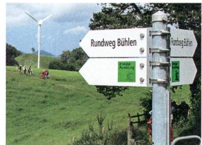
Auf dem Bühlen-Rundweg.

Bei idealem Wanderwetter wird der Bühlen-Rundweg eröffnet. Oberhelfenschwil verfügt nun über drei Rundwege, den Kneippweg, den Ahornweg und neu den Bühlenweg. Gegen sechzig Wanderlustige ziehen vom Dorf über Bühlen, Freudenberg, am Windrädli vorbei zur Feuerstelle beim Kreuz.