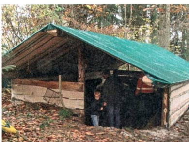
Waldhütte für den Kindergarten.

Die Kindergarten-Waldhütte im Haslerwäldli wird mit Hilfe von 19 Vätern und 2 Müttern saniert. Die Hütte bietet nun den Kindergärtnern Schutz bei jedem Wetter.