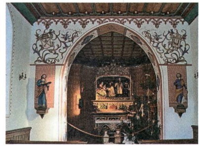
Chorraum der St.-Bartholomäus-Kapelle.

Bei strahlendem Wetter werden in Lütisburg zwei musikalische Grossanlässe, der Kantonale Veteranentag und der Neckertaler Kreismusiktag, unter besten Bedingungen durchgeführt.