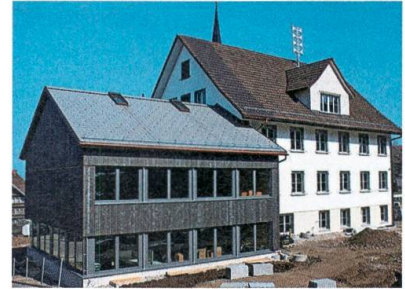
Büros der Gemeindeverwaltung in der ehemaligen Post Mogelsberg.