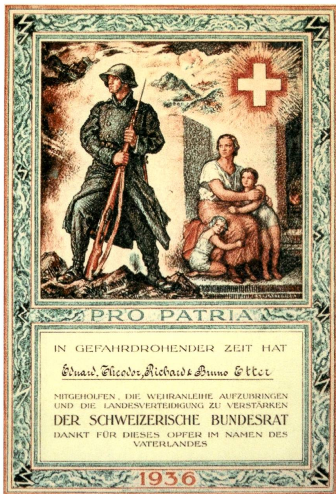
Verdankungsurkunde des Bundesrates für die Zeichnung der Wehranleihe 1936.