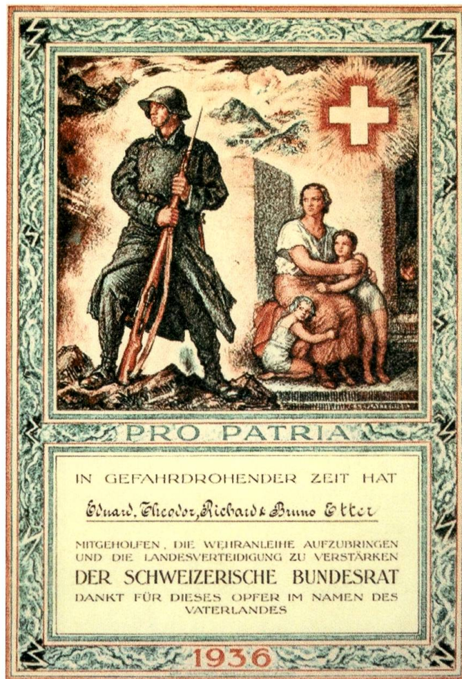
Verdankungsurkunde des Bundesrates für die Zeichnung der Wehranleihe 1936.