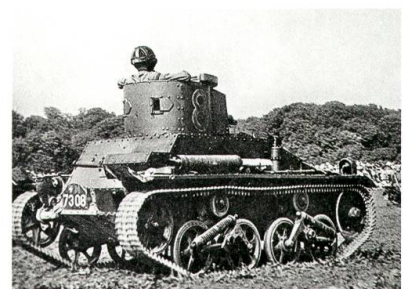
Panzerwagen 34 «Vickers».