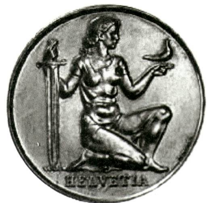
Gedenkmünze (5 Franken, Silber) Pro Patria, 1936.