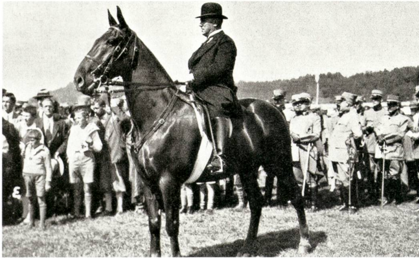
Rudolf Minger, Bundesrat und Vorsteher EMD 1929–1940.

Bereits Mingers Vorgänger Scheurer rang an allen Fronten mit den rigorosen Sparbeschlüssen des Parlamentes. Das Militärbudget sank Ende der zwanziger Jahre von 92 Millionen Franken jährlich auf 85 Millionen; diese Summe sollte dauernd gehalten und nicht mehr überschritten werden. Man kam unter diesen Umständen nicht umhin, die Aushebung und Ausbildung der Rekruten einzuschränken und die gebildeten Materialreserven anzugreifen. Die neuen Gewehre des Jahrgangs 1911 wurden gegen Modelle von 1889 vertauscht sowie die Stahlhelme eingezogen; auf die Durchführung der Wiederholungskurse der Landwehr hatte man ganz verzichtet.