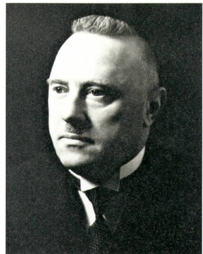
Rudolf Minger (1881–1955).

Minger profilierte sich politisch vorerst innerhalb des landwirtschaftlichen Genossenschaftswesens, dessen Ideale ihn prägten. 1918 finden wir ihn bei den Gründungsmitgliedern der kantonalbernischen Bauern- und Bürgerpartei, die er als erster Parteipräsident zwischen 1919 und 1929 führte und die 1921 auf sein Betreiben hin in Bauern-, Gewerbe- und Bürgerpartei (BGB) umbenannt wurde. Mit grossem Erfolg organisierte er 1919 den Wahlkampf für die ersten Nationalratswahlen nach dem Proporzsystem. Nach seiner Wahl in den Nationalrat präsidierte er die von ihm geschaffene bäuerliche Fraktion bis zu seiner Wahl in den Bundesrat als Nachfolger für den im Amt verstorbenen Karl Scheurer (FDP; Vorsteher EMD) am 12. Dezember 1929. Rudolf Minger war im Bundesrat der erste Vertreter der BGB und erster Bauer seit 1848 überhaupt. Er übernahm gegen seinen Willen das Militärdepartement, das er bis zu sei-