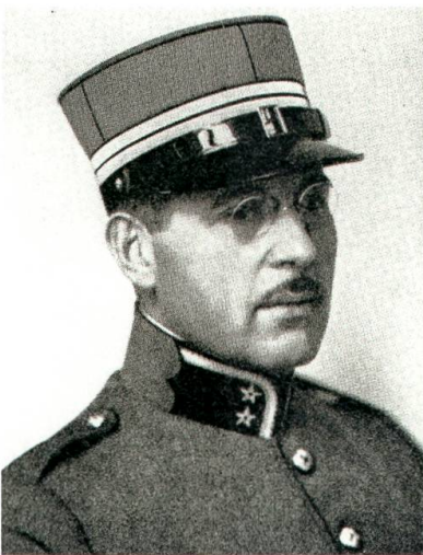
Oberstlt i Gst Karl Kobelt (1891–1968), Stabschef der 6. Division.

Ein ziemlich dichter, aber grösstenteils ungepflegter Obstbaumbestand war im Weg. Wie vor 100 Jahren bei Schwarzenbach zeigten die Landbesitzer auch jetzt wenig Bereitwilligkeit, den Boden für die Heerschau zu überlassen, und als man gar von der Entfernung einer Anzahl z. T. ohnehin auf der Anklagebank stehender Mostobstbäume sprach, waren die verurteilten, ungepflegten, krebssigen Bäume (Ausnahmen bestätigen die Regel) plötzlich zu Prachtsexemplaren geworden. Man hatte «en mangeant» Appetit bekommen und «wollte das Geld von den Lebendigen nehmen». Nach langem Hin und Her hat man sich schliesslich geeinigt, und mancher Bauer ist vielleicht froh gewesen, dass er seine alten Birnbäume so gut hat verkaufen können.