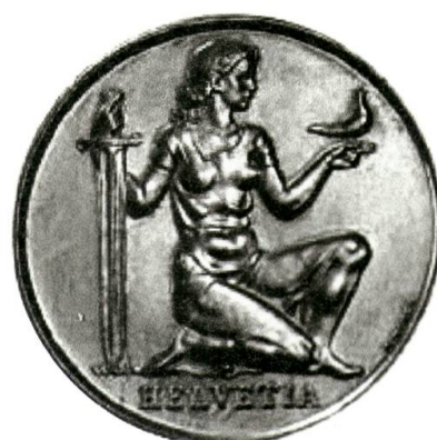
Gedenkmünze (5 Franken, Silber) Pro Patria, 1936.