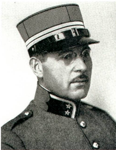
Oberstlt i Gst Karl Kobelt (1891–1968), Stabschef der 6. Division.

Ein ziemlich dichter, aber grösstenteils ungepflegter Obstbaumbestand war im Weg. Wie vor 100 Jahren bei Schwarzenbach zeigten die Landbesitzer auch jetzt wenig Bereitwilligkeit, den Boden für die Heerschau zu überlassen, und als man gar von der Entfernung einer Anzahl z. T. ohnehin auf der Anklagebank stehender Mostobstbäume sprach, waren die verurteilten, ungepflegten, krebssigen Bäume (Ausnahmen bestätigen die Regel) plötzlich zu Prachtsexemplaren geworden. Man hatte «en mangeant» Appetit bekommen und «wollte das Geld von den Lebendigen nehmen». Nach langem Hin und Her hat man sich schliesslich geeinigt, und mancher Bauer ist vielleicht froh gewesen, dass er seine alten Birnbäume so gut hat verkaufen können.