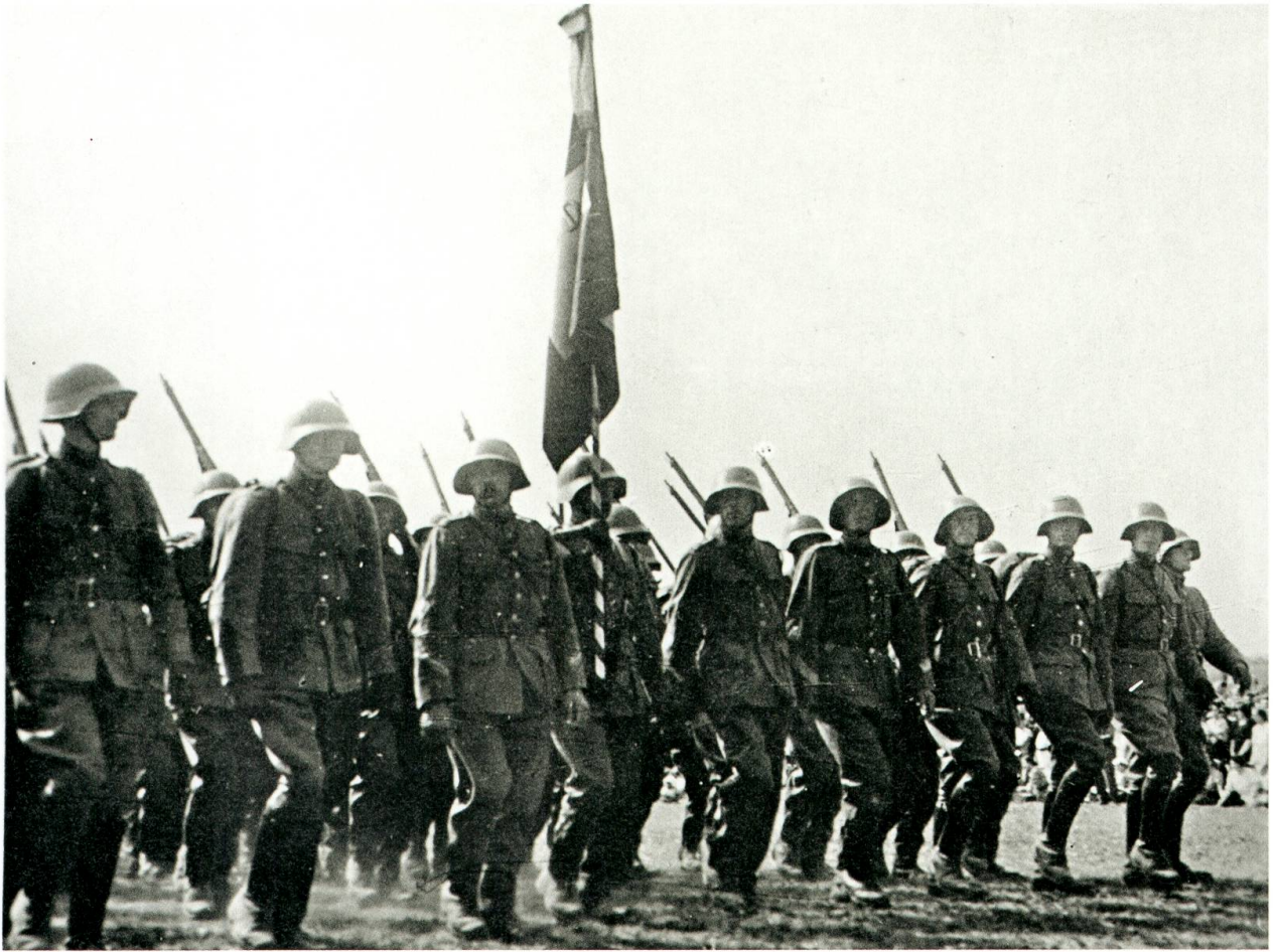
Zwölferkolonne der Infanterie und Details aus dem Defilee.