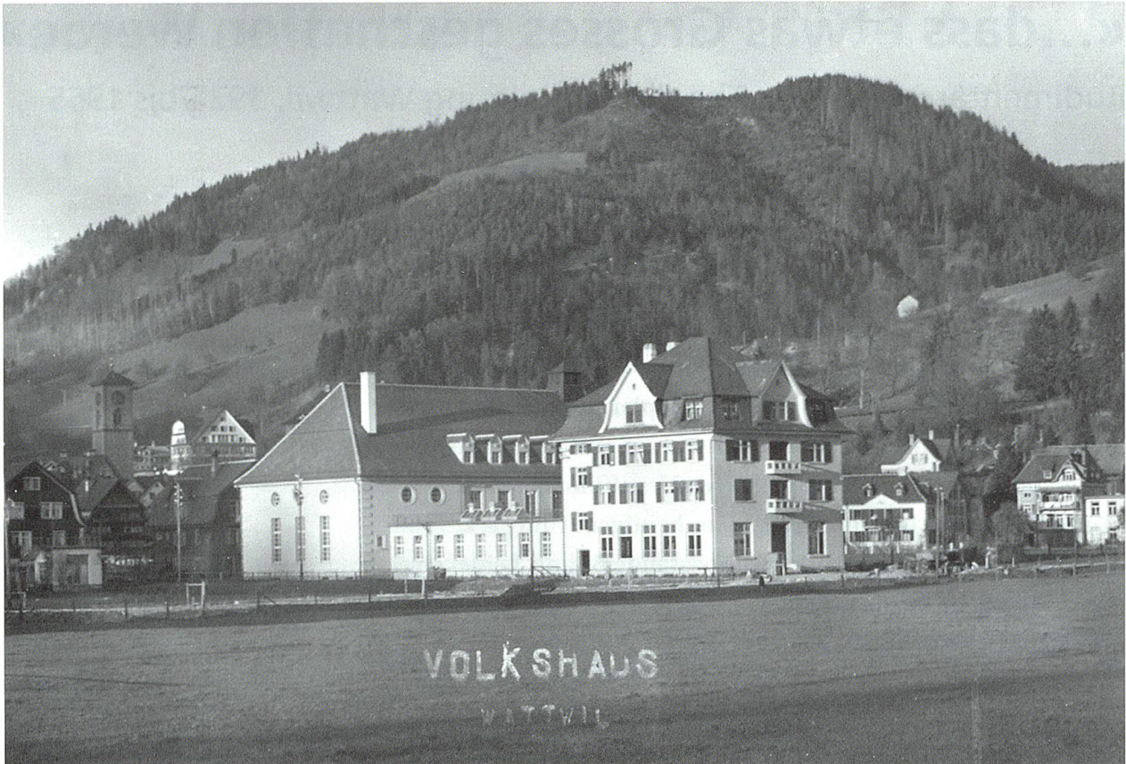
Postkarte mit dem neuen Volkshaus, 1924.

tenden Vorträgen, zu geselligen Zusammenkünften und Unterhaltungsabenden in geschlossenen Gesellschaften, zu öffentlichen Versammlungen, Ausstellungen etc.» 2 beitragen sollten. So war der Saaltrakt von Anfang an multifunktional benutzbar, die Zwischenwand konnte weggeschoben, die Galerie mitbenutzt werden, so dass bei Konzertbestuhlung rund 700 Plätze zur Verfügung standen. Entsprechend gross war die Bühne, wie sich heute noch bei einem Augenschein im Thurpark erahnen lässt. Sie hatte eine Fläche von über hundert Quadratmetern, war fast zwölf Meter tief und mindestens vier Meter hoch – und einst wohl noch ein bisschen höher, wie angesichts alter Fotos zu erschliessen ist.