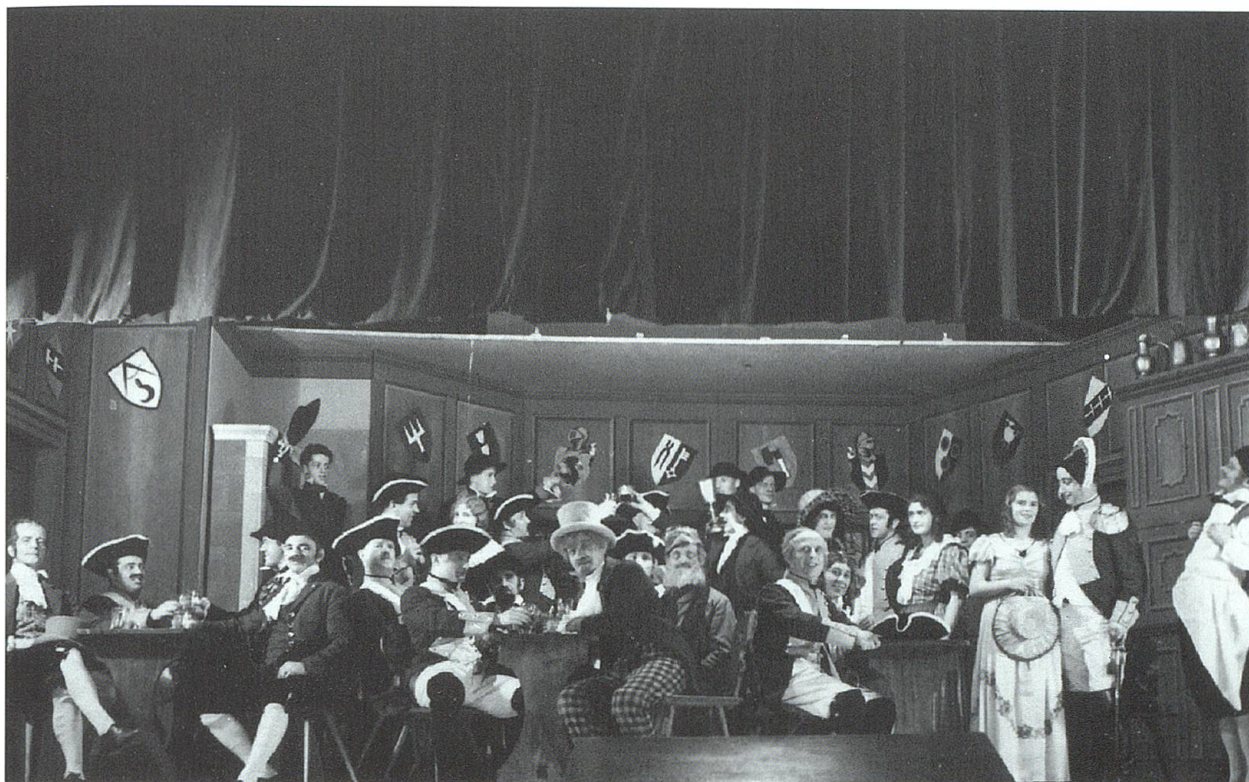
«De Patriot» spielt um 1800, als die Eidgenossenschaft von den Truppen Napoleons besetzt war. (Ortschronik der Gemeinde Wattwil, 1933–1939, S. 83)