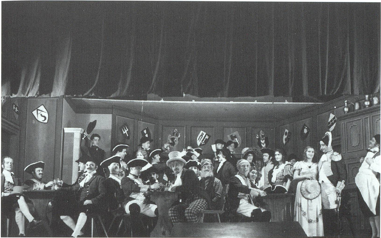
«De Patriot» spielt um 1800, als die Eidgenossenschaft von den Truppen Napoleons besetzt war. (Ortschronik der Gemeinde Wattwil, 1933–1939, S. 83)