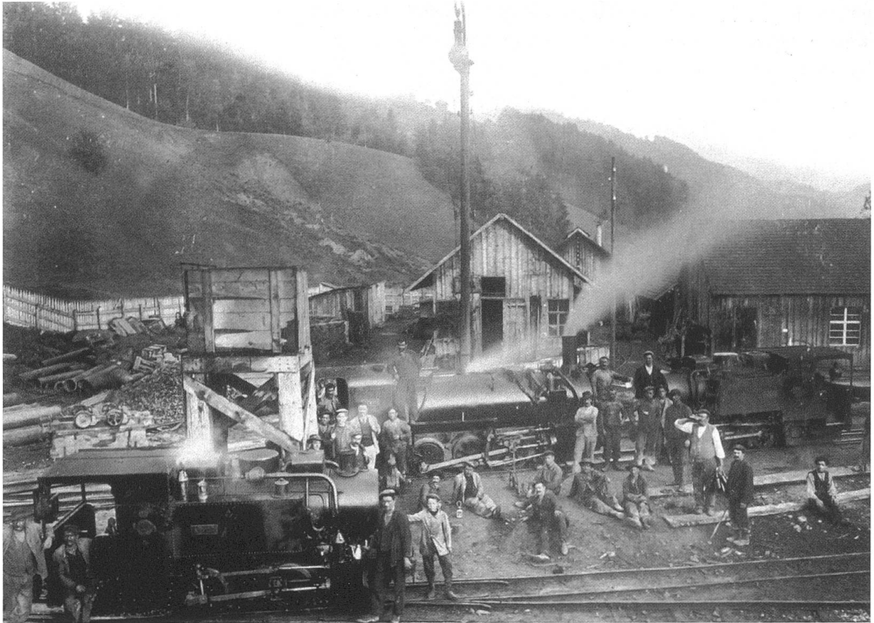
Eine Werklokomotive 1908 im Einsatz beim Rickenportal.

wurden: Weinhändler, Wirt, Comestible, Cantinier, Hausierer, Vorarbeiter, Schneider, Schuhmacher usw. Somit wird klar, dass das «Italienerdorf» sich im Verlauf der Zeit zu einer immer selbständiger werdenden Dorfgemeinschaft entwickelte. Wenn beispielsweise ein Bauarbeiter neue Kleider benötigte, so wandte er sich an den italienischen Schneider. Aus dieser Tatsache können zwei Schlussfolgerungen gezogen werden: Zum einen verhielten sich sowohl die Italiener als auch die schweizerische Bevölkerung zueinander fremdenfeindlich. Zum anderen werden Verflechtungen zwischen ganz verschiedenen Berufsfeldern seitens der italienischen Bevölkerung ersichtlich. Viele waren gleichzeitig Mineure und Maurer; oder ein Cantinier eignete sich sehr gut auch als Schneider. Auch viele Frauen waren berufstätig. In den allermeisten Fällen arbeiteten sie in der Textilindustrie, also in der Weberei. Die Italiener lebten in ärmlicher Art und Weise, doch jeder von ihnen tat, was sie oder er konnte, um die Lebensqualität innerhalb des Dorfes zu verbessern.