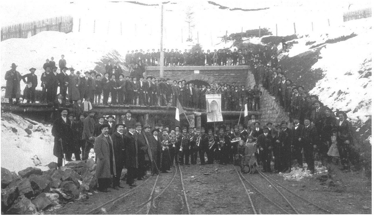
Santa-Barbara-Feier 1905 beim Tunnelportal in der Bleiken.

italienischen Tunnelarbeiter in Lichtensteig und Wattwil. Ihr wurden zahlreiche Gedichte und Gebete gewidmet.