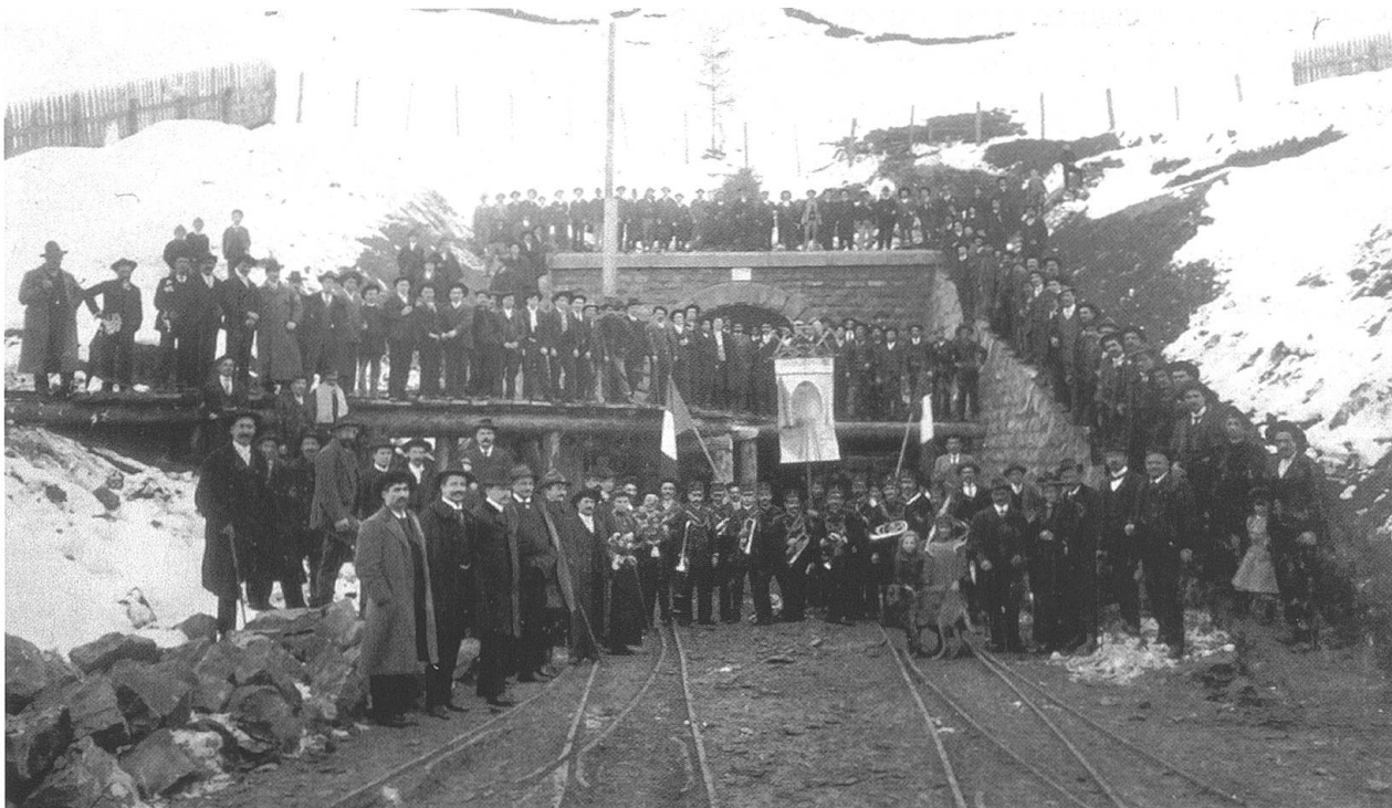
Santa-Barbara-Feier 1905 beim Tunnelportal in der Bleiken.

italienischen Tunnelarbeiter in Lichtensteig und Wattwil. Ihr wurden zahlreiche Gedichte und Gebete gewidmet.