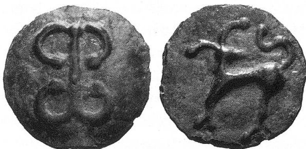
Abb.1: Keltischer Potin (Gussmünze) vom sogenannten Zürcher Typ.

Zur Römerzeit und früher scheint das Toggenburg nur schwach und vor allem im unteren Teil besiedelt gewesen zu sein. Es erstaunt deshalb nicht, dass nur wenige Funde von römischen und noch weniger von keltischen Münzen bekannt sind. Zu diesen Raritäten gehört der keltische Potin (Gussmünze) vom Zürcher Typ, welcher unlängst in der Thur in der Nähe von Wil gefunden wurde (gleicher Typ wie Abb.1). Solche Funde deuten darauf hin, dass diese Münze der keltischen Helveter in der ganzen Schweiz, auch auf dem Gebiet der Kantone St. Gallen und Thurgau, im Gebrauch war.