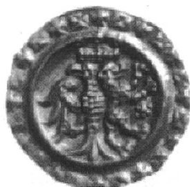
Abb. 4: Brakteat oder Pfennig der Grafen von Toggenburg (1200–1240).

Zwischen 1200 und 1240 scheinen auch die Grafen von Toggenburg Brakteaten geschlagen zu haben. Sie reihen sich, zusammen mit den St. Galler Pfennigen, in die «Bodenseebrakteaten» ein, welche rund um den Bodensee bis nach Ulm und Sindelfingen von weltlichen und geistlichen Herren geschlagen wurden. Ob sie im Toggenburg hergestellt oder in Ulm, Kempten, Lindau, Weingarten oder Radolfzell in Auftrag gegeben wurden, wissen wir nicht. Alle diese Münzstätten verwenden jedenfalls zu dieser Zeit ähnliche Randkreuze. Vielleicht sind in Kloster- oder Stadtarchiven noch Hinweise darauf zu finden. Die Toggenburger Pfennige zeigen einen halben Adler links und einen nach rechts steigenden Löwen oder Hund rechts (Abb. 4). Diese Darstellung entspricht genau dem Siegel der Toggenburger Grafen.