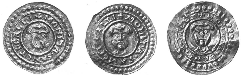
Abb 2: Schriftbrakteaten von Abt Ulrich, 1167–1199.

Im Mittelalter (5.–15. Jahrhundert) zirkulierten im Gebiet der ganzen Schweiz zuerst die merowingischen Tremisses, dann die karolingischen Pfennige. Letztere wurden von weltlichen Herren, etwa Herzog Hermann von Schwaben, oder von geistlichen Herrschaften der Bischöfe und Klöster geschlagen. 240 Pfennige entsprachen zunächst einem Pfund, welches Karl der Grosse 794 zu heutigen 461 Gramm Silber festgesetzt hatte. Aber bald schon brachten es 240 Pfennige nicht mehr auf dieses Gewicht. Im Hochmittelalter wurden die Pfennige immer mehr durch die sehr dünnen und einseitigen Brakteaten abgelöst. Das Kloster St. Gallen begann schon unter Abt Ulrich (1167–1199) mit der Prägung von Brakteaten, ebenfalls Pfennige genannt, welche den Kopf des heiligen Gallus zeigen und auch als «Schriftbrakteaten» bezeichnet werden, weil um den Kopf herum «MONETA SANCTI GALLI» zu lesen ist (Abb. 2).