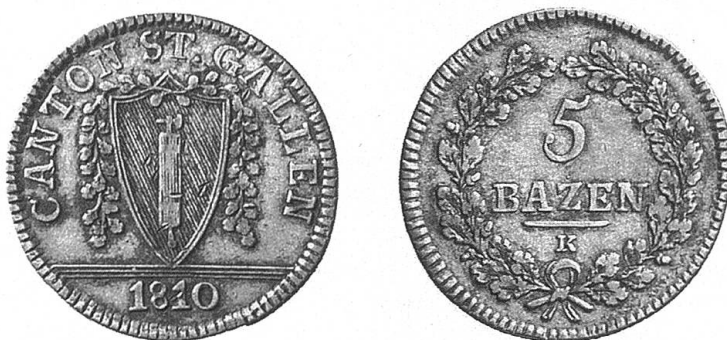
Abb. 7: 5 Batzen (= \frac{1}{2} Franken oder 20 Kreuzer) des Kantons St. Gallen.