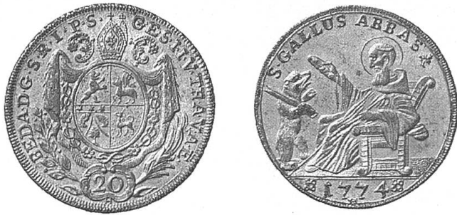
Abb. 6: 20-Kreuzer-Stück (= 5 Batzen) von Abt Beda Angehrn.