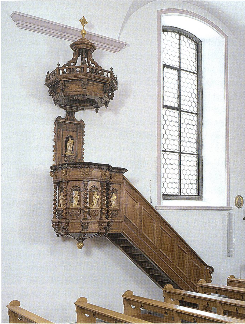
Die Kanzel, 17. Jahrhundert (um 1660), stellt eine aufwendige Tischlerarbeit dar. Die helltonigen Figuren in den Nischen des Korbs und jene in der Rückvertäfelung stammen aus dem 20. Jahrhundert (1904). Foto 2005, Fotostudio Lehmann, St. Gallen.

chen Seitenaltars: Es zeigt die Auferstehung Christi und ist ein 1726 geschaffenes Werk des Vorarlberger Malers Franz Josef Walser (1688–1778), Klaus/Feldkirch. Vom gleichen Künstler und aus derselben Zeit dürften auch die beiden ovalen Obstücke stammen, nämlich die Darstellung von Joachim (?; nördlich) und von Joseph mit dem Jesuskind (südlich). Die auf seitlichen Postamenten stehenden Figuren (Nord-Süd, links-rechts: Elisabeth von Thüringen, Idda von Toggenburg, Laurentius, Aloysius) stammen mit einer Ausnahme (Laurentius, vielleicht noch vor 1720 entstanden) aus dem 19. Jahrhundert, vielleicht aus der Zeit der ersten grossen Innenrenovierung von 1851.