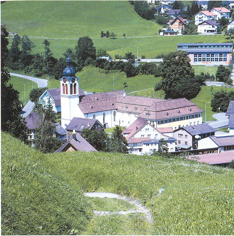
Blick von der Anhöhe südwestlich des Dorfsentrums von St. Peterzell. Im Vordergrund schneidet der stark abfallende Hohlweg tief ins Gelände. Im engeren Sinn handelt es sich um einen Abschnitt des Werts zwischen dem Neckertal und dem Thurtal, im weiteren Sinn um einen Abschnitt der wichtigen Verbindung zwischen dem Bodensee und der Zentralschweiz. Der Weg diente u. a. dem Warentransport, Kirchgängern und Pilgern. Foto: Johannes Huber, 2006.

risches Programm» zu lesen (das der Name zweifelsfrei auch enthält), blickt somit auf eine recht lange Tradition zurück. Das im Jahr 2005 von Prof. Dr. Stefan Sonderegger, Herisau, verfasste Gutachten weitet diesen Zwischenstand der Forschung aus. Aus Stefan Sondereggers Gutachten stammen die nachfolgenden Ausführungen: