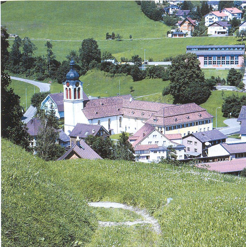
Blick von der Anhöhe südwestlich des Dorfsentrums von St. Peterzell. Im Vordergrund schneidet der stark abfallende Hohlweg tief ins Gelände. Im engeren Sinn handelt es sich um einen Abschnitt des Wegs zwischen dem Neckertal und dem Thurtal, im weiteren Sinn um einen Abschnitt der wichtigen Verbindung zwischen dem Bodensee und der Zentralschweiz. Der Weg diente u. a. dem Warentransport, Kirchgängern und Pilgern.