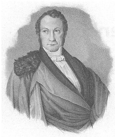
Porträt von Gallus Jakob Baumgartner. Lithographie nach einer Zeichnung von J. Puchta.

Weg bestimmte. Die Verfassung von 1814 behielt diese Ausrichtung bei. 3 Unter diesen Voraussetzungen konnten im Kanton St. Gallen Projekte verwirklicht werden, die der wirtschaftlichen Entwicklung mehr als dienlich waren. Man denke etwa an den Bau der Kräzernbrücke bei St. Gallen oder die neue Strassenführung am Stollberg im Rheintal. Das Toggenburg war damals in die beiden Bezirke Ober- und Untertoggenburg gegliedert, die wiederum in sogenannte Kreise von 2–3 politischen Gemeinden eingeteilt waren.