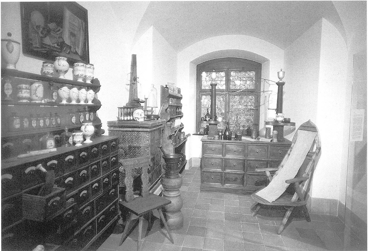
Dr. Forrers Apotheke (heute im Historischen Museum St. Gallen).