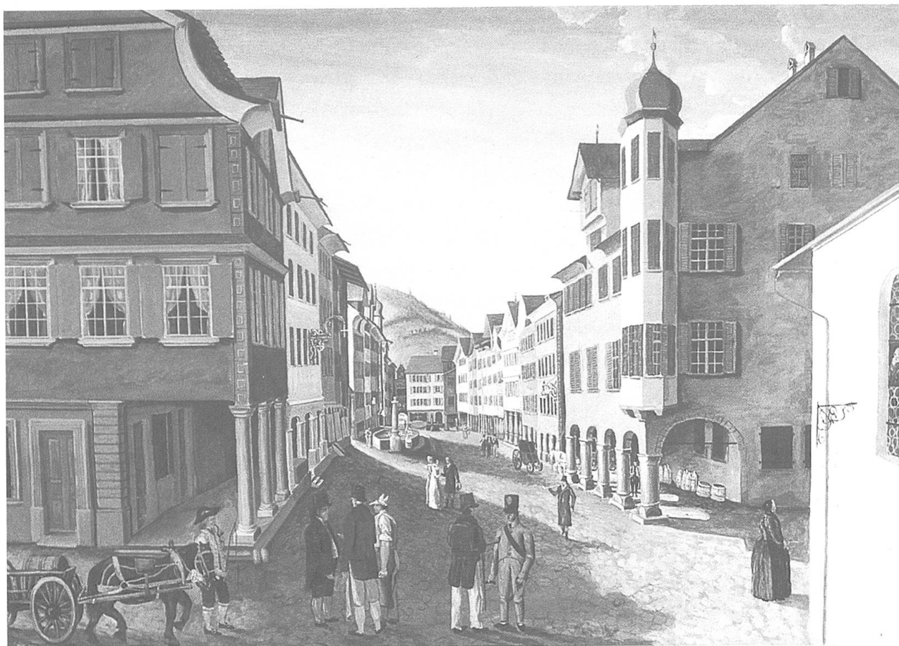
Lichtensteigs Hauptgasse um 1810 (älteste bekannte Ansicht). Gouache im Toggenburger Museum Lichtensteig, Künstler unbekannt.