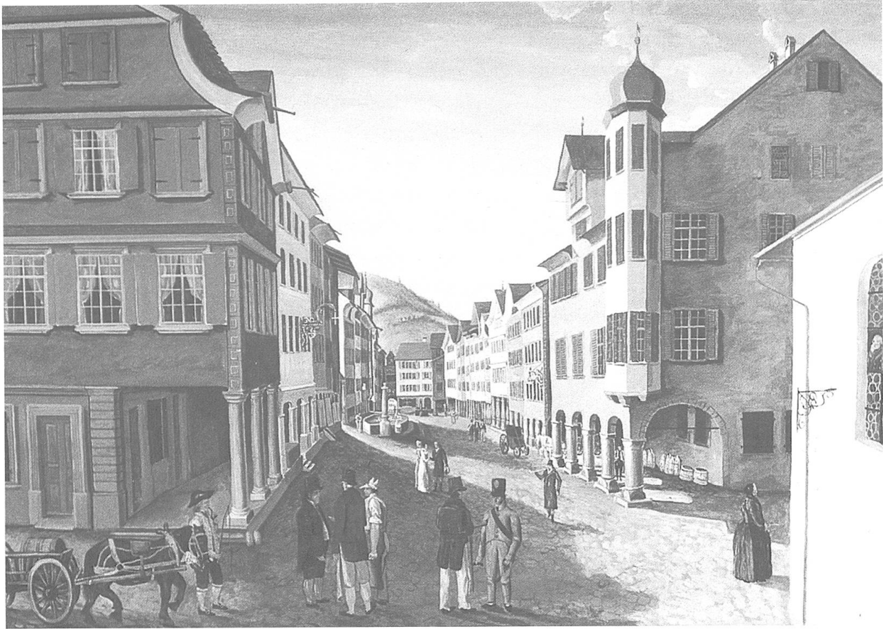
Lichtensteigs Hauptgasse um 1810 (älteste bekannte Ansicht). Gouache im Toggenburger Museum Lichtensteig, Künstler unbekannt.