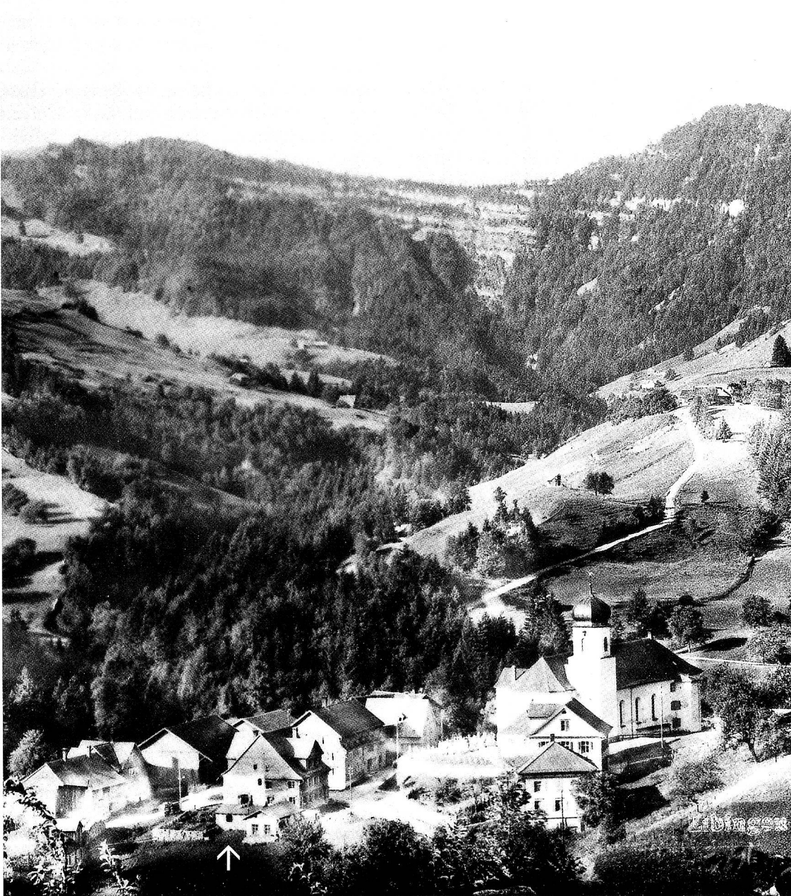
Das Dorf Libingen vor 1910. Das ehemalige Giesserhäuschen des Josef Anton (II) Wohlgensinger ist in der Bildmitte unten sichtbar. Das Sticklokal besteht noch nicht.