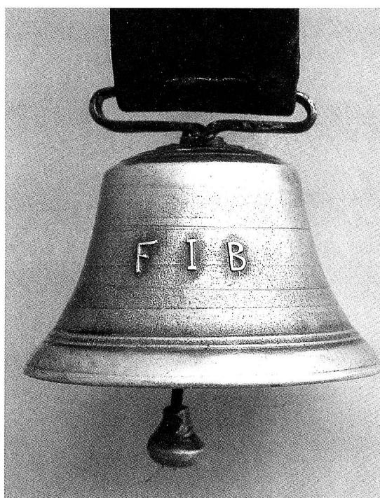
Kuhglocke, ab Liegenschaft Chnüt-Libingen stammend; mit Besitzerinitialen vermutlich: Franz Josef Brändle.

1833 war das Glöcklein im Dachreiter der Wirtschaft zum «Schäfli» in Wiesen, im Mosnanger «Pirg», gesprungen. Das erfahren wir aus dem Gemeinderatsprotokoll. Die kleine Glocke muss von öffentlichem Interesse gewesen sein, wenn sich der Gemeinderat mit dem Schadenfall beschäftigt. Zur Klärung der Frage, was vorzukehren sei – Reparatur oder Neuanschaffung – wird eine Kommission eingesetzt. Neben Gemeinderat Stillhard in Wiesen