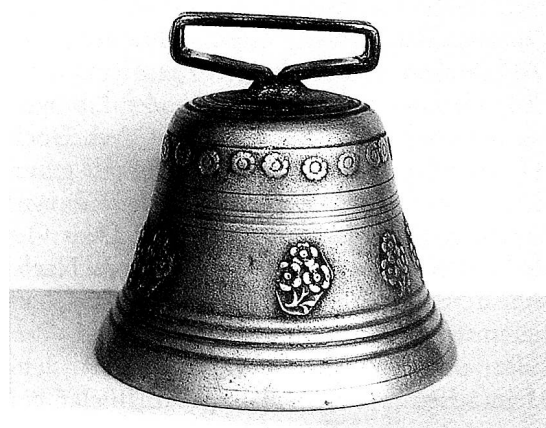
Kuhglocke aus Engelbolgen-Libingen; nach Tradition aus der Giesserei Libingen; Höhe ca. 13 cm. Durchmesser ca. 16 cm.