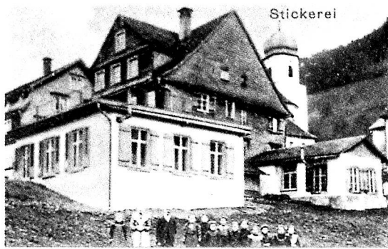
Ehemaliges Giessereihaus Wohlgensinger im Dorf Libingen. Das Stickereigebäude im Vordergrund wurde 1910 erstellt; 1936/37 wieder abgebrochen. Aus Ansichtskarte ca. 1912.

Die Glockengiesserei ist ein wundersam erscheinender Vorgang. Seit Jahrhunderten hat sich kaum etwas daran verändert. Neu sind verbesserte Schmelzöfen und die Maschinen, die nach dem Giessen zur abschliessenden Bearbeitung der Glocken eingesetzt werden. Alles andere ist traditionelle Handarbeit geblieben. Ein Modell in Gestalt der Glocke – «Mutterglocke» oder «falsche Glocke» genannt – wird in den zweiteiligen zylinderförmigen «Formkasten» gebracht; früher wurden auch hölzerne Formkästen verwendet. Hinzu kommt die eiserne Befestigungslasche für Riemen und Klöppel. Die Leerräume um die Mutterglocke herum werden als Kern- und Mantelteil mit einer Mischung aus Quarzsand, Ton und Wasser gefüllt und festgestampft. Die Zusammensetzung des Formsandes gilt als Berufsgeheimnis. In die Formmasse gräbt der Giesser das Eingussloch und sticht die sternförmig angeordneten Eingusskanäle sowie Luftaustrittslöcher aus. Die beiden Teile des Formkastens werden nun sorgfältig getrennt und das Glockenmodell (Mutterglocke) herausgelöst. Auf der Innenseite des Sandformmantels (Negativabdruck der Aussenseite der Glocke) werden in Handarbeit mittels kleiner Buchstaben- und Figurenschablonen Beschriftungen und Verzierungen eingepresst. Mit Lanzette und Formschäufelchen sind Fehler auszubessern. Jetzt fügt der Giesser die bei-