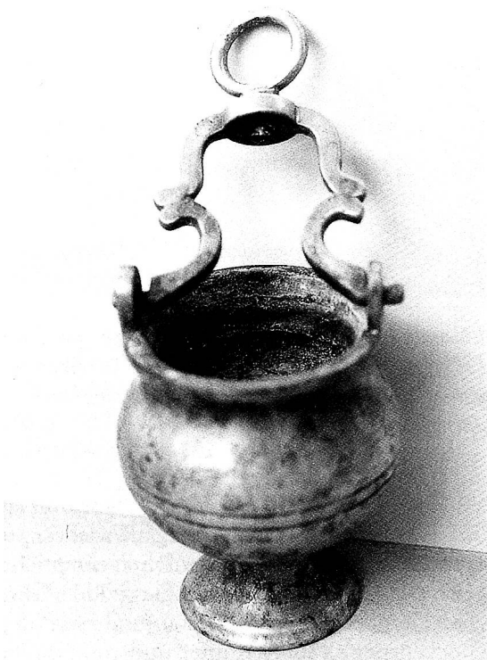
Weihwassergefäß in Messingguss, laut Tradition aus der Giesserei Chratztobel/Libingen.