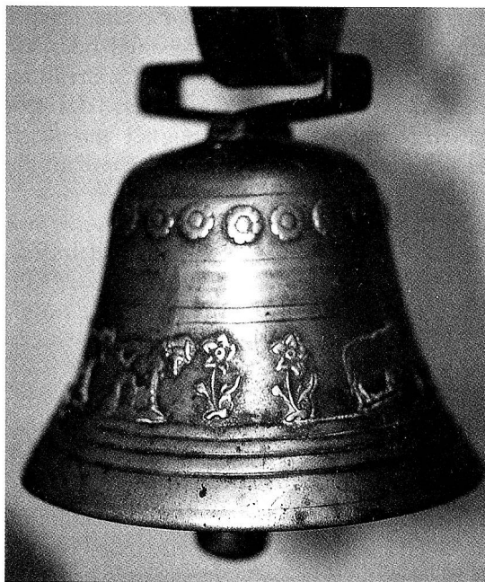
Kuhglocke (Höhe 12 cm, Durchmesser 15 cm), aus Libingen stammend, im Toggenburger Museum Lichtensteig; Herstellerangabe: Wohlgensinger, Libingen.

1856 beschreibt der «Toggenburger Bote» in begeisterten Ausführungen die «Toggenburgische Gewerbeausstellung» im Herbst jenes Jahres. Die einleitende Bemerkung des umfangreichen Zeitungsartikels ist für die Giessergeschichte Wohlgensinger von Bedeutung: «Die Bezeichnung 'Toggenburgische Gewerbeausstellung' ist in der doppelten Richtung in beschränktem Sinne zu verstehen, als sich die Ausstellung nur auf die Bezirke Ober- und Neutoggenburg erstreckt (Alttoggenburg