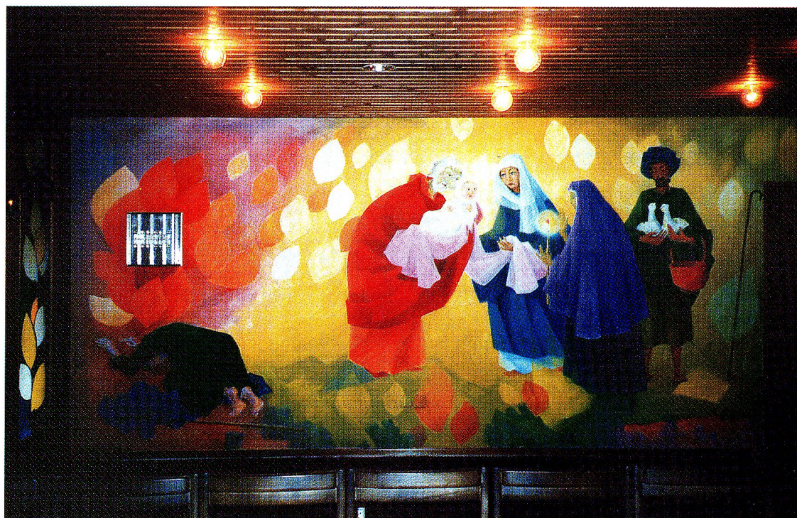
Moses vor dem brennenden Dornbusch und Darstellung im Tempel (Mariä Lichtmess). Wandbild im Alters- und Pflegeheim Bütschwil, 1979.