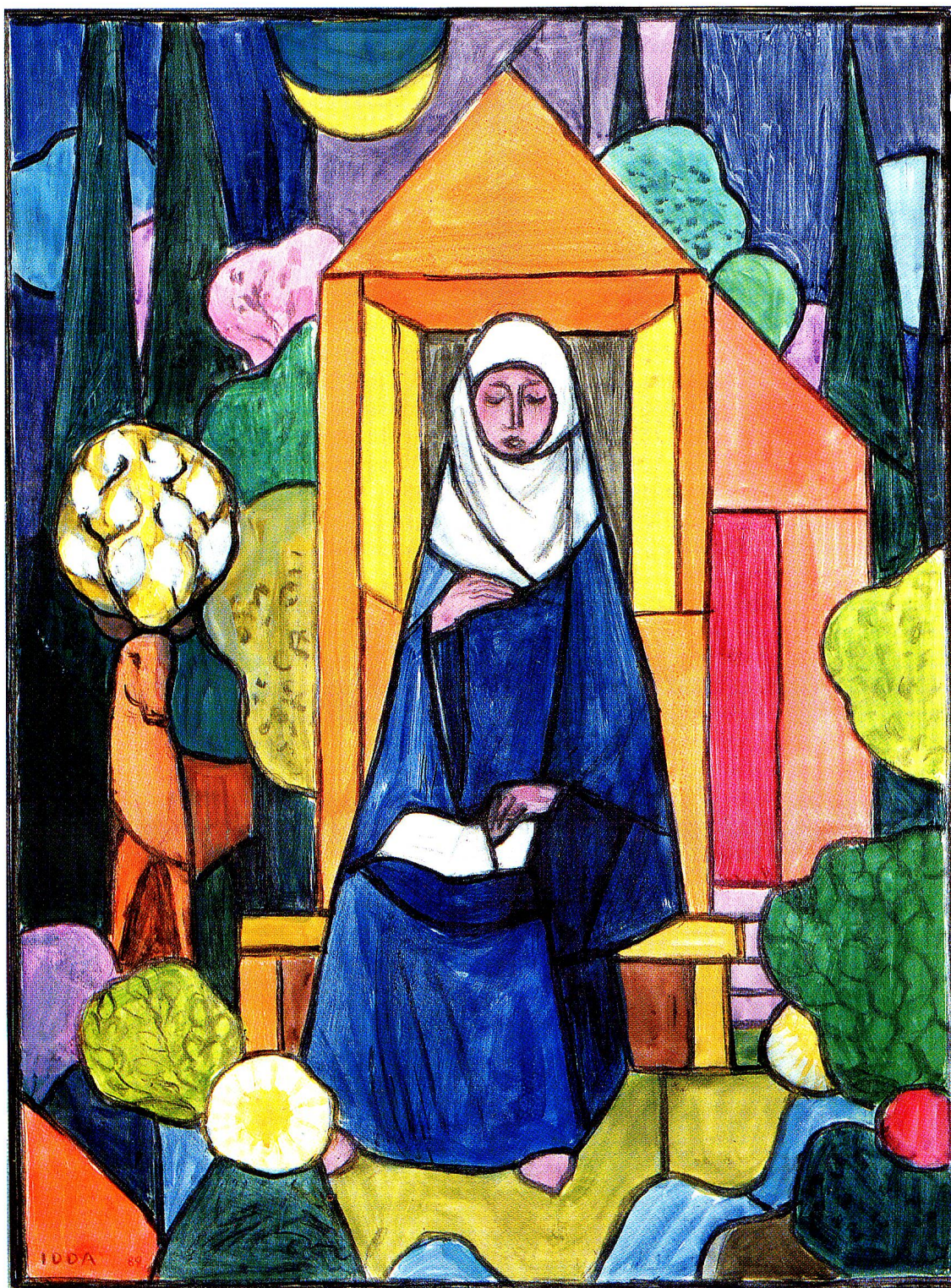
Hl. Idda, Acrylentwurf für ein Glasgemälde im Kloster Fischingen, 1989. Nordflügel des Kreuzganges. – Foto zur Verfügung gestellt.

Die Türen sind farblich ins Bild integriert, und selbst ein lästig Notwendiges, der Deckel zum Feuerwehrrkasten, macht lustig grün-weiss-gestreift dieses Spiel mit.