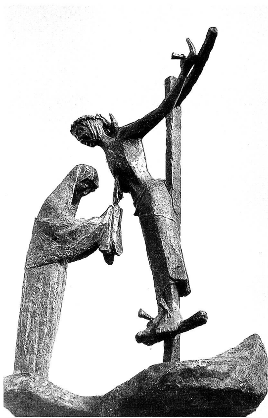
Christus und die Kirche. Bronzegruppe in der Taufkapelle Bütschwil, 1957.

Das Kapellenfenster mit den herab- und aufsteigenden Tauben in ihrer Siebenzahl, Symbol des Heiligen Geistes und seiner besonderen Gaben, auch in den symbolgeprägten Farben Rot, Gelb und Weiss, bezieht sich auf die Taufe nach dem Jesuswort: «Wenn ihr nicht wiedergeboren werdet aus Wasser und Heiligem Geist...» (Joh). Dieses Fenster kann als guter Übergang zu den Glasmalereien (1968) «Engel» in Wattwil angesehen werden, die in der Pfarrkirche Felix und Regula integriert sind. In jedem der schmalen, hohen Fenster bewegen sich in rhythmischer Ordnung und im Zusammenspiel mit streng gebündelten Senkrechten auf blauem Grund Engelscharen, stark stilisierte Wesen mit goldgelbem «Gesicht» und weissen Flügeln – Flügel wie Blüten, die gleichsam musikalisch zu einem Lichtgesang komponiert sind.