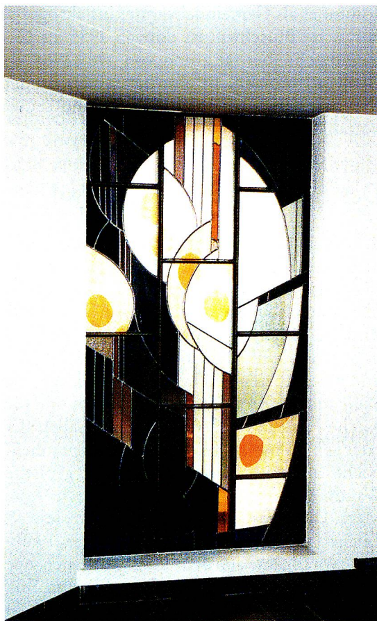
Engelfenster in der Pfarrkirche Felix und Regula in Wattwil, 1968.

schauen, aufnehmend schauen. Links die Reihe mit den sechs schmalen, hohen Fenstern, aus denen es einen anblüht: grossblättrige Blumen in Gelb und Weiss als Knospe, als Kelch, als Lichtblüten mit roten, mit gelben, mit weissen Samenkugeln; in schönem Rhythmus Blütenblätter, die gleichsam emporflammen und die, von den einzelnen Fenstern gebündelt, nicht nur dem Raum ein festlich-verklärtes Licht schenken, sondern auch nach vorn zum Altar und dem grossen Wandbild dahinter führen. Auch hier, von links nach rechts, erscheinen sie in abgewandelter Weise, rot und orange als Flammen dicht um den Tabernakel, und daraus lösen und verteilen sie sich wieder, hell dahinschwebend, als einzelne Blütenblätter auf dem gelbdurchlichteten Hintergrund des Bildes. Dieses fasst zwei Ereignisse zusammen, ein alttestamentliches und eines aus dem Neuen Testament, beide aufeinander bezogen. Solche Bezüge sind schon immer aufgezeigt worden, von den Evangelisten, den Kirchenvätern, in der Liturgie und in der Ikonographie. Etwa Jonas, der nach drei Tagen im Bauch des Fisches wieder ans Licht kommt, als Vorausweisung auf Jesus, der nach drei Tagen aus dem Grab aufersteht. Gleiches hat unser Malermönch in seinen Glasmalereien 1961 für