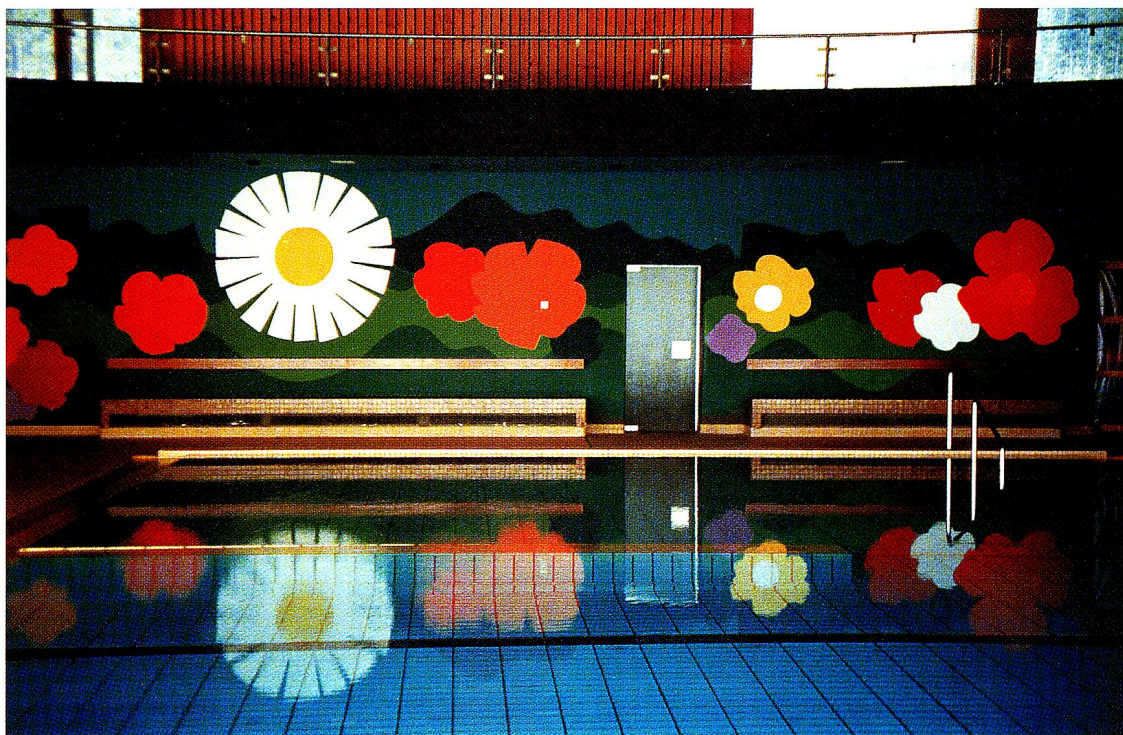
Wandbild im Hallenbad in Bütschwil, 1981.

Der Vorraum zu Sporthalle und Schwimmbad ist farbgestimmt eine einzige Einladung. Froh und heiter bewegt präsentiert sich die ganze Breite der Wand in prallem Farbleuchten, in Orange, Gelb, Rot, Violett und Grün, teils satt, teils in hellen sich wandelnden Abstufungen. Und dazwischen in markantem Weiss, ein «Ballspiel» mit vielerlei Bällen, die im Bogen dahinsausen, zeitlupenhaft nacheinander grösser und kleiner werden und aufgefangen von einer spielenden Dreiergruppe, die mit expressiv erhobenen Armen wie ein Mann dasteht, den Ball hält und wieder abgibt, von oben treppab in den unteren Raum. Und das spielt so treppab und treppauf in heiterem Ernst und überwindet und verbindet das Oben und Unten in sportlicher Leichtigkeit.