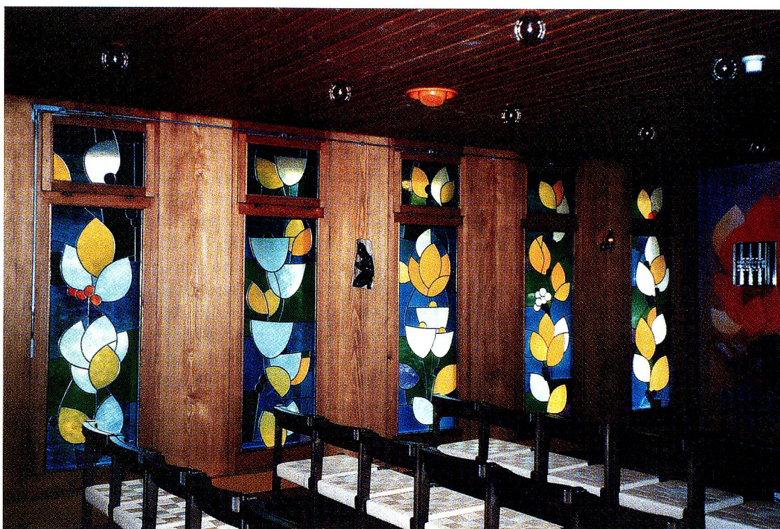
Blumenfenster in der Kapelle des Alters- und Pflegeheims Bütschwil, 1979.