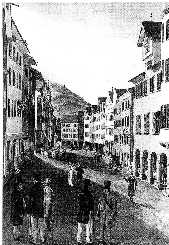
Lichtensteig um 1805. Anonyme Gouache im Toggenburger Museum. In der «Krone» rechts (heute Hauptgasse 14) waren 1814 die Brüder des russischen Zars und die französische Exkaiserin Marie Louise zu Gast.

Die Bürgerschaft versammelte sich auf dem Rathaus, um sich vom abgesetzten Landvogt