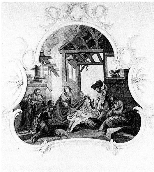
Hemberg, katholische Pfarrkirche. Geburt Christi und Anbetung der Hirten. Fresko an der westlichen Rückwand von Jakob Josef Müller, 1782, aufgedeckt und restauriert 1971/72 nach Abbruch einer 1870 eingebauten Empore, welche die Abbrederis-Orgel trug.