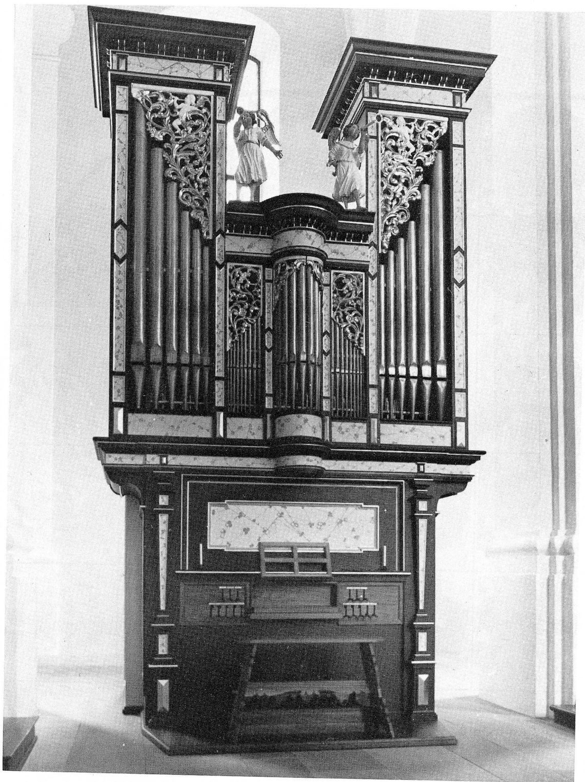
Neu St. Johann. Barockorgel von Matthäus Abbrederis, erstellt 1690 für die paritätische Pfarrkirche Thal, 1883–1972 in der katholischen Pfarrkirche Hemberg, 1989/90 restauriert und teilweise rekonstruiert von Orgelbau M. Mathis & Söhne, Näfels. Seit 1990 im Chor der Klosterkirche aufgestellt. Frontseite.