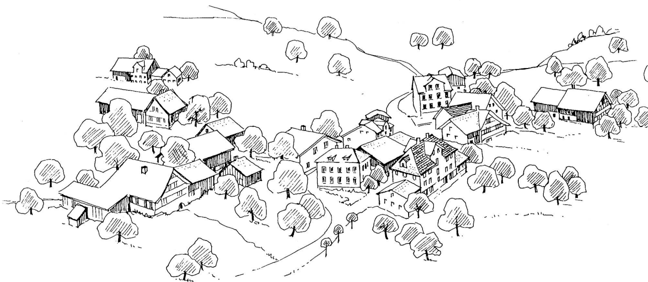
Grämigen um 1905