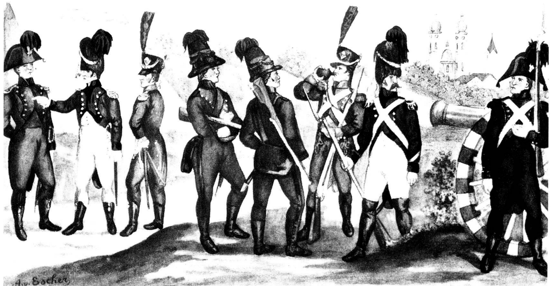
St. Gallische Legion 1810.

Kolorierte Lithographie von Albert von Escher (1833–1905).