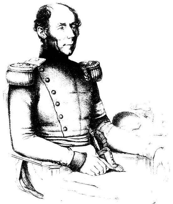
General Guillaume Henri Dufour (1787–1875), Oberbefehlshaber der eidgenössischen Armee im Sonderbundskrieg. Lithographie von Ludwig Wegner nach einer Zeichnung von Julius Karl Sulzer, 1848.

In einer niedrigen Wohnstube bei trübem Öllichte war das Hauptquartier des Brigadestabes. Alles blieb sozusagen unter den Waffen und sofort wurde auch eine starke Offizierspatrouille nach Udligenschwil abgesandt, um erstens wieder Verbindung mit dem Divisionsstabe zu haben und zweitens auch, um für den Morgen zu einem allfälligen Angriffe auf Küssnacht eine Batterie auf dem rechten Flügel der Brigade zu erhalten. Im übrigen verlief die Nacht ruhig, nur dass einige Schüsse fielen, die etwas Aufregung brachten. Von Abkochen oder sonstiger Proviantausteilung war keine Rede, so angenehm dies auch gewesen wäre. In aller Stille ohne Feuer und ohne irgendwelche Signale wurde die ganze Nacht zugebracht, und sobald der Morgen graute, hatten wir auch die