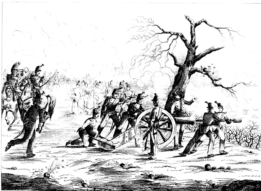
DIE BERNER BATTERIE NOLL VOR DER GROSSEN SCHANZE BEI HETLIKON AM 23. NOV. 1847.

Noch zwei weitere Tage hatten wir in diesem Biwak zu bleiben, bis wir dann am 26. November mittags von der Brigade Isler abgelöst wurden. Gleichentags ging es dann über Buonas und Cham nach Baar, wo wir Quartier beziehen konnten, was wir nach den vorangegangenen vier kalten Nächten im Biwak sehr gerne annahmen. Auch den folgenden Tag blieben wir in Baar, wo wir doch unsere Kleider wieder einmal austrocknen und etwas herstellen konnten. Dieser Rasttag wurde besonders auch zum Briefeschreiben benutzt und es wird dabei gewiss manch tiefgefühltes Gott sei Dank zum Ausdruck gekommen sein.