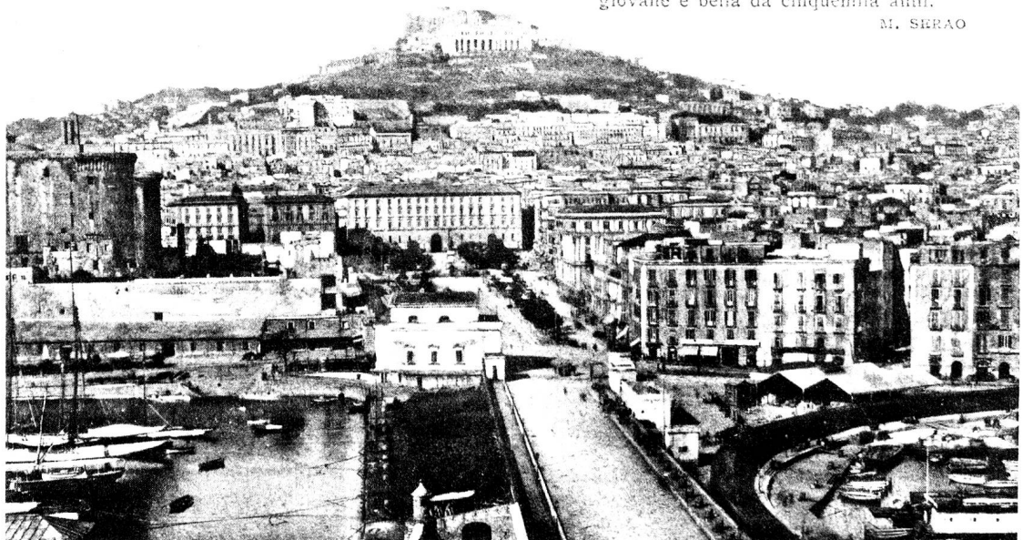
Neapel nach alter Ansichtskarte.