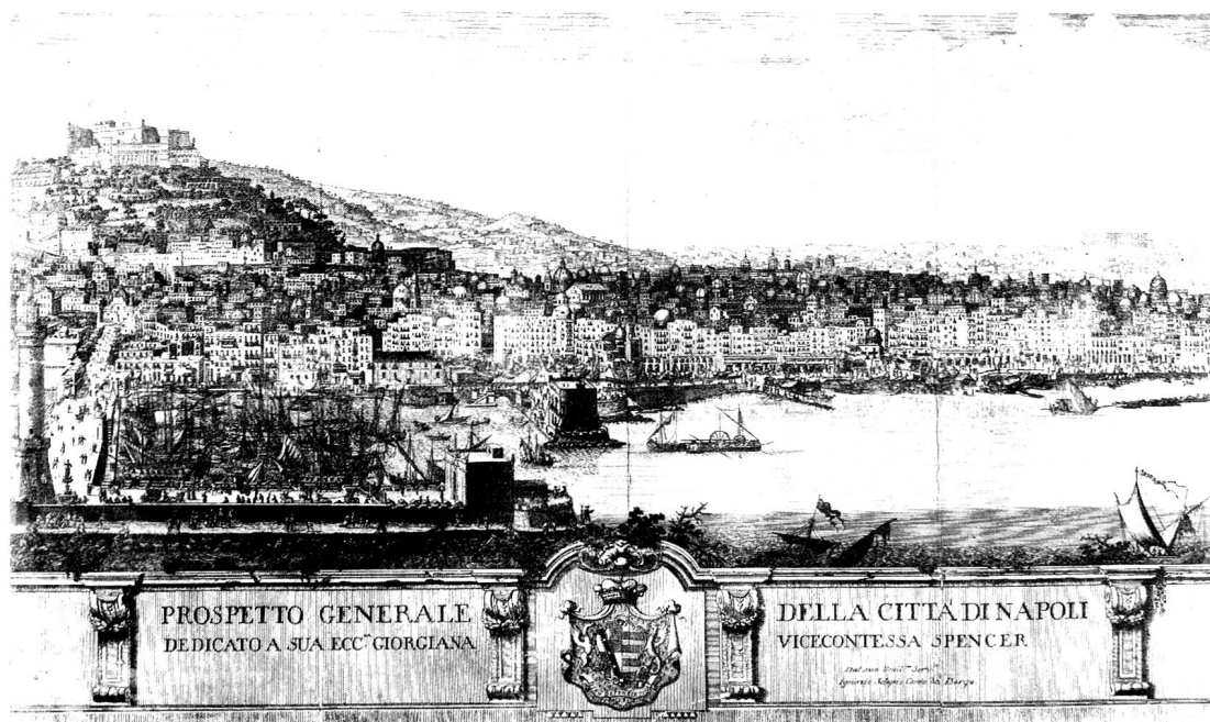
Ein zeitgenössischer Stich von Neapel. Das Fort St. Elmo ist auf dem Hügel am linken Bildrand zu sehen.

Schlupp, Herzog, Matt, Koller, Frei, Haag, Zieg-