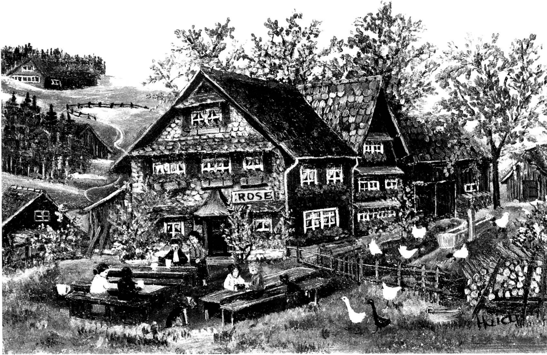
Gartenwirtschaft in Appenzell, Oel, 13 x 18 cm.

Jugend. Seither hat es – wenn man das von jedem Weiler und Hof sagen könnte – kaum etwas von seinem ursprünglichen Charakter eingebüsst.