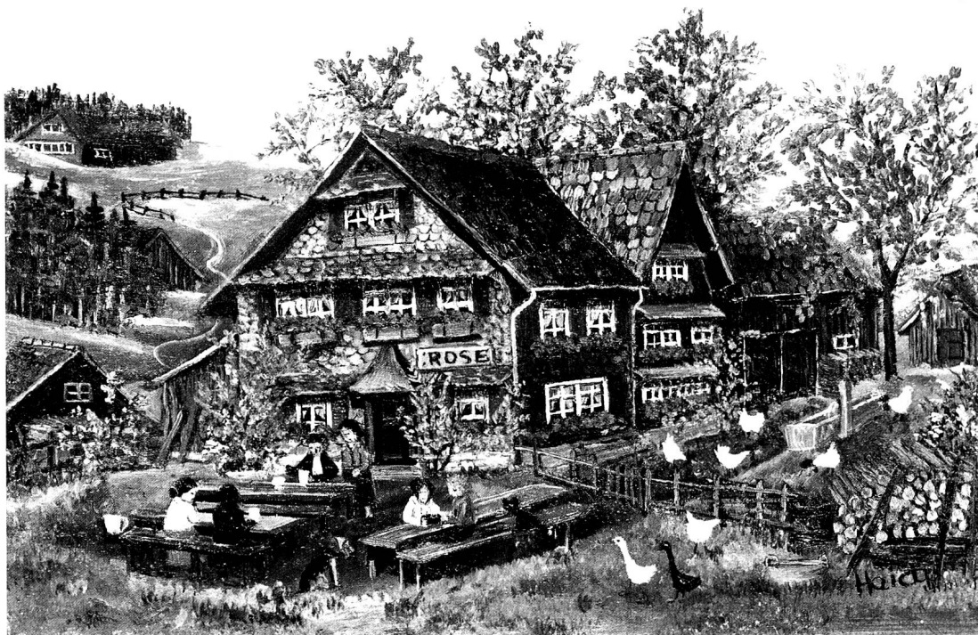
Gartenwirtschaft in Appenzell, Oel, 13 x 18 cm.

Jugend. Seither hat es – wenn man das von jedem Weiler und Hof sagen könnte – kaum etwas von seinem ursprünglichen Charakter eingebüsst.