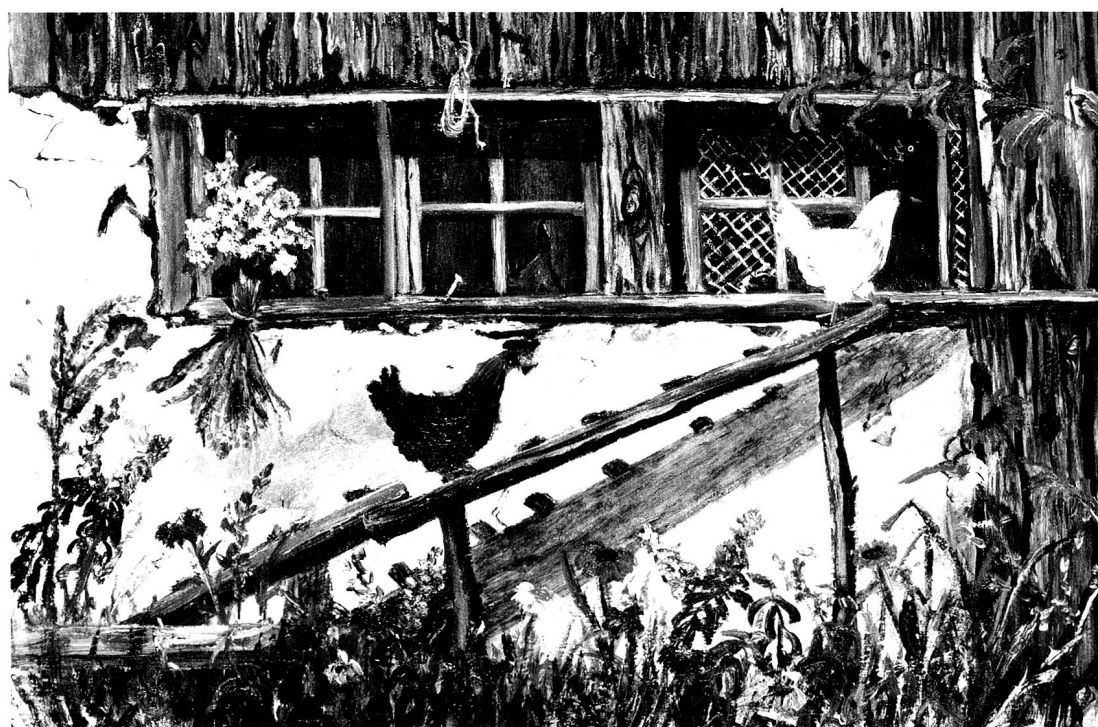
Stilleben, Oel, 13 x 18 cm.

Umgebung der Stadt, aber noch mehr in der Heimat ihrer Grosseltern im Bernbiet, die Schönheiten der Natur und das gesunde Bauernleben. Sie genoss die Blueschzeit, die summen- den Bienen, das Vieh auf der Weide, die Hühner im Hof, die Zeit der Reife und Ernte. Sie freute sich an üppigen Gärten, an duftenden Wiesen, aber auch an der Stille des Winters.