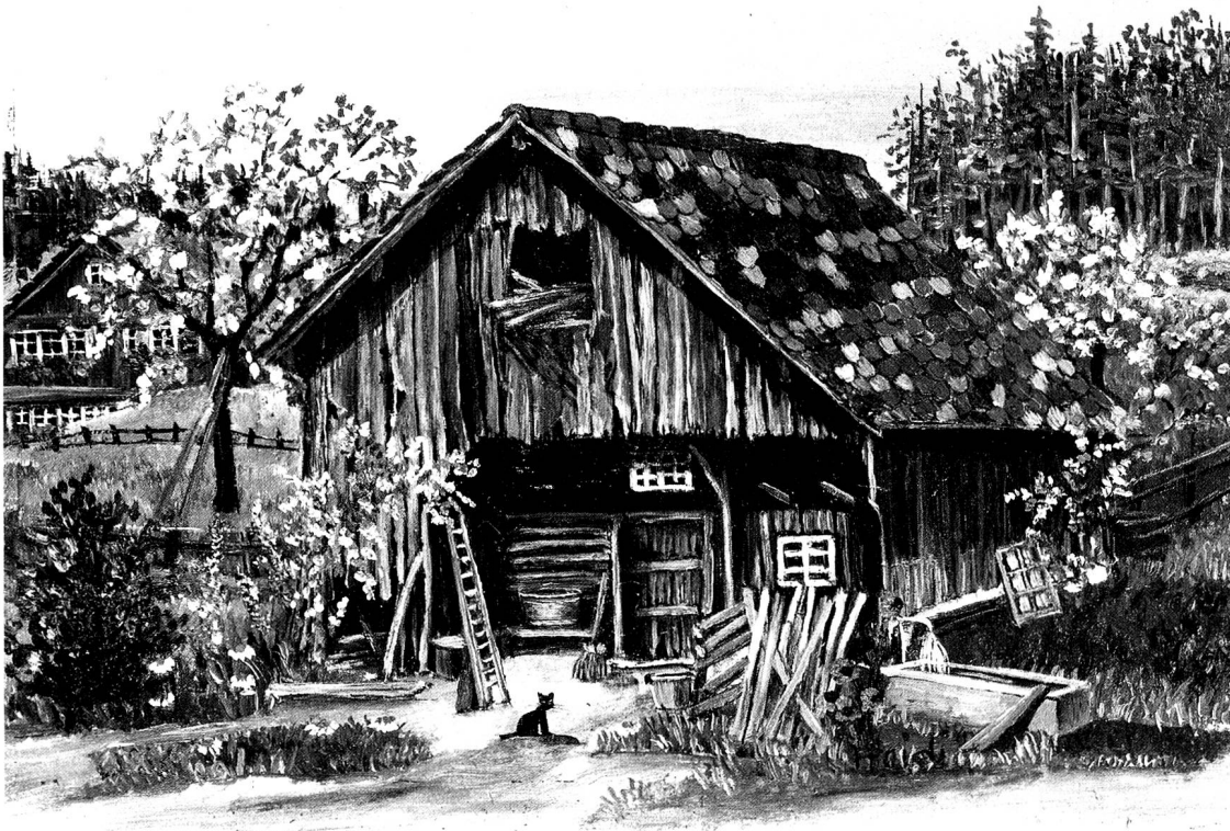
Stall bei Lutenwil, Öl, 13 x 18 cm.

rendes dabei ist, so lässt es die Künstlerin einfach weg.