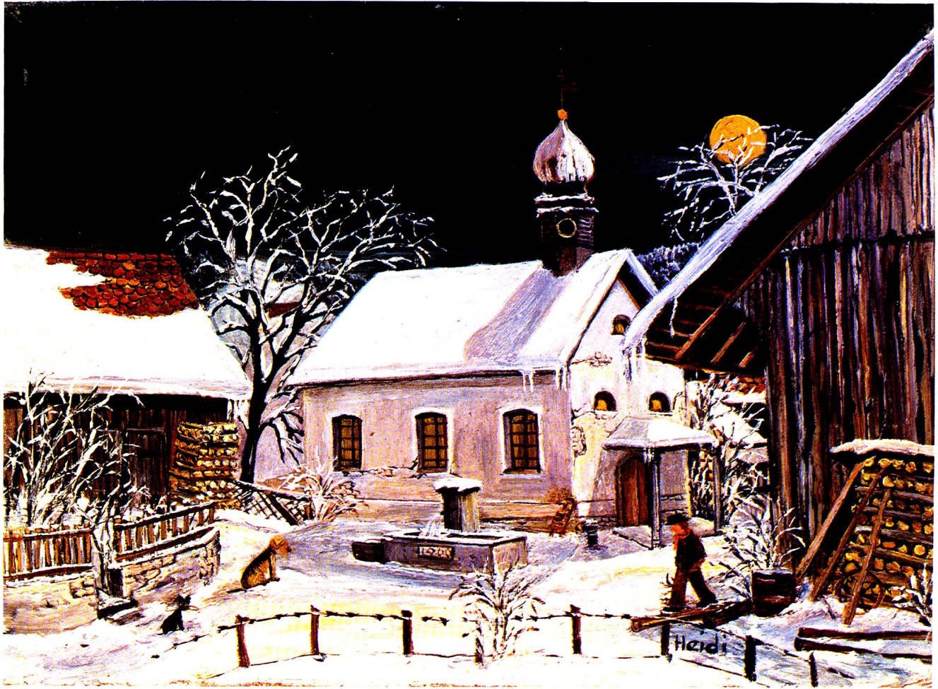
St.Laurentius-Kapelle, Bazenheid, Oel, 13 x 18 cm.