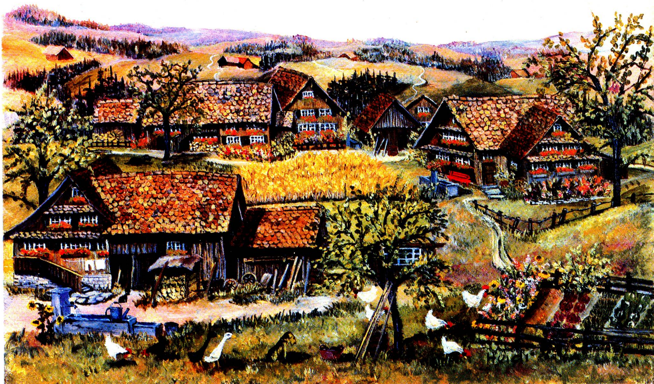
Sommeridyll, Öl, 18 x 24 cm.