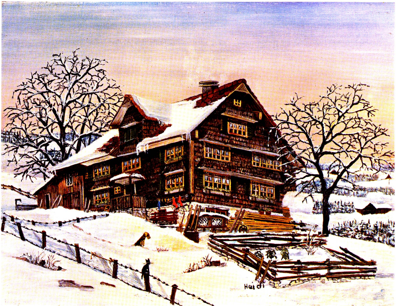
Haus bei Husegg bei Nesslerau, Oel, 18x24 cm.