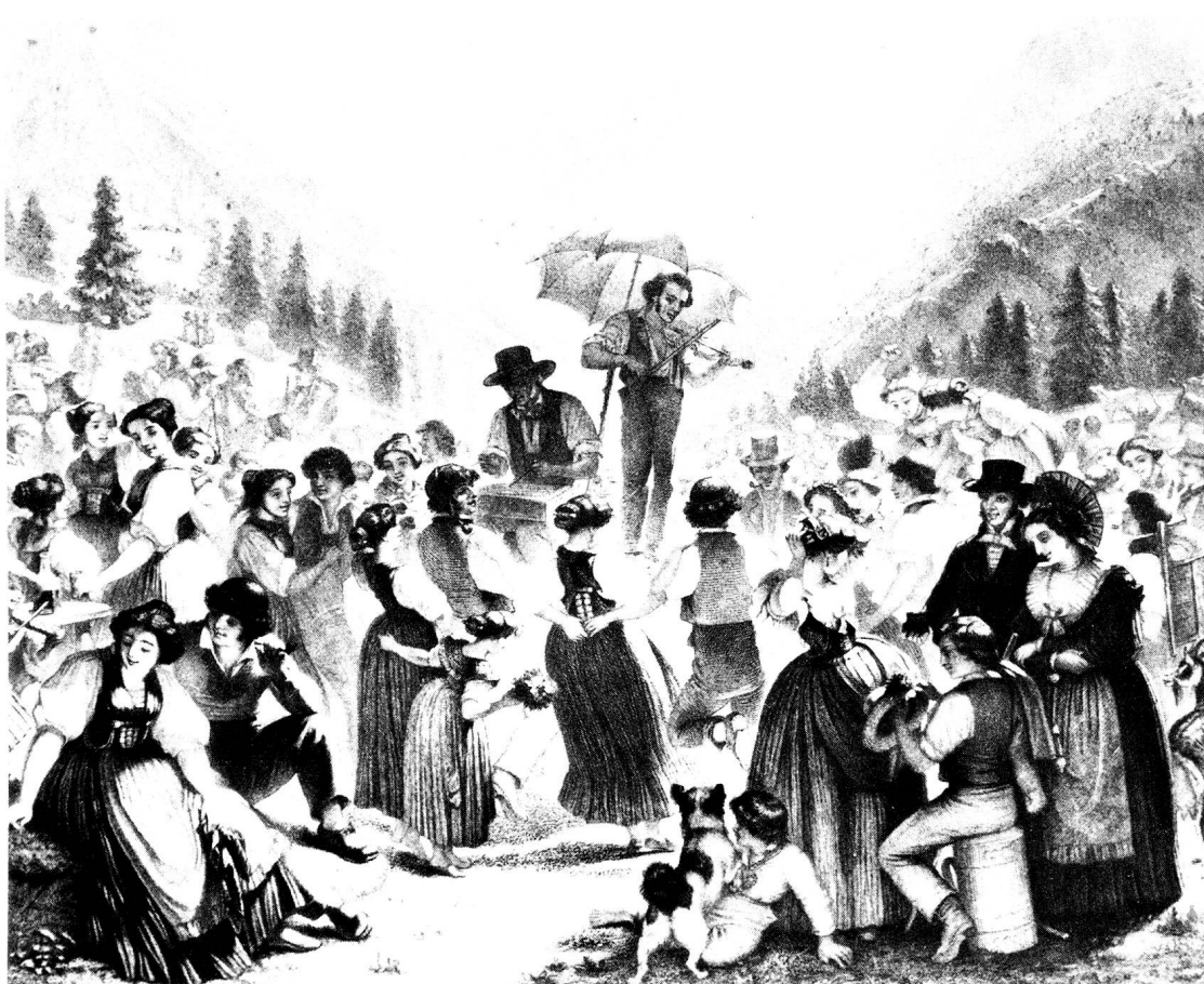
(Abb. 3) Musik mit Geige und Hackbrett: «Stubeten auf Alp Soll im Sentisgebirge» mit Säntisersee, Hundstein und Altmann. Gemälde von Emil Rittmeyer, St.Gallen.