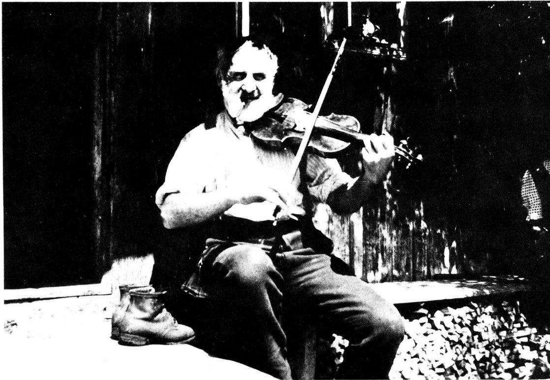
(Abb. 2) De Gigeboge Hanessli im Tobel, Hüsliberg.