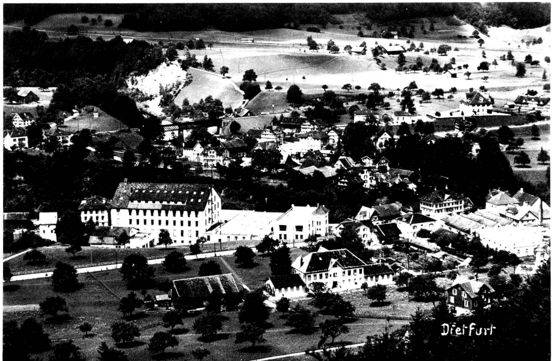
Dorf-Ansicht um 1930

Vor rund 120 Jahren begann für das Dorf eine eigentliche Blütezeit, als die Textilindustrie Einzug hielt. Es platzte geradezu aus seinen Nähten. Im Jahr 1859 erfolgte die Gründung der Buntweberei J. B. Schönnenberger. Im gleichen Jahr öffnete die Baumwollspinnerei ihre Tore. Ins Jahr 1861 geht die Errichtung der Appretur