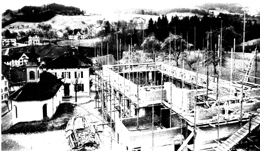
Bau der Kapelle, Einweihung 1933. Daneben die alte Kapelle.

Zwei Rutengänger stellten in der Nähe der Quelle weitere Wasservorkommen fest, und unter Beizug von Ing. Minger und Dr. Knecht aus Zürich erhärtete sich, dass es sich hier um ein grosses Grundwasservorkommen handelt. Der Bau eines Pumpenhauses mit einer 250 Ltr./Min. Pumpe wurde beschlossen.