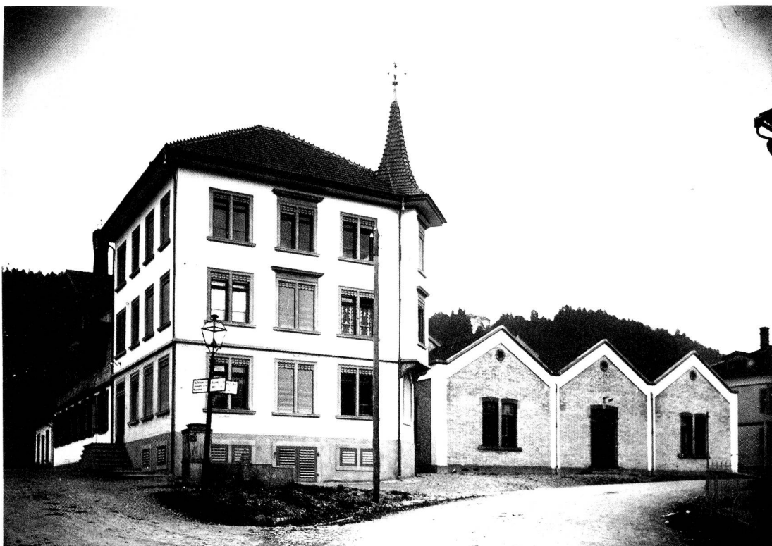
Die Buntweberei Schönenberger in den Zwanzigerjahren. Zu beachten ist auch die alte Strassenbeleuchtung.

Das steuerbare Vermögen bezifferte sich auf Fr. 499 600.--, während das Assekuranzkapital mit Fr. 632 500.-- ausgewiesen wurde. Vom Vermögen wurden 3 Rp. und vom Versicherungswert 2 Rp. pro Fr. 100.-- Dorfsteuer erhoben. Für das Anzünden und Ablöschen der Petrollaternen erhielt der Laternenanzünder Fr. 150.-- Jahresgehalt. Die Personalzulage an den Dorfschullehrer bezifferte sich auf Fr. 200.--.