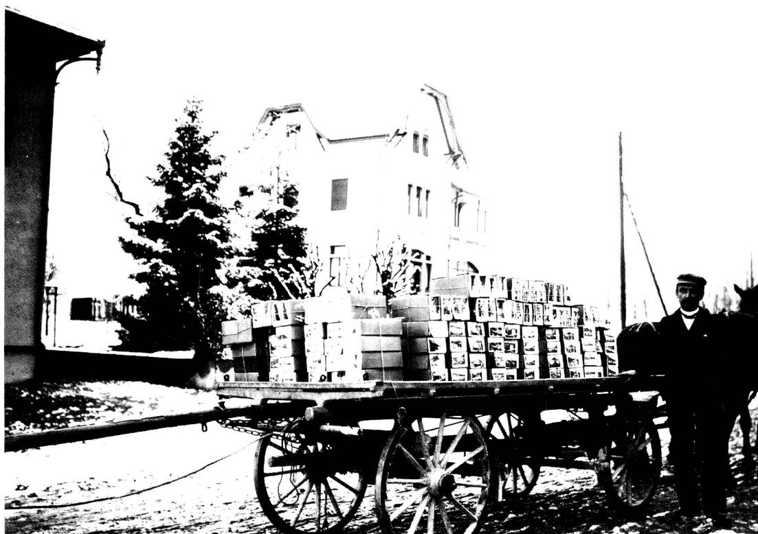
Alfred Lichtensteiger, Karten-Verlag, beim Abliefern einer Sendung auf dem Bahnhof Dietfurt.