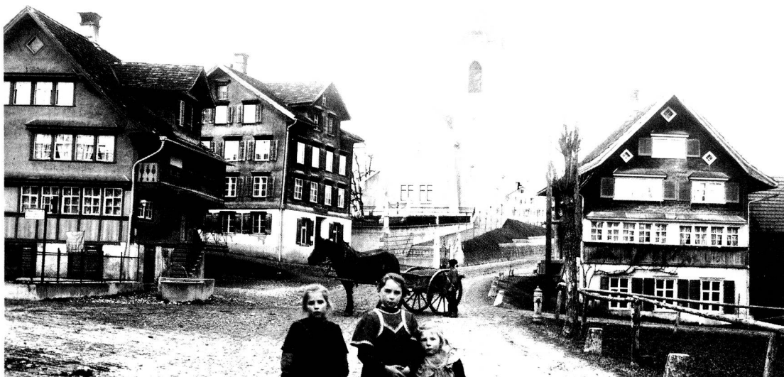
Dietfurt, im Bächli, um 1910

Ebnöter für einen Wassermotor musste wegen Wassermangels abgelehnt werden. Die Tobelackerquelle wurde dem Reservoir zugeleitet.