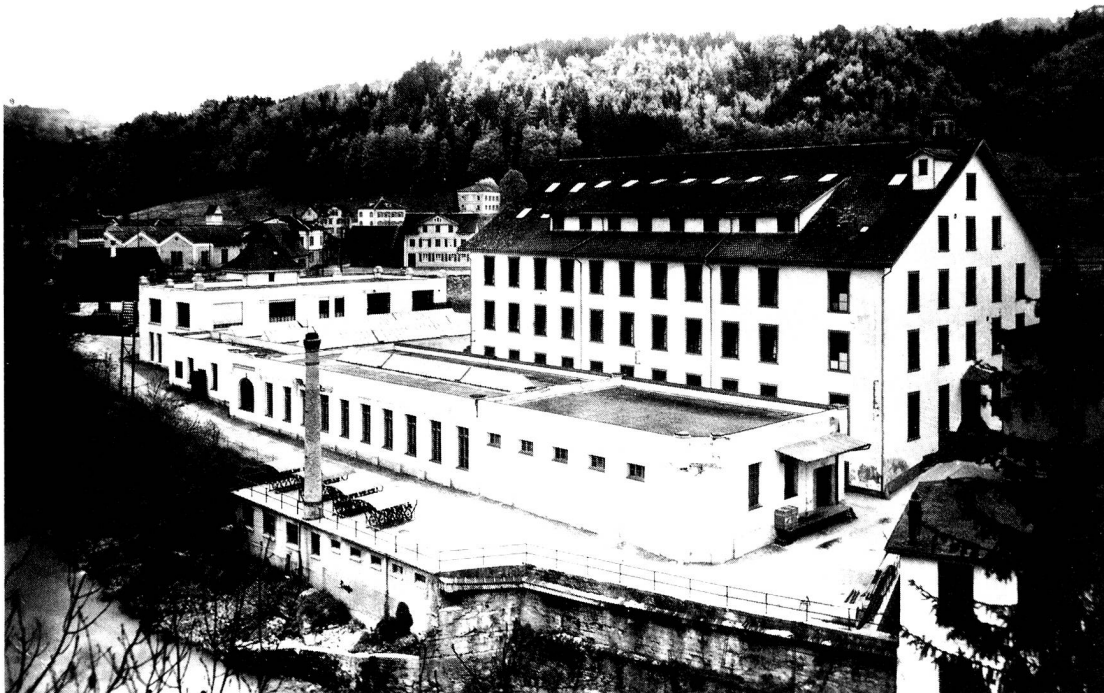
Spinnerei und Weberei Dietfurt AG