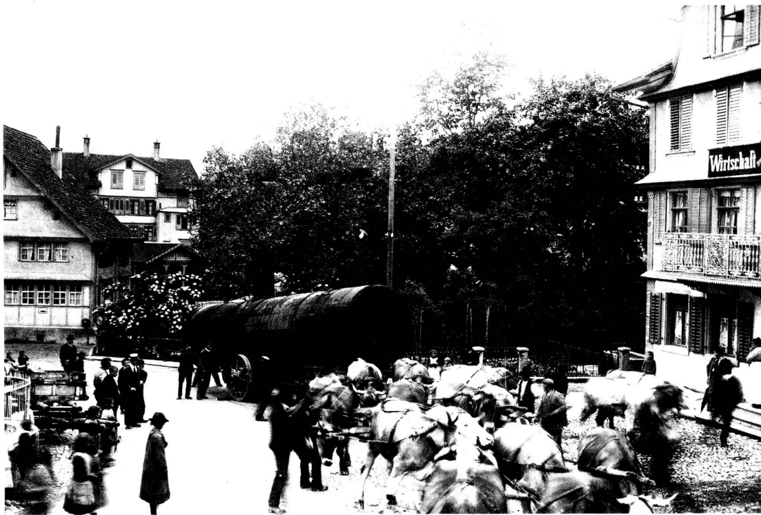
Ein aussergewöhnlicher Transport durch das Dorf Dietfurt