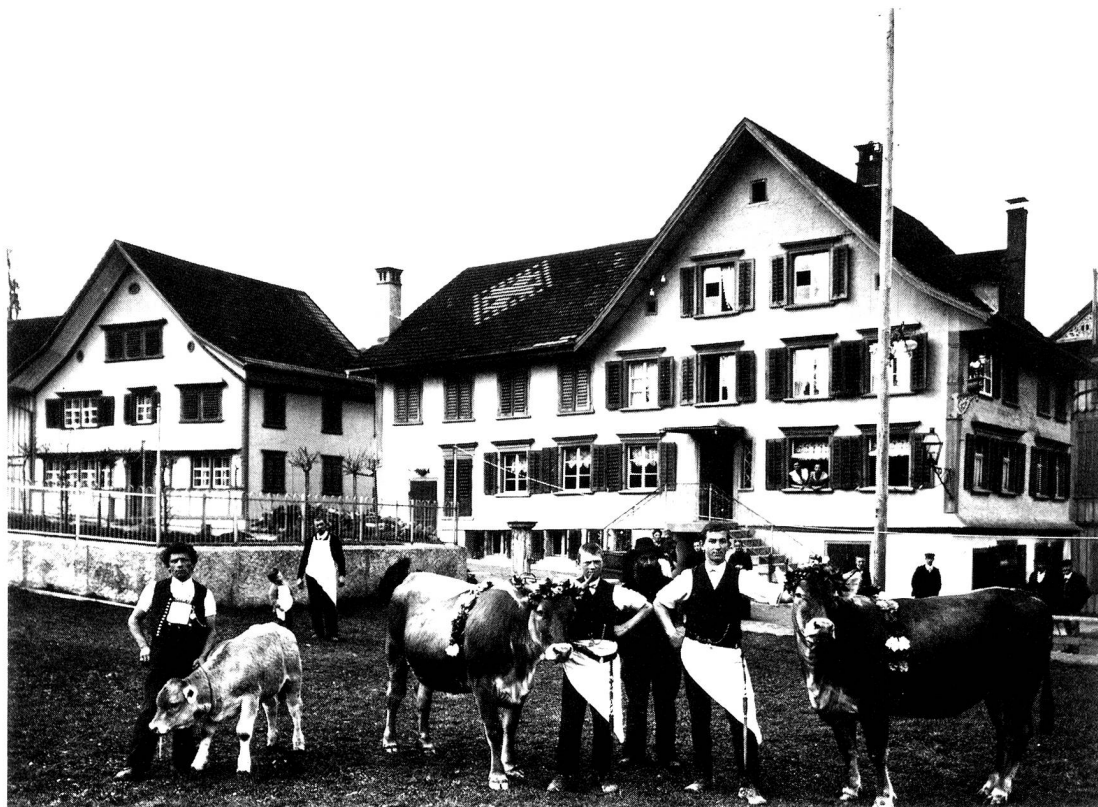
Wirtschaft und Metzgerei zum «Ochsen», Dietfurt um ca. 1910

Auf dem Bilde sind mit Kränzen um den Leib und die Hörner gezierte Rinder zu sehen. Es handelt sich um einen alten Brauch, welcher früher in der ganzen Ostschweiz heimisch war. Die schönsten Schlachttiere wurden bis kurz vor Ostern behalten, dann vom Verkäufer vor der Ablieferung mit bunten Kränzen geschmückt. Die Metzgerburschen führten diese gekränzten Tiere vor der Schlachtung durch's Dorf. Hernach wurden die Metzgerburschen und der Lieferant mit einem üppigen Mahl, das mit viel Wein begossen wurde, bewirtet. Auch viele andere Leute des Dorfes nahmen oft an diesem «Feste» teil. – Der Brauch wurde in Dietfurt bis ca. 1940, als die Fleischrationierung einsetzte, durchgeführt.