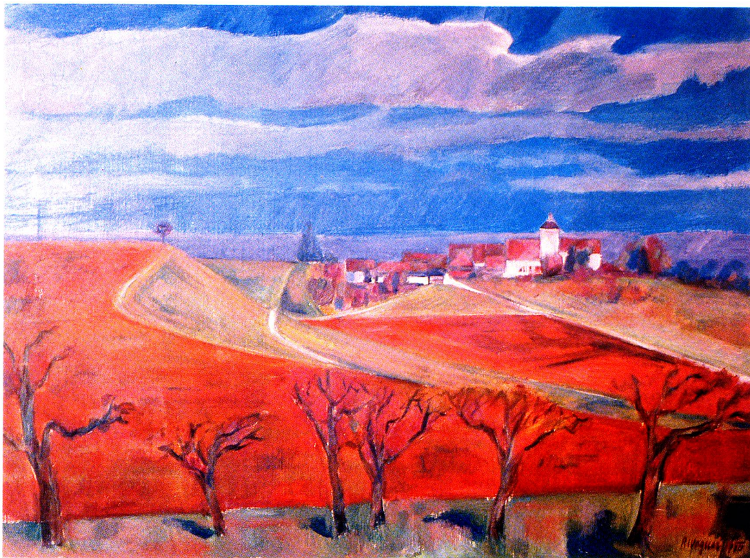
«Schloss Watt» bei Mörschwil, Öl, 1975

Kunst der 30er und 40er Jahre und der Ars Sacra-Bewegung, die uns Denkmalpflegern noch immer etwas suspekt ist. Er wusste erstaunlich gut Bescheid über das ganze damalige Kunstgeschehen im Kanton St. Gallen. Für ihn war es mitgelebte und erlebte Kunst. 1974 wurde Richard Wagner Aktivmitglied der GSMBA Sektion Ostschweiz und beteiligte sich mit Aquarellen und Ölbildern, meist Landschaften in Verbindung mit Architektur, die im heimatischen Toggenburg, Appenzellerland, Emmental, aber auch im Ausland entstanden sind, regelmässig an Ausstellungen im Stadttheater und in St. Katharinen, zudem in Zürich, Glarus, Sitten und Eglisau. Ein Werk besonderer Art widmete er in den 60er Jahren seinem Heimatdorf Bazenheid: drei Vogelperspektiven in der Art von Merian (vgl. Toggenburger Annalen 1979, S. 56-58). Dabei ist es keine Schau von heute, sondern eine mittels Bilddokumenten zusammengetragene Rekonstruktion des noch intakten Ortsbildes aus der Zeit des Ersten Weltkriegs.