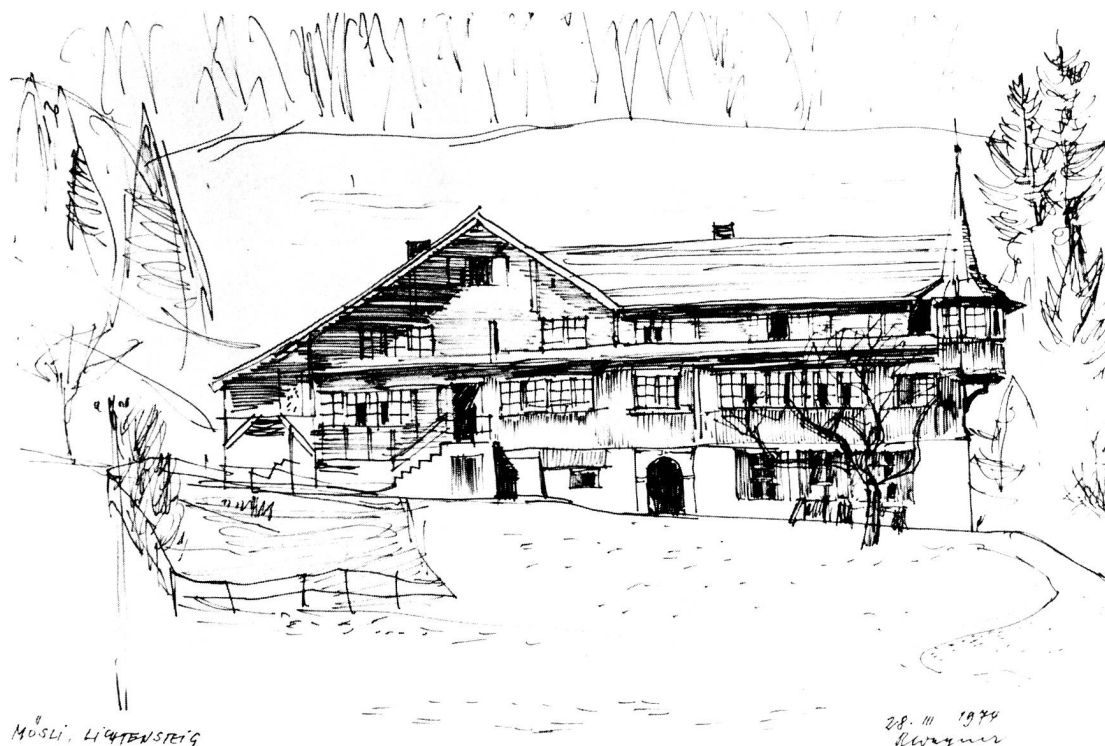
«Mösl», Gemeinde Wattwil, Tusche, 1974