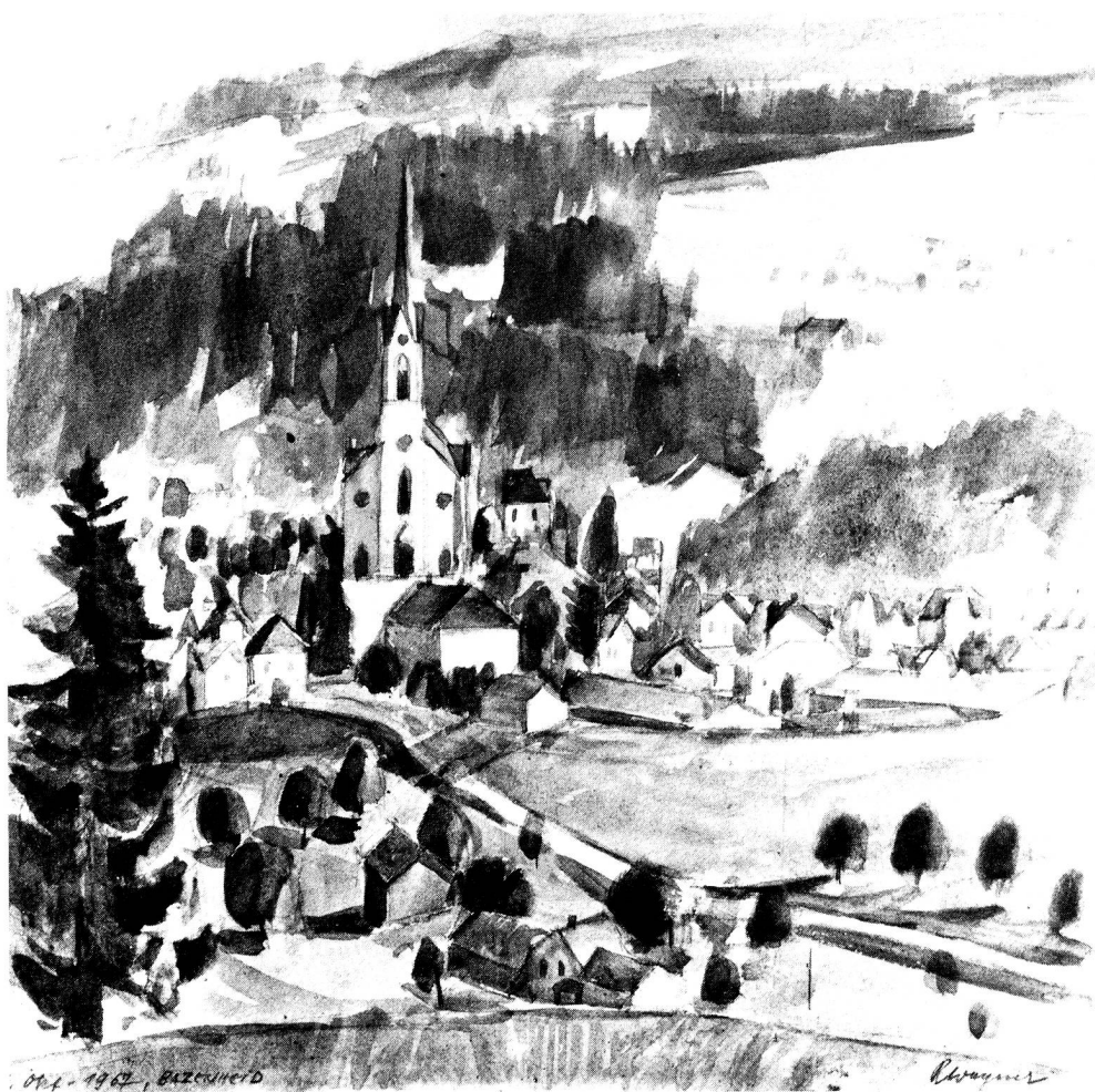
Bazenheid, Aquarell, 1967