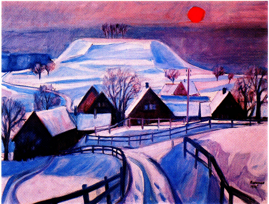
Winzenberg, Lütisburg, Öl, 1974