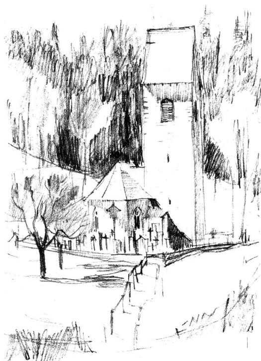
«St. Verena», Magdenau, Bleistift, 1949