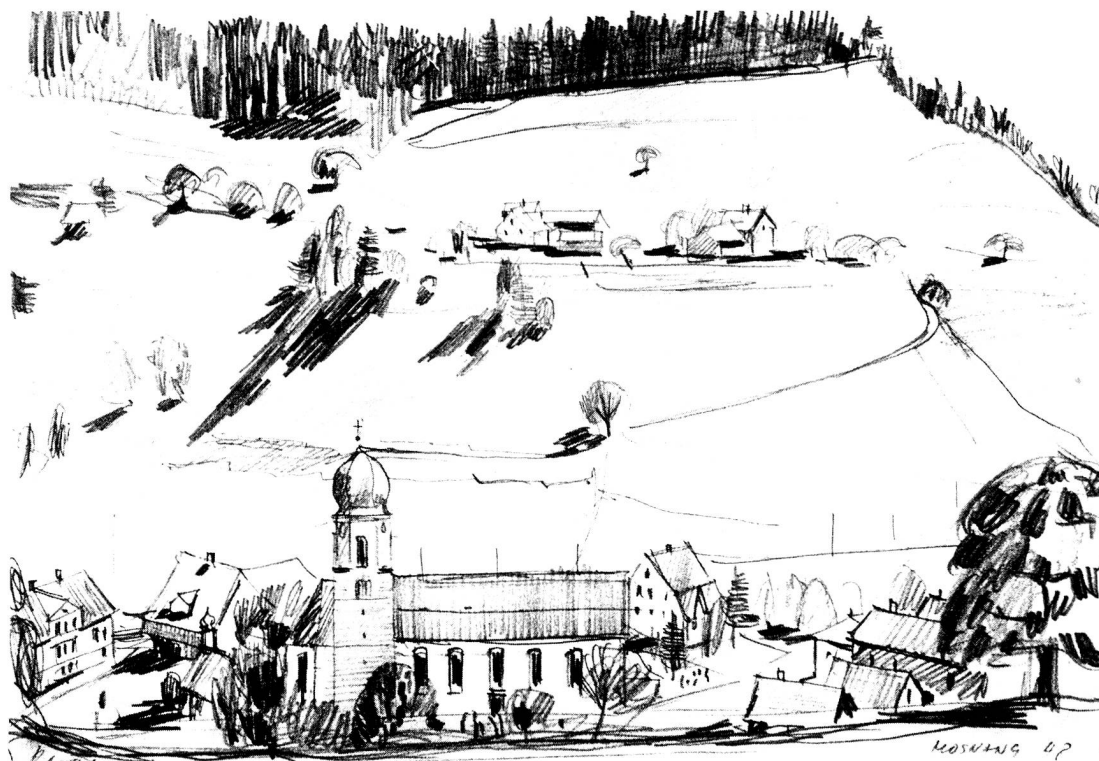
Mosnang, Bleistift, 1948