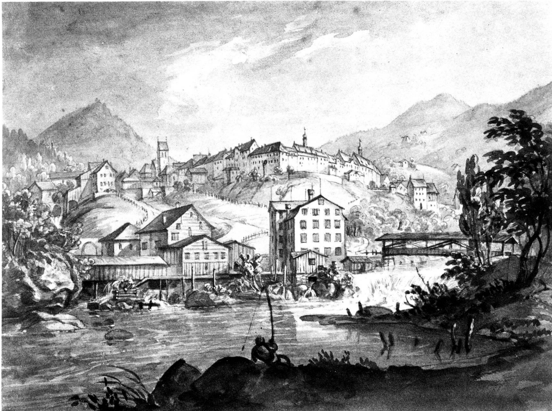
Lichtensteig im Toggenburg. 20. März 1834. Aquarell über Bleistift, stellenweise weiss gehöht.