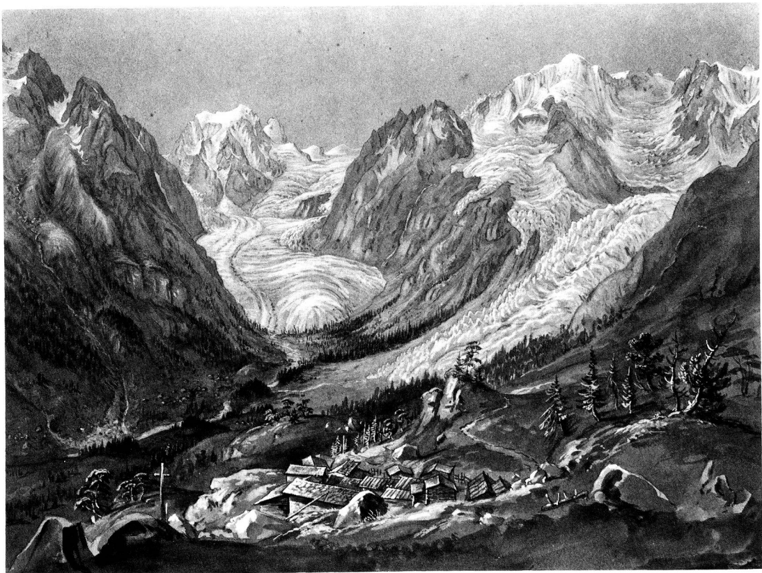
Glacier de Tsidjiore Nuove (rechts) am 1. August 1835. Im Vordergrund das Dörfchen Arolla, im Hintergrund links der Arolla-Gletscher. Bleistift, Aquarell, Deckfarbe auf bräunlichem Papier. 22,8 x 29,8 cm.