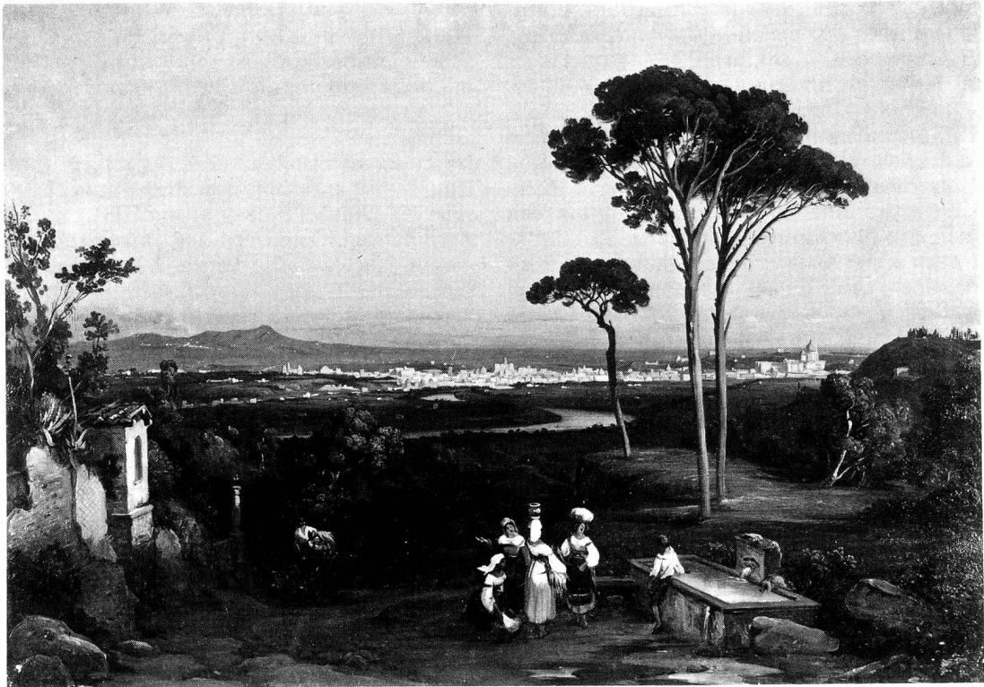
Ansicht von Rom gegen das Albanergebirge 1844. Oelskizze auf Papier. 27,2 x 53,5 cm.