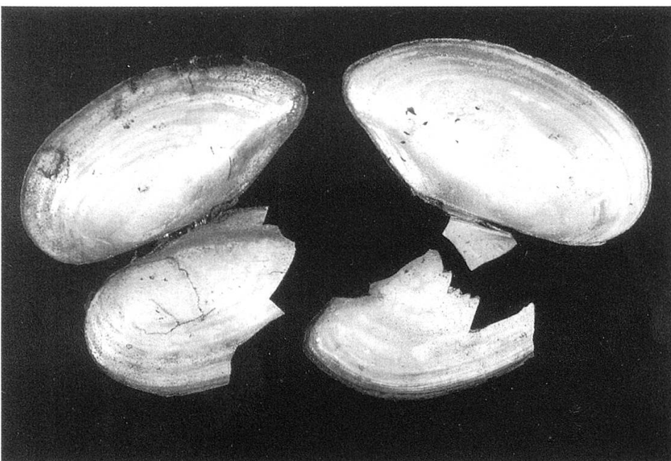
Abbildung 1: Die angeknabberten Muschelschalen sind Überreste von Bisamratten-Mahlzeiten

Die auffälligsten sind die beiden Arten von Teichmuscheln, die auf dem Seegrund leben, die Grosse Teichmuschel Anodonta cygnea und die Gemeine Teichmuschel A. anatina . In einem Tauchbericht des Zoologischen Museums aus dem Jahr 1972 wird von vielen grossen Teichmuscheln aus einer Tiefe von 0,5 bis vier Metern berichtet, die kaum vergraben und aufrecht im Substrat steckten; zum Teil waren die Wanderfurchen deutlich sichtbar. Doch war bereits damals der Schlammboden über zwei Metern Tiefe praktisch unbelebt. Im Jahr 1991 fanden die Taucher zwar nebst vielen leeren Schalen auf dem Seegrund auch lebende Tiere,