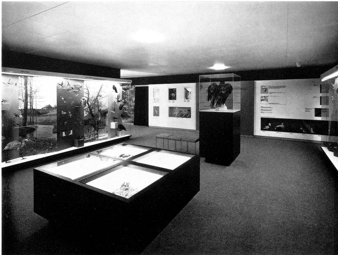
Raum «Vögel des Thurgaus». Auf naturimitierende Dioramen wurde verzichtet. Farben, grafische Darstellungen und Grossfotos schaffen die nötigen Beziehungen und erklären ökologische Zusammenhänge.