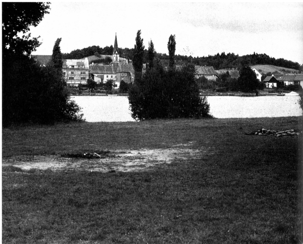
Der 1922 dem Publikum frei gegebene sechs bis acht Meter breite Uferstreifen ist im Laufe der Jahre auf Kosten des wertvollen Trespen-Halbtrockenrasens beträchtlich erweitert worden. Gegenüber der Schaarenwiese, am deutschen Rheinufer, liegt die Ortschaft Büsingen.