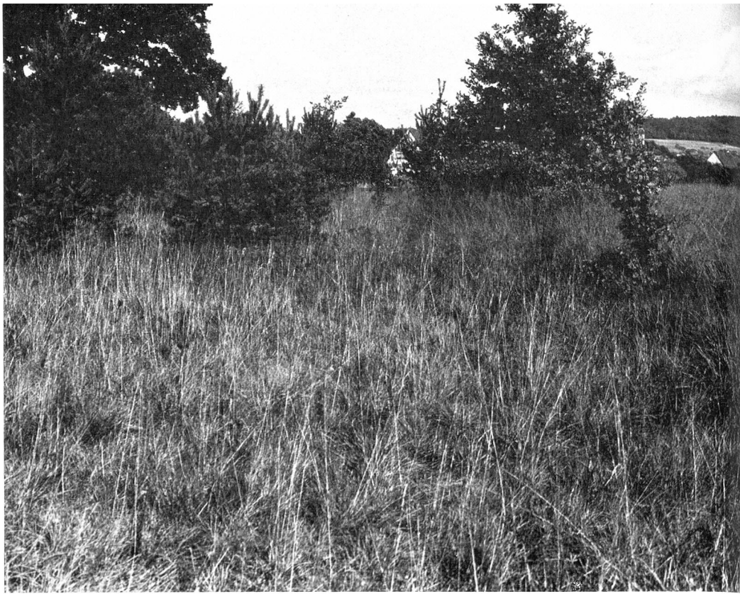
Blick auf den Trespen-Halbtrockenrasen der Schaarenwiese. Die zunehmende Verbuschung stellt eine ernste Gefahr für das vegetationskundlich-floristische Prunkstück auf der Kuppe der ehemaligen Kiesinsel dar.