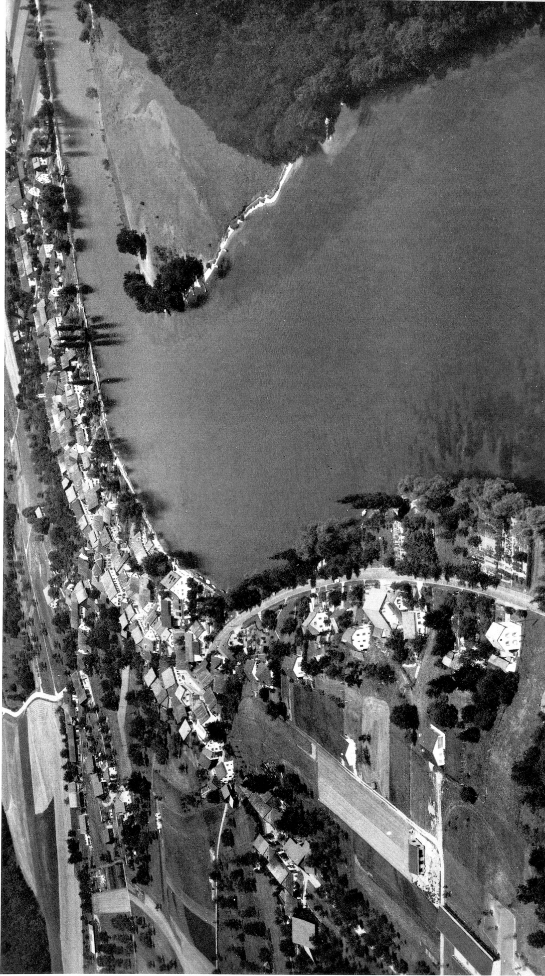
Gegenüber dem auf deutschem Hoheitsgebiet liegenden Dorf Büsingen springt die Schaarenwiese knieartig in den Rhein vor.