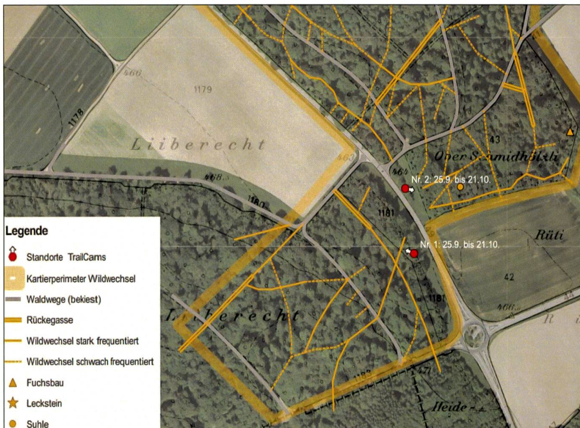
Abbildung 3: Aufzeichnung der Wildwechsel und weiterer Wildtierbeobachtungen. Karte: Kaden und Partner.

In Schlatt wurde hierfür zuerst die Wildhut im betroffenen Jagdrevier befragt. Mit diesen Informationen liessen sich zusätzlich die Wildtierspuren und -wechsel in den an die Strasse angrenzenden Waldgebieten kartieren ( Abbildung 3 ). Die direkten Wildtiernachweise wurden dann mit Wildtierkameras an insgesamt fünf Standorten durchgeführt. Die Wildhut meldete auf diesem Abschnitt für das Jahr 2015 eine hohe Anzahl an Fallwild von 10 bis 15 Tieren. Die genaue Anzahl hängt dabei nicht nur vom Verkehrsaufkommen, sondern auch entscheidend von der angebauten Kultur auf der Landwirtschaftsparzelle auf der gegenüberliegenden Strassenseite ab. Vor allem Fuchs, Wildschwein, Reh und Dachs fielen dem Strassenverkehr zum Opfer. Bei kleineren Säugetieren wie z. B. Mauswiesel, Hermelin, Eichhörnchen oder Igel ist zudem eine hohe Dunkelziffer anzunehmen, welche nur schwer abzuschätzen ist ( Meier & Rieder-Schmid 2015 ). Die hohe Dunkelziffer kommt dadurch zustande, dass bei einem Unfall mit einem kleinen Tier der Aufwand einer Meldung vom Verkehrsteilnehmer als zu aufwendig angesehen wird. Denn bei einer Kollision mit einem kleinen Tier entsteht meist kein Schaden am Fahrzeug und eine Meldung bei der Polizei für eine Anmeldung bei der Versicherung wird nicht benötigt. Oder es findet keine Meldung statt, weil der Fahrzeugführende den Unfall nicht einmal bemerkt hat.