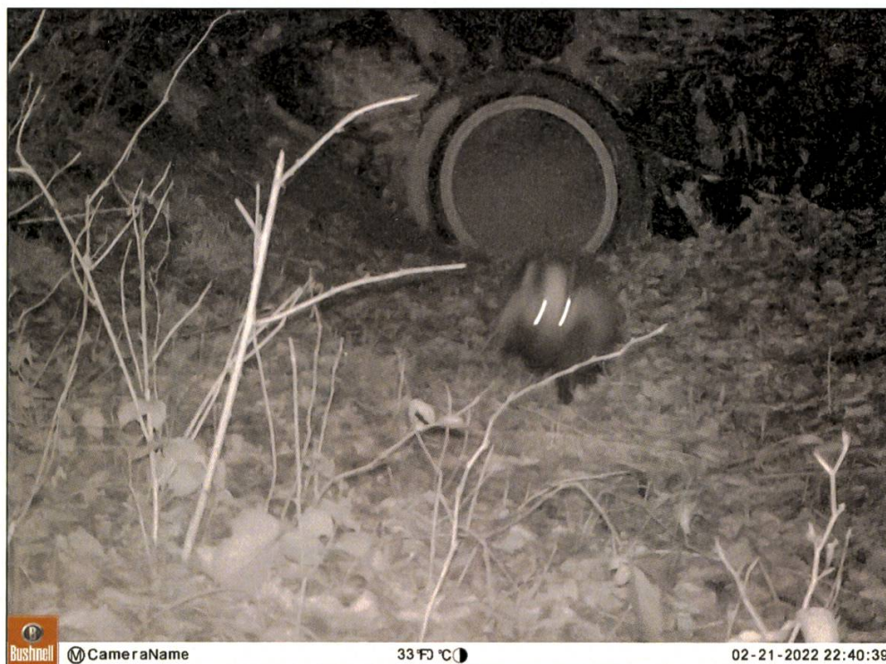
Abbildung 1: Ein Dachs verlässt den Kleintierdurchlass am 21. Februar 2022 um 22.40 Uhr auf östlicher Seite.

Kleine und mittelgrosse Säugetiere wie Fuchs, Dachs, Marder und andere Arten leben im schweizerischen Mittelland zumeist im Wald. Dort jagen sie, ziehen ihren Nachwuchs auf und wandern, sobald der richtige Zeitpunkt gekommen ist, in ein anderes Gebiet ab. Gründe dafür sind die Suche nach ergiebigeren Jagdgebieten oder Fortpflanzungspartnern. Die Wanderungen sind aber auch sehr wichtig für den genetischen Austausch zwischen Wildtierpopulationen. Um sich von einem Ort zu einem anderen zu begeben, legen die Wildtiere zum Teil weite Distanzen zurück. Unser dichtes Strassennetz zwingt sie dabei immer wieder zur Überquerung der einen oder anderen Strasse, was mit entsprechenden Gefahren verbunden ist. Damit Wildtiere auf ihren Wanderungen Strassen sicher überqueren können, sind gezielte, meist bauliche Massnahmen notwendig. Dies können Brücken oder Unter-