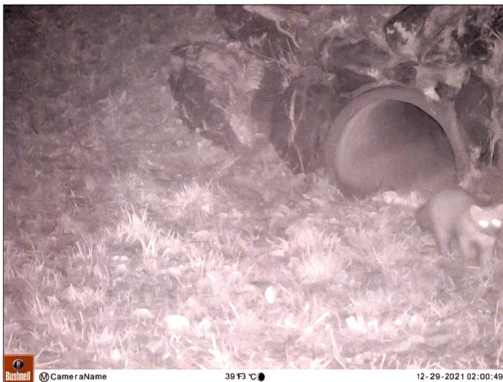
Abbildung 2: Ein Baummarder passiert den Kleintierdurchlass am 29. Dezember 2021 um 02.00 Uhr auf westlicher Seite.

führungen unterschiedlicher Dimensionen sein. Zur Verhinderung von Unfällen können Strassen auch eingezäunt werden. Ohne begleitende Massnahmen wird dadurch allerdings die Strasse für Wildtiere zu einer fast unüberwindbaren Barriere. Die Bewegungsfreiheit der Tiere innerhalb ihres natürlichen Lebensraumes wird dadurch stark eingeschränkt. Strassensanierungen bieten nicht nur die Chance, die Qualität der Strasse für die Verkehrsteilnehmenden zu erhöhen, sondern zugleich auch die Gelegenheit, die Situation für Wildtiere zu verbessern. Die Baumassnahmen zum Schutz der Wildtiere lassen sich mit einer Strassensanierung elegant kombinieren. Somit können Kosten und Ressourcen gespart werden.