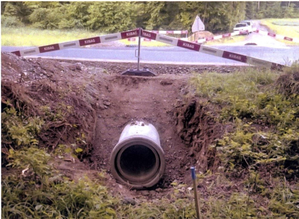
Abbildung 4: Situation während der Erstellung des Durchlasses auf östlicher Strassenseite.

Durch die 2015 erfolgten wildtierspezifischen Abklärungen in Schlatt konnte eine optimale Lage für einen Kleintierdurchlass bestimmt werden: Zwischen den beiden Waldstücken Obers Schmidhölzli und Liibrich wurde ein sehr deutlicher und häufig benutzter Wildwechsel über die Frauenfelderstrasse festgestellt. Fotofallenaufnahmen konnten zeigen, dass dieser von Rehen, vor allem aber von Dachsen, Füchsen und Mardern benutzt wird. Da ein geschützter Übergang für das Reh an dieser Stelle aus verschiedenen Gründen nicht in Frage kam, wurde entschieden, sich auf die klein- und mittelgrossen Säugetierarten zu konzentrieren. Eine Betonröhre mit 60 cm Durchmesser, wie sie im Tiefbau üblich ist, ist sehr gut als Kleintierdurchlass geeignet (Abbildung 4). Die Lage der Röhre wurde dann direkt auf dem Wildwechsel festgelegt (Meier & Rieder-Schmid 2015).