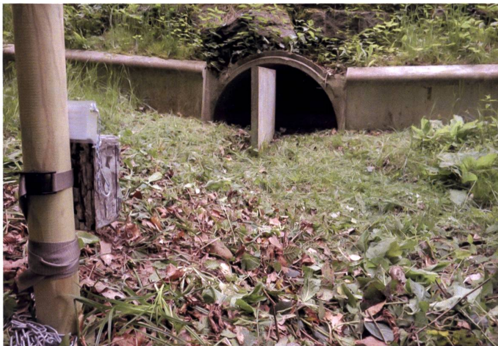
Abbildung 6: Beispiel der Installation einer Fotofalle (am linken Bildrand) vor einem Kleintierdurchlass (Standort Bernrain, Kreuzlingen).

Bereits im Jahr 2018, direkt nach der Fertigstellung des Baus, fand während sechs Monaten (31.05. bis 27.11.2018) eine Überwachung des Kleintierdurchlasses mit Fotofallen statt. Vier Jahre später wurde während sieben Monaten (25.11.2021 bis 21.06.2022) eine erneute Überwachung durchgeführt.