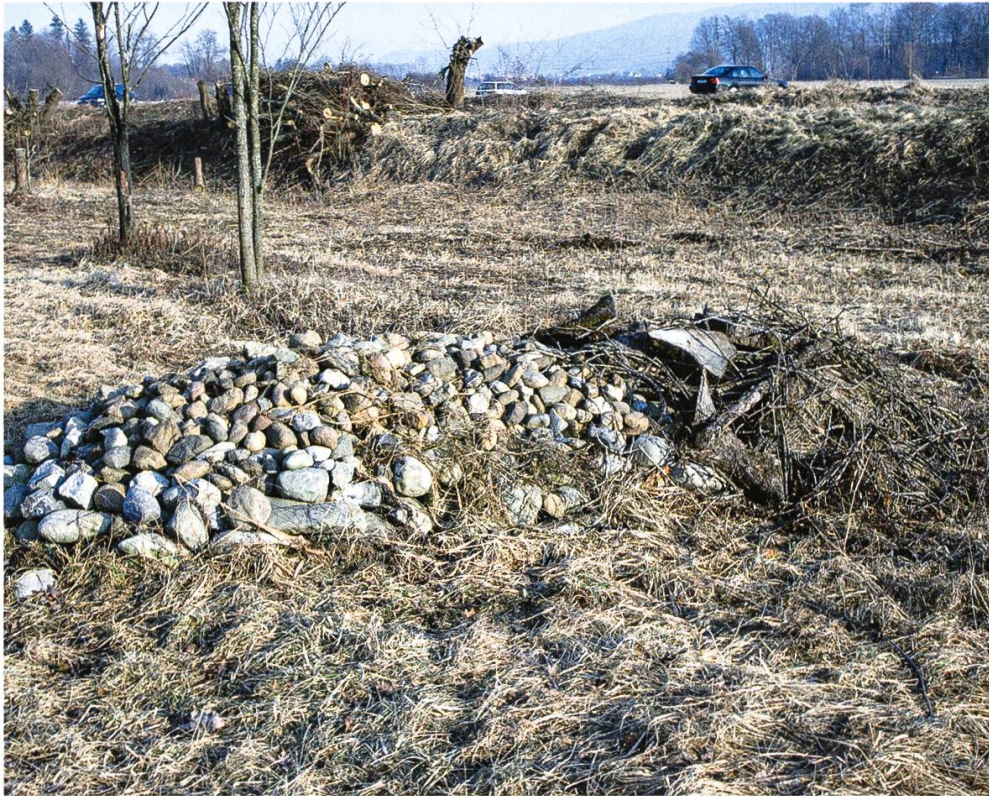
Abbildung 4: Kleinstrukturen bieten wertvolle Lebensräume.