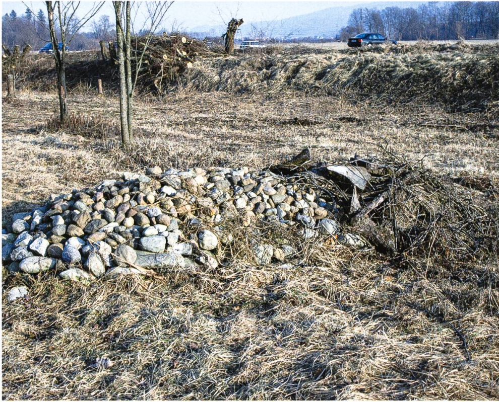
Abbildung 4: Kleinstrukturen bieten wertvolle Lebensräume.