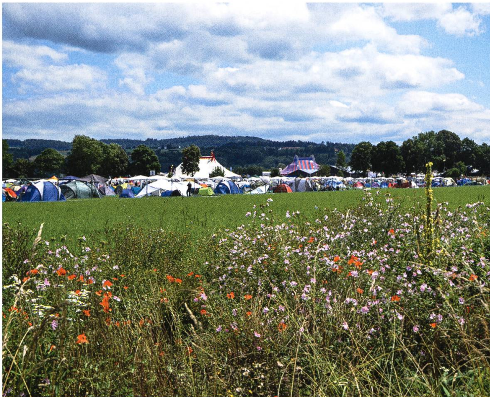
Abbildung 5: Wiesenstreifen mit artenreicher Blumenwiese. Im Hintergrund die Zeltstadt des Openairs Frauenfeld. Das Openair findet ausserhalb des Naturschutzgebietes statt.