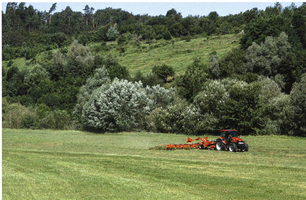
Abbildung 2: Ausbildungswiesen auf der Grossen Allmend müssen zu bestimmten Zeitpunkten der Truppe zur Verfügung stehen. Hierbei kommen entsprechende Maschinen zum Einsatz.