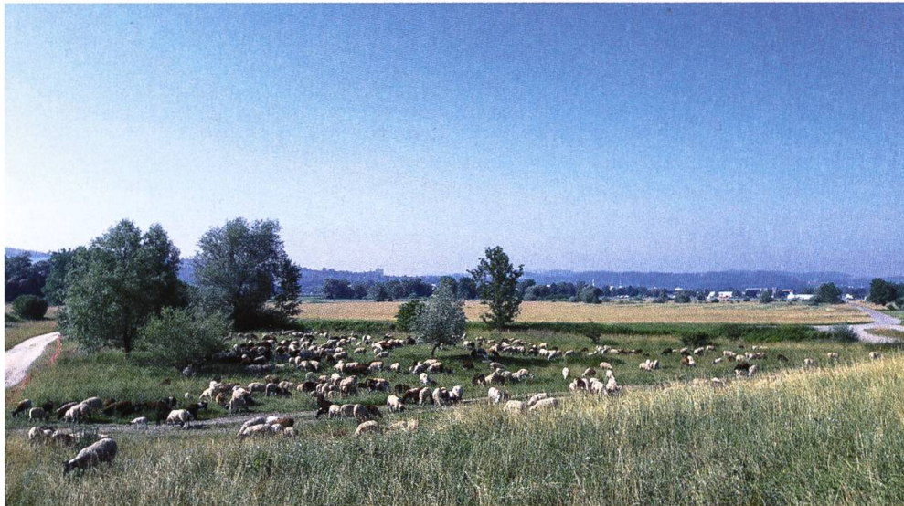
Abbildung 1: Schafherde auf der Wiesenfläche Gitzi im Naturschutzgebiet Allmend. Mit einer gesteuerten Beweidung durch Schafe werden die Wiesen kurz gehalten.

Der Unterhalt der Ausbildungswiesen auf der Grossen Allmend besteht primär in einer terminlich abgesprochenen «Kurzhaltung» der Wiesen durch die Beweidung mit Schafen sowie durch Mähen ( Abbildung 2 ). Im Vordergrund steht hier die Nutzbarkeit des Geländes zum gewünschten Zeitpunkt, die Grundlagen sind pachtvertraglich geregelt.