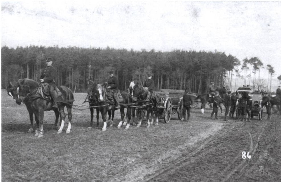
Abbildung 6: Berittene Artillerie auf der Allmend um 1940.

Bereits in den Jahren der Aufrüstung vor Beginn des Zweiten Weltkrieges wurde erkannt, dass unsere Artillerie dem rüstungstechnischen Fortschritt nicht ausreichend gefolgt war. Diese Fortschritte haben sich naturgemäss im Krieg bei den kriegsführenden Staaten rasant beschleunigt. In der Nachkriegszeit wurde dann für die mobile Artillerie die 10,5-cm-Haubitze mit Zugfahrzeug beschafft. Diese wird bis zur Umrüstung auf die mechanisierte Artillerie das Standardgeschütz des Waffenplatzes Frauenfeld. Somit wurde 1947 die letzte «pferdegezogene» Rekrutenschule durchgeführt. Nach minimalem Umbau der Stallungen in Garagen, Theoriesäle, Magazine und Einstellhallen prägten nicht mehr vorwiegend Pferde, sondern neben den Soldaten und Geschützen neu Motorfahrzeuge das Bild auf der Allmend. Doch bereits nach weiteren rund 20 Jahren vermag die gezogene Artillerie die Anforderungen an Beweglichkeit zur Unterstützung von mechanisierten Verbänden und zum eigenen Schutz