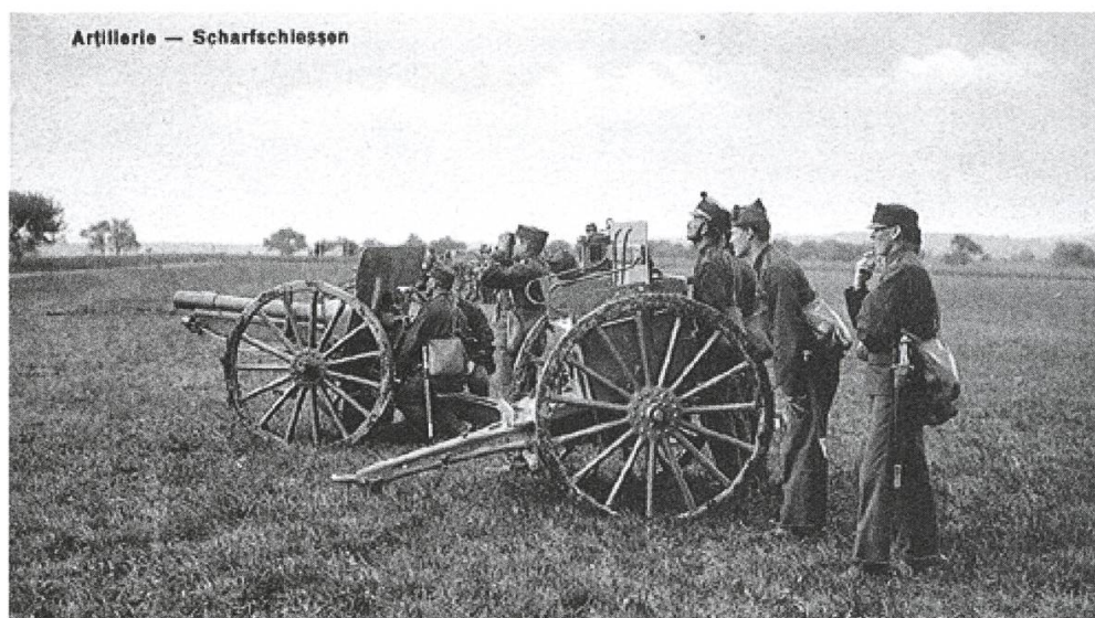
Abbildung 5: Feldpostkarte der Feldartillerie-Rekrutenschule, 1912.