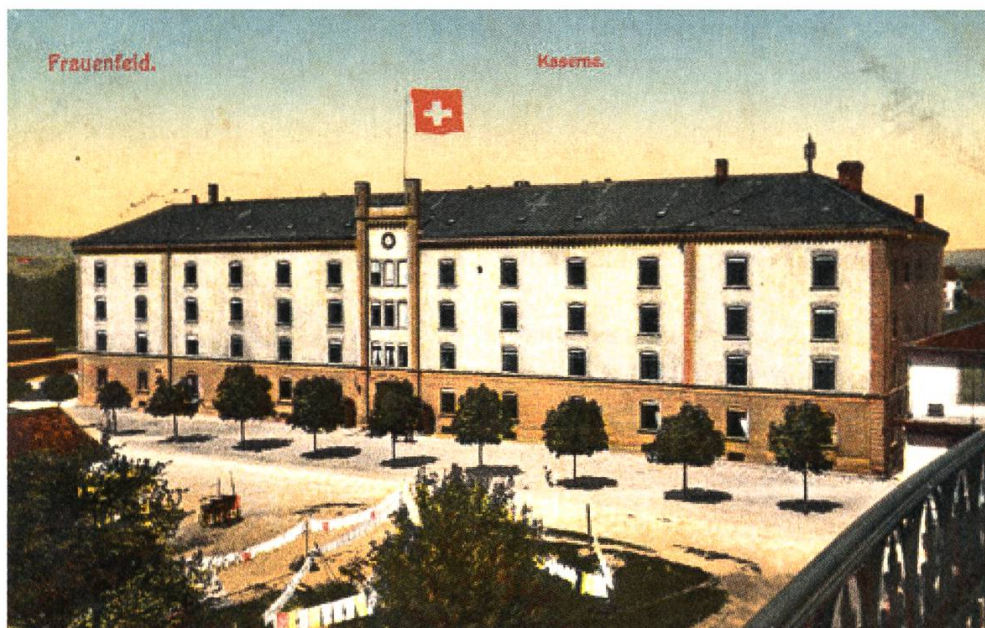
Abbildung 1: Ansichtskarte der Kaserne Stadt, ca. 1880.

Frauenfeld, seit 1712 regelmässiger Versammlungsort der eidgenössischen Tagsatzung, lag Mitte des 19. Jahrhunderts einen Tagesmarsch von den Kriegsdépôts in Zürich entfernt. Die Stadt war das Zentrum der hauptsächlich die Artillerietruppen stellenden Ostschweizer Kantone. Als in den 1860er-Jahren der gezogene Vierpfünder-Vorderlader in der Artillerie der Schweizer Armee Einzug hielt, genühten die Raumverhältnisse der Waffenplätze den Anforderungen dieser neuen Waffe nicht mehr. Das Geschütz schoss auf die für die damaligen Verhältnisse enorme Distanz von 3'000 Metern. Dies verlangte ein ausgedehntes Exerzierfeld für wirklichkeitsnahe Manöver. Bei einer Sondierung von Oberst Hans Herzog, dem damaligen Artillerie-Waffenchef, fiel die Wahl auf das Thurtal. Neben Bischofszell bewarben sich auch noch Weinfelden und Frauenfeld um den neuen Truppenübungsplatz. In Frauenfeld überzeugte die weite Ebene zwischen der Stadt und der Thur mit einem ansteigenden Hang am rechten Flussufer als ideales Manövrier- und Schiessgelände. Dies war der Ursprung der militärischen Nutzung der Frauenfelder Allmend.