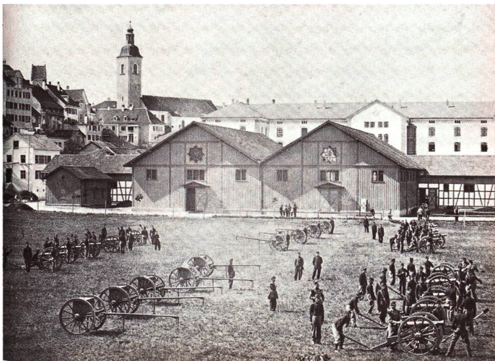
Abbildung 3: Exerzieren auf dem Oberen Mätteli, 1866.