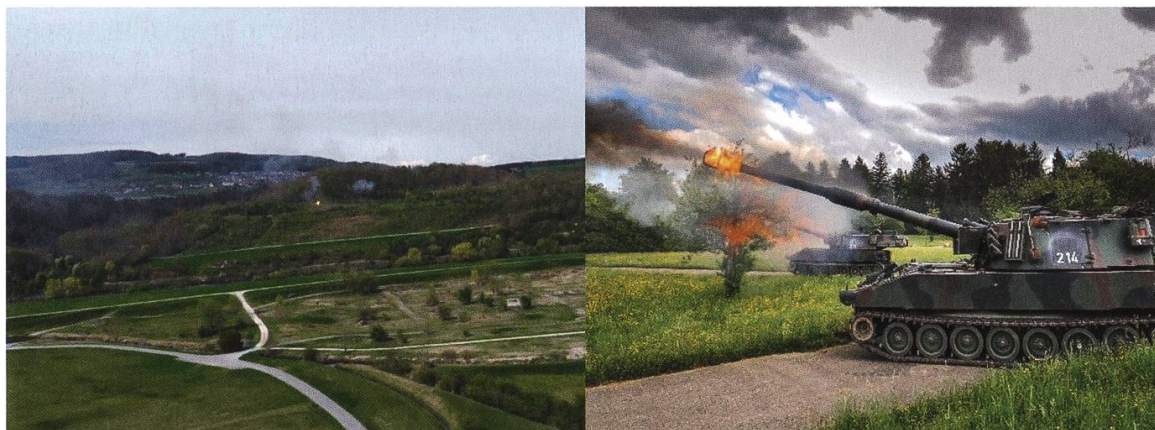
Abbildung 7: Artillerieschiessen auf der Allmend, 2018.

Bereits in den Jahren der Aufrüstung vor Beginn des Zweiten Weltkrieges wurde erkannt, dass unsere Artillerie dem rüstungstechnischen Fortschritt nicht ausreichend gefolgt war. Diese Fortschritte haben sich naturgemäss im Krieg bei den kriegsführenden Staaten rasant beschleunigt. In der Nachkriegszeit wurde dann für die mobile Artillerie die 10,5-cm-Haubitze mit Zugfahrzeug beschafft. Diese wird bis zur Umrüstung auf die mechanisierte Artillerie das Standardgeschütz des Waffenplatzes Frauenfeld. Somit wurde 1947 die letzte «pferdegezogene» Rekrutenschule durchgeführt. Nach minimalem Umbau der Stallungen in Garagen, Theoriesäle, Magazine und Einstellhallen prägten nicht mehr vorwiegend Pferde, sondern neben den Soldaten und Geschützen neu Motorfahrzeuge das Bild auf der Allmend. Doch bereits nach weiteren rund 20 Jahren vermag die gezogene Artillerie die Anforderungen an Beweglichkeit zur Unterstützung von mechanisierten Verbänden und zum eigenen Schutz