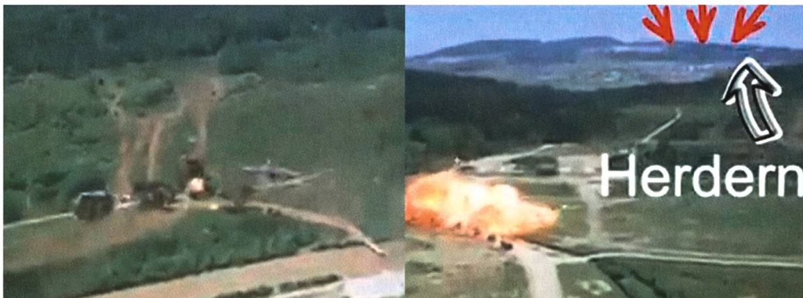
Abbildung 8: Fliegerschiessen in den 1970er-Jahren.

Die Allmend wurde immer wieder auch für weitere Bedürfnisse des militärischen Trainings genutzt. So betrieben Genietruppen an Thur und Murg Übersetz- und Brückeneinbaustellen. Ab 1962 benötigte die Armee das Gelände zusätzlich als Panzerübungsplatz. Das hatte zur Folge, dass der Nutzungsvertrag mit der seit 1936 auf der Allmend beheimateten Segelfluggruppe Cumulus und der Motorfluggruppe Thurgau nicht mehr verlängert werden konnte. Diese hatten in Spitzenjahren über 3'000 Starts pro Jahr! Da der Bedarf an Ausbildungsgelände für die Armee jedoch schon damals Priorität gegenüber den Vereins-