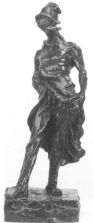
Honoré Daumier, Ratapoil – Karikatur auf Louis Napoléon als Prinzpräsi- dent, Napoleonmuseum Thurgau Schloss und Park Arenenberg

Diese Lücke schliesst die Ausstellung nun und nimmt sich besonders dieser Zeit an. Kostbare Möbel aus dem Kinderzimmer des Prinzen zeigen, wie früh seine Mutter ihn auf Napoleon I. als Vorbild polte. Erste Porträts vermitteln eher das Bild eines – fast möchte man sagen «mädchenhaften» – schüchternen Knaben, der sich seiner Rolle noch überhaupt nicht bewusst scheint. Später entdeckt der Besucher einen zu allen Streichen aufgelegten Lausbuben, voller künstlerischer Bega-