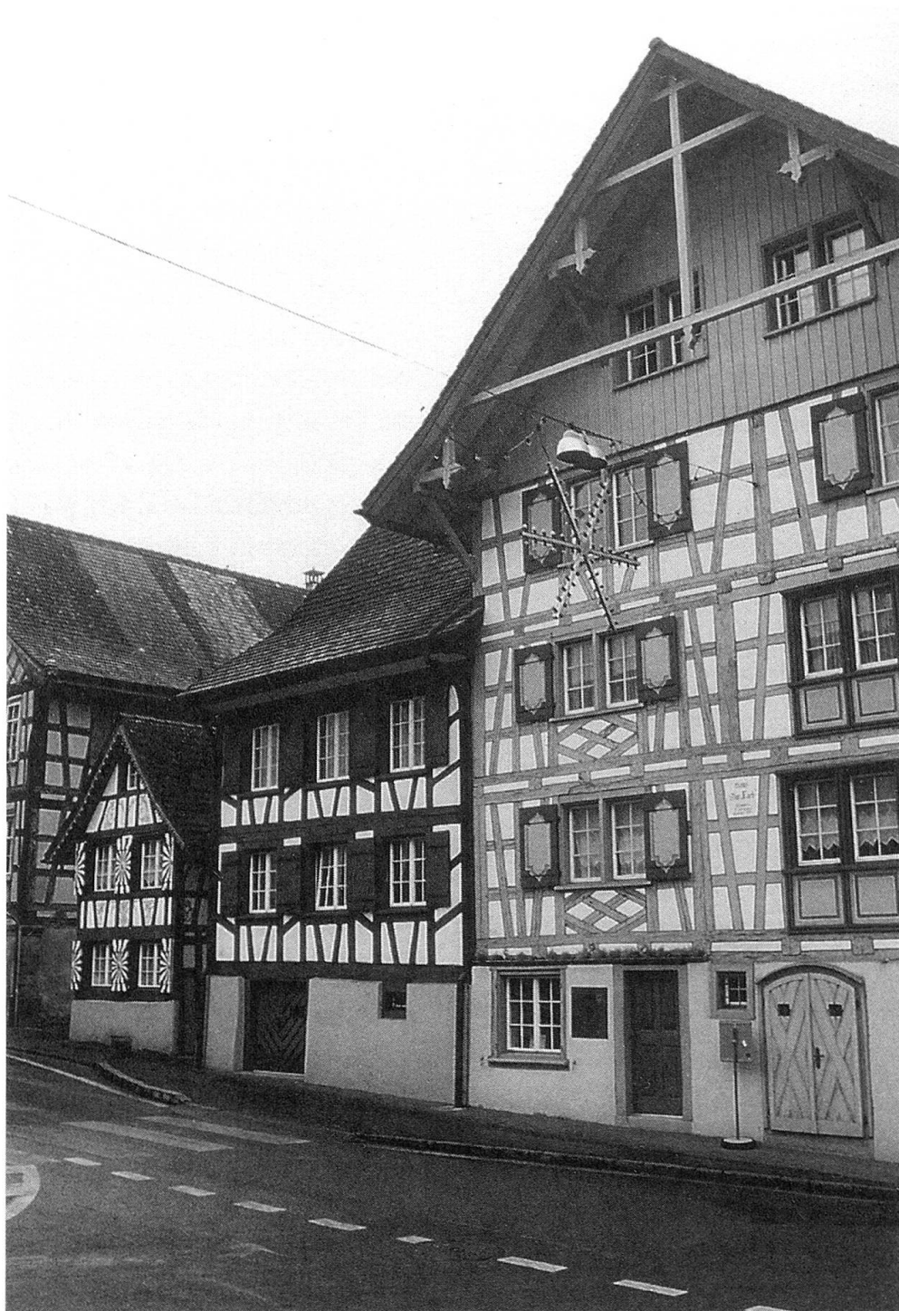
Malerhaus, Kellerhaus, Farb