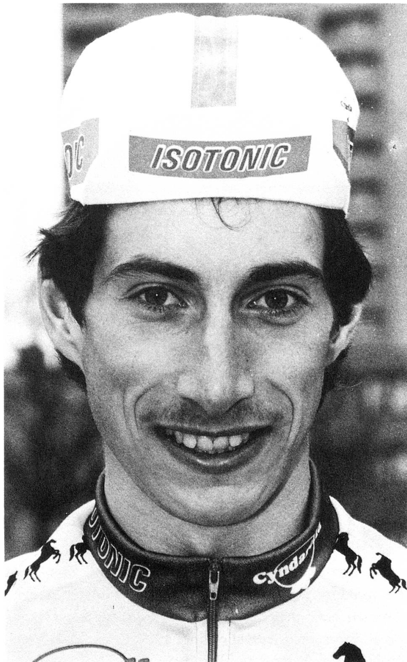
Neoprofi Järmann im Jahre 1987.