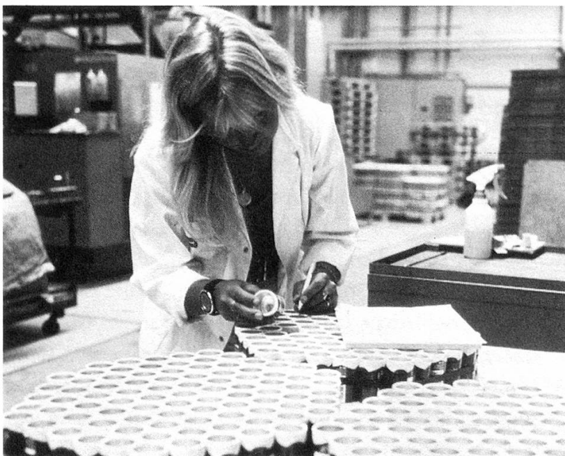
Blick in die Produktion: Eine Milliarde Dosen im Laufe von 30 Jahren wurden in Matzingen hergestellt.