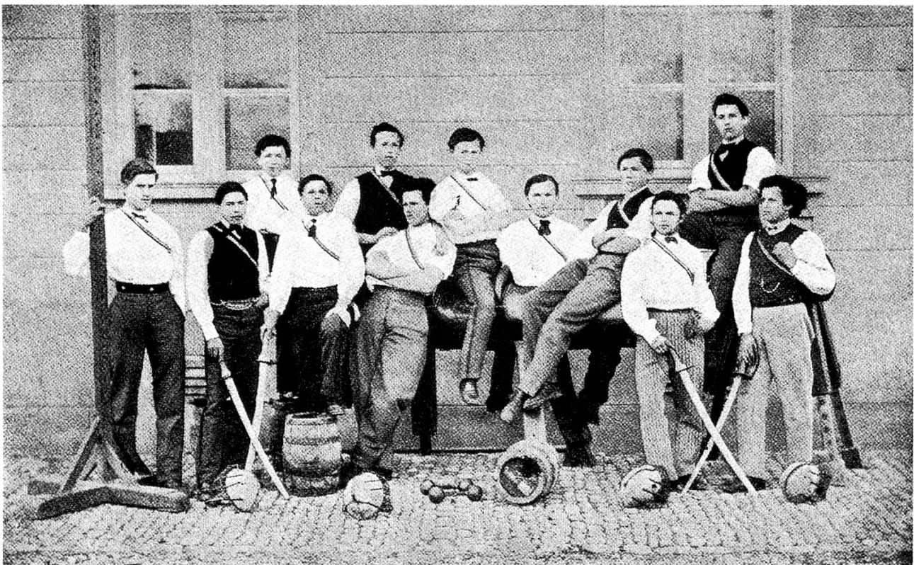
Der Kantonsschülerturnverein Concordia im Jahre 1871.