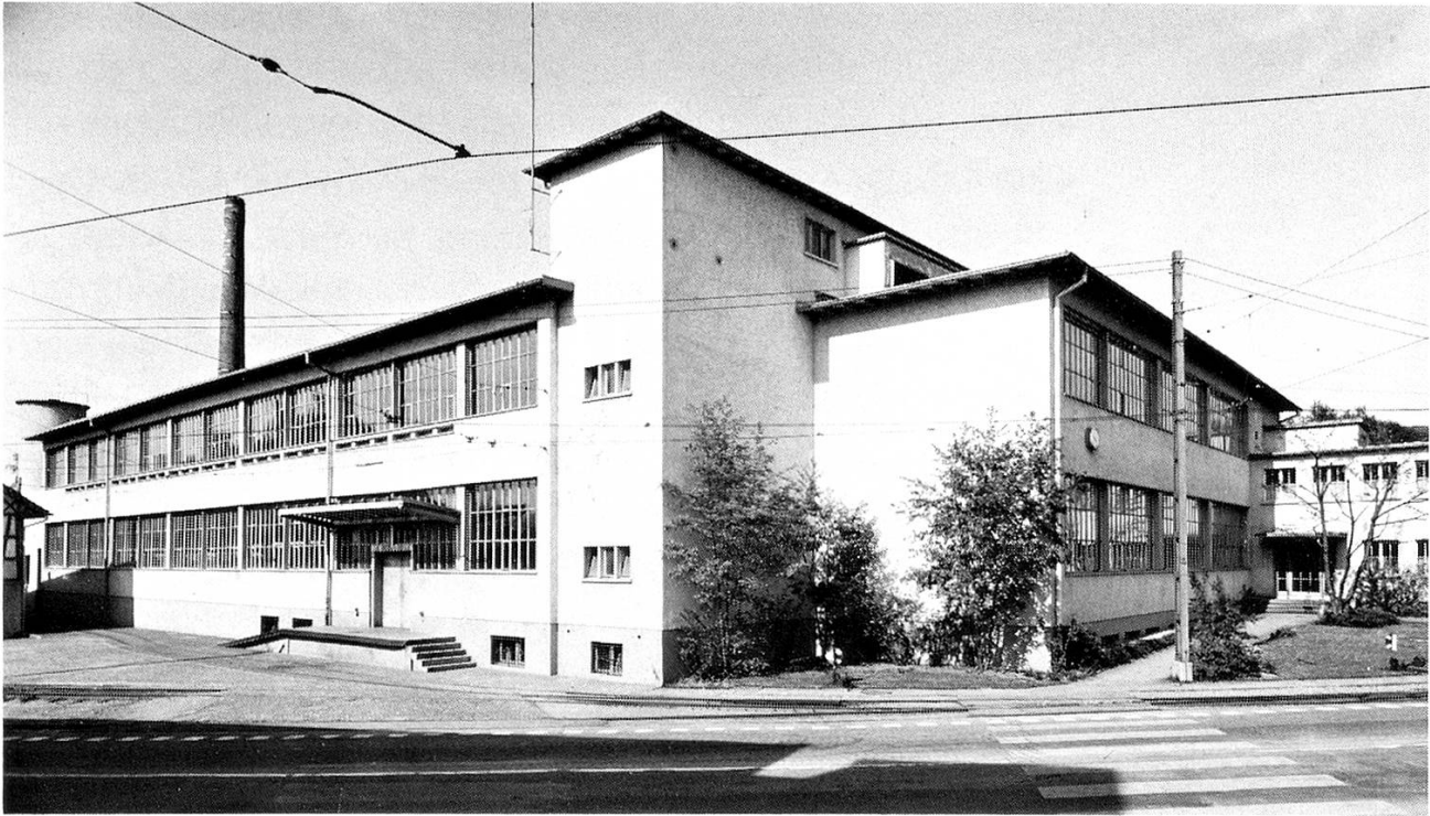
Hauptfront von Süden.

lassen zu haben, doch versucht man immer wieder, die Vorteile von Baumwolle und jene von Synthetics zu vereinen und zu optimalen Erzeugnissen zu führen. Jedenfalls ist eine gewisse Rückkehr zur Naturfaser festzustellen. Die rohen, rohbunten, glatten und schaftgemusterten Grob-, Mittelfein- und Feingewebe aus Baumwolle, Zellwolle, Synthetics und eben aus den Mischungen finden ihre Verwendung zu 50 Prozent in der Bekleidungsindustrie. Zu etwa 10 Prozent wird, mit Vorhangstoffen vor allem, für die Dekoration gearbeitet und zu etwa 20 Prozent für den Haushalt mit Bett- und Küchenwäsche; dazu kommen 20 Prozent gemischte Gewebe. Es gibt für diese Produkte auch Verwendung