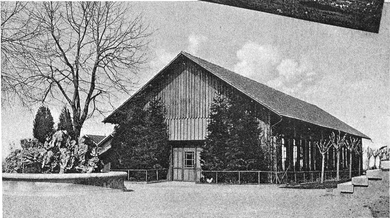
Auf dem Nollen um 1910. Vergrößerte Postkarte.