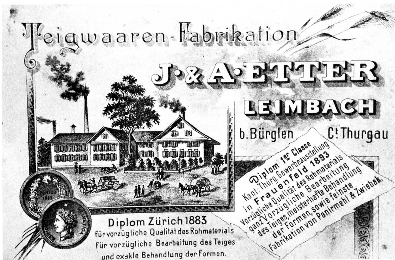
Postkarte, um 1858.

1970 einzustellen, welcher trotz allen Neuerungen und Verbesserungen gegenüber der Konkurrenz ins Hintertreffen geraten war.