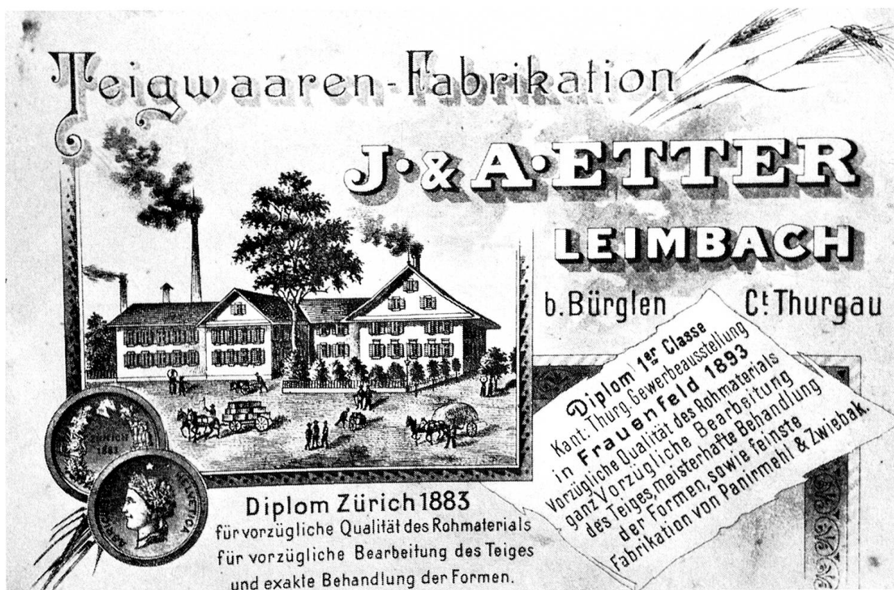
Postkarte, um 1858.

1970 einzustellen, welcher trotz allen Neuerungen und Verbesserungen gegenüber der Konkurrenz ins Hintertreffen geraten war.