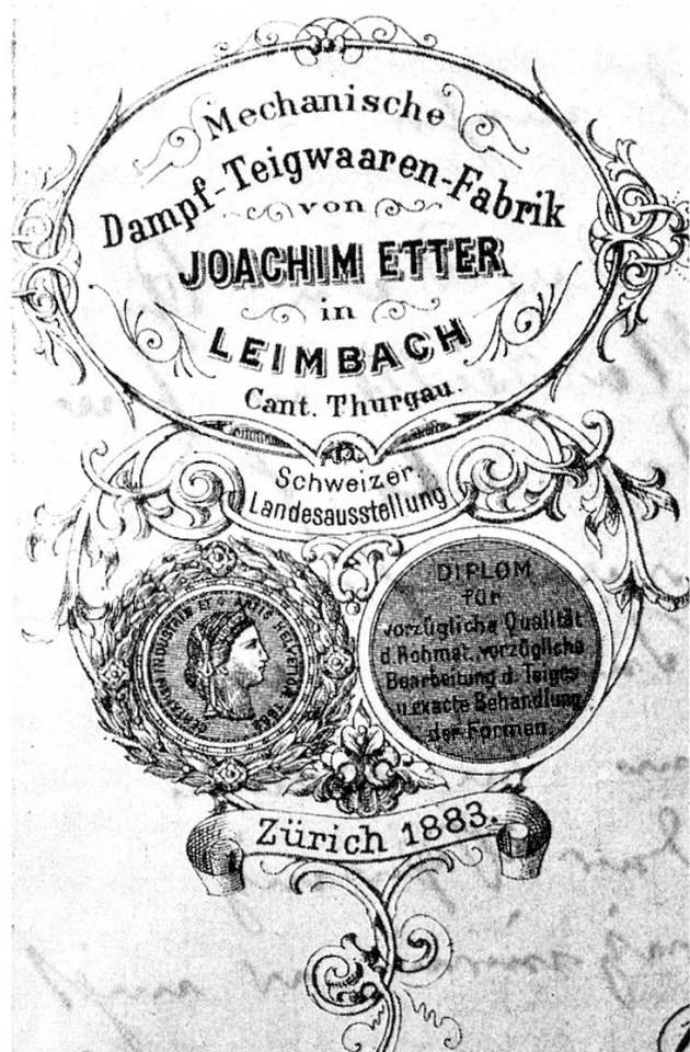
Briefkopf von 1883.