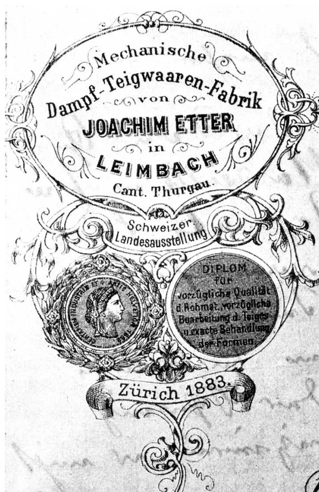
Briefkopf von 1883.