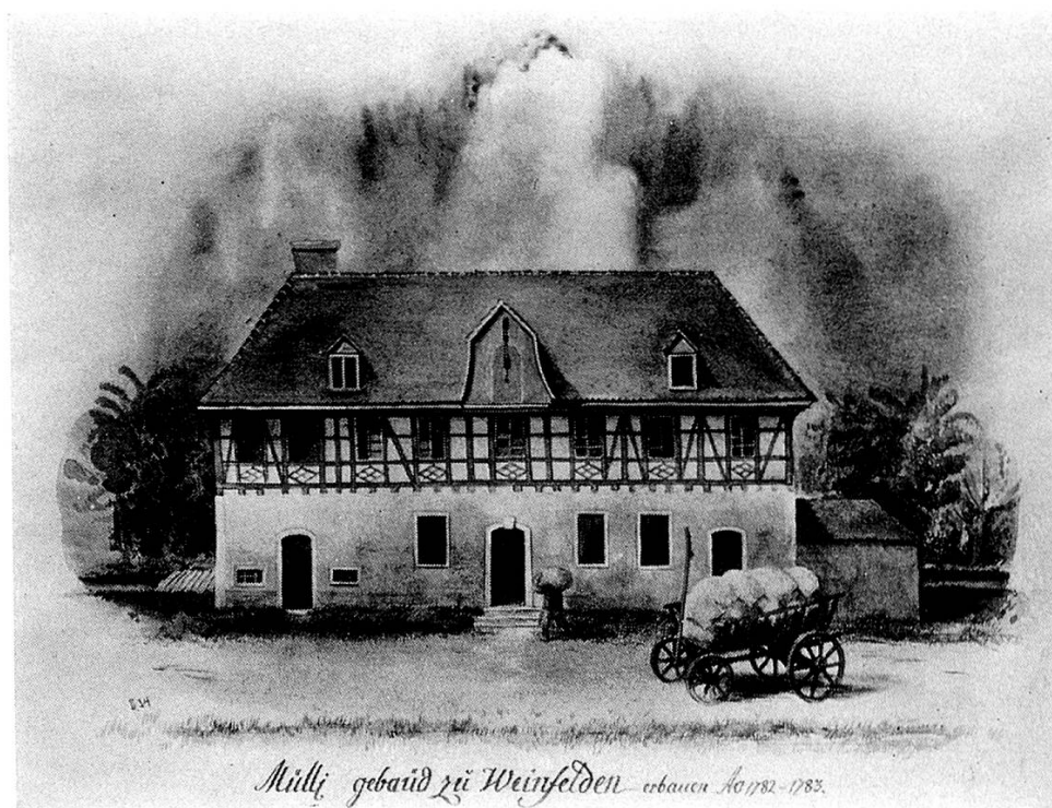
Die Mühle Weinfelden im Jahre 1784.