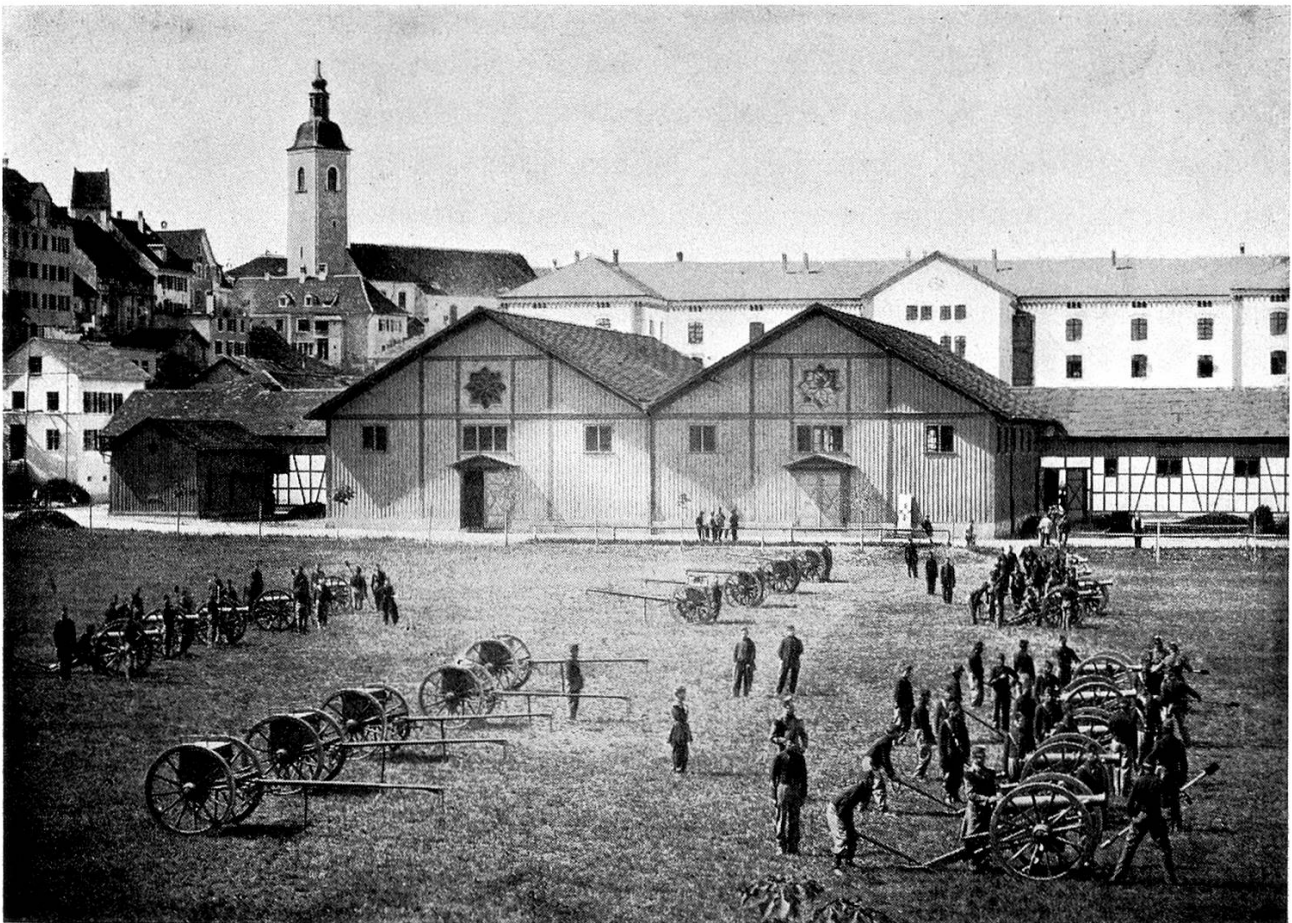
Schießschule auf dem Mätteli in der Frühzeit der Frauenfelder Kaserne.

für sich und nichts für die ihnen anvertrauten Pferde getan hatten. Hier erst wurde einem die Größe der Demoralisation der Bourbakischen Armee ganz klar; denn ein Reiter, der kein Herz für sein hungerndes Pferd hat, ist kein Mensch mehr, fühlt nicht mehr menschlich, ist ein herzloser Egoist, um kein Haar besser als ein gemeines Tier.