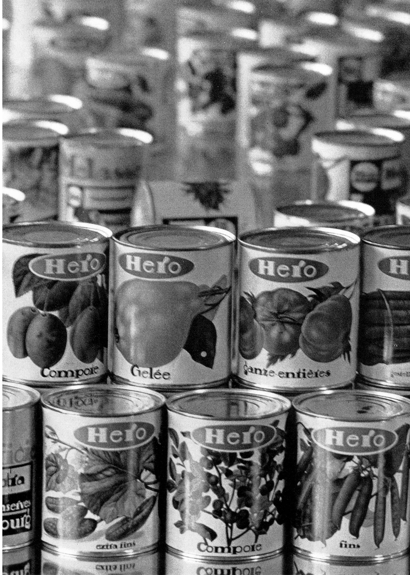
Einige Produkte der Hero Conserven Lenzburg und Frauenfeld