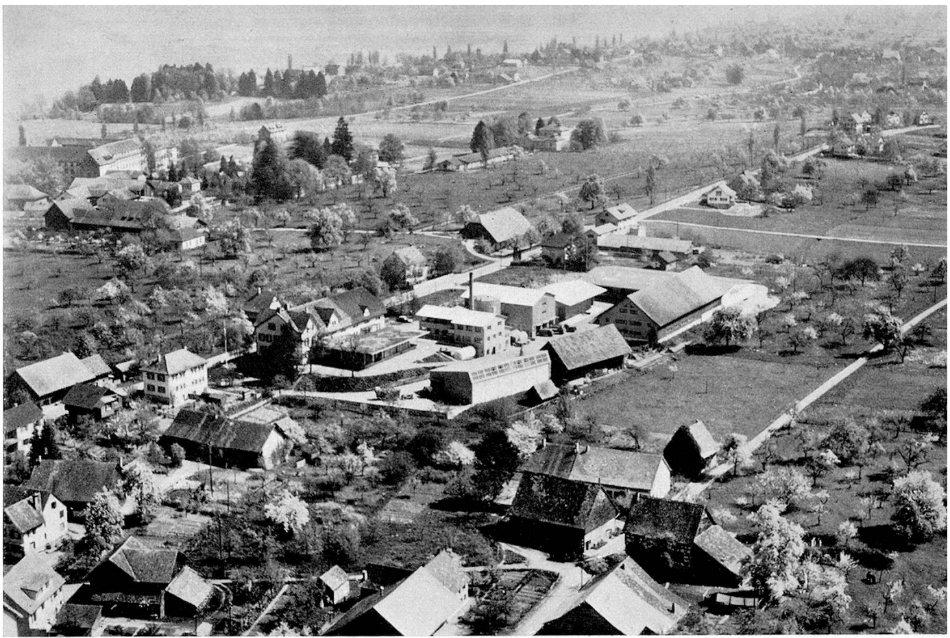
Scherzingen: Flugaufnahme, April 1961