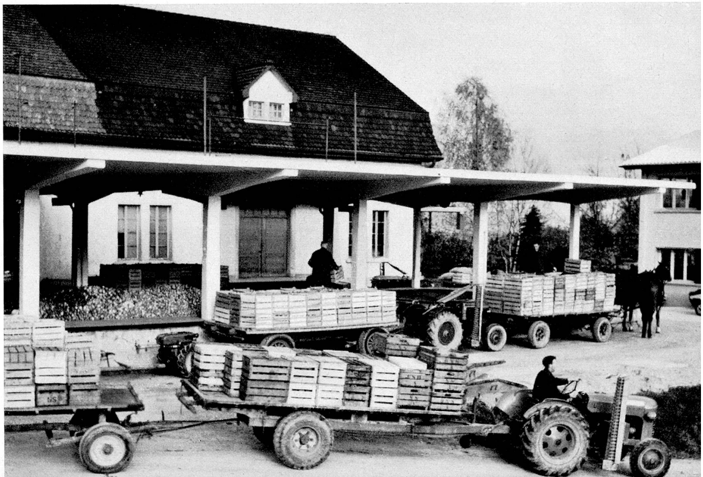
Anfuhr von Mostobst