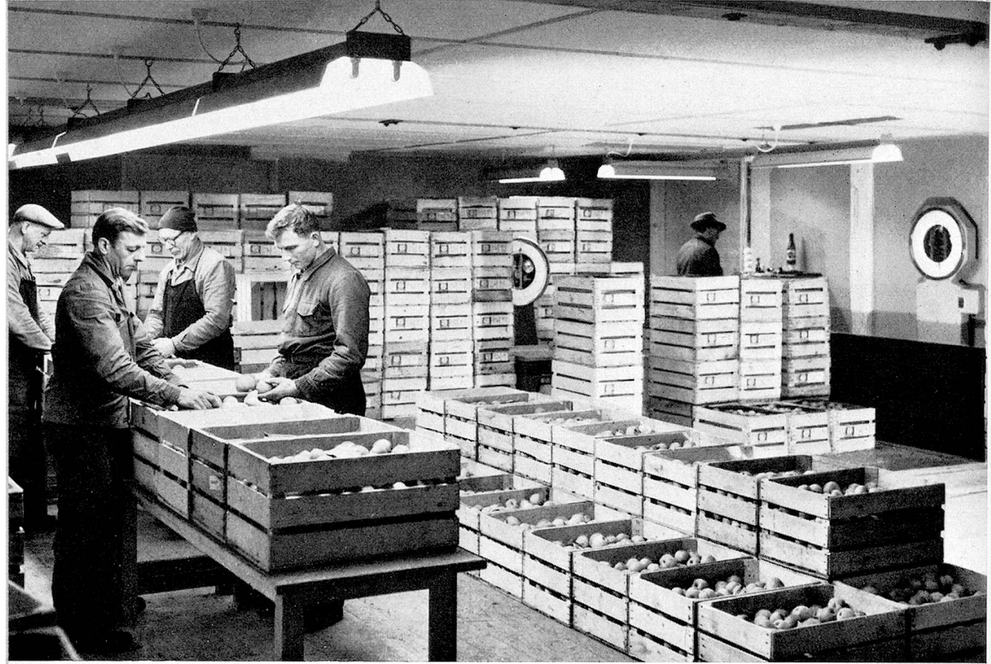
Scherzingen : Sortierung des Tafelobstes