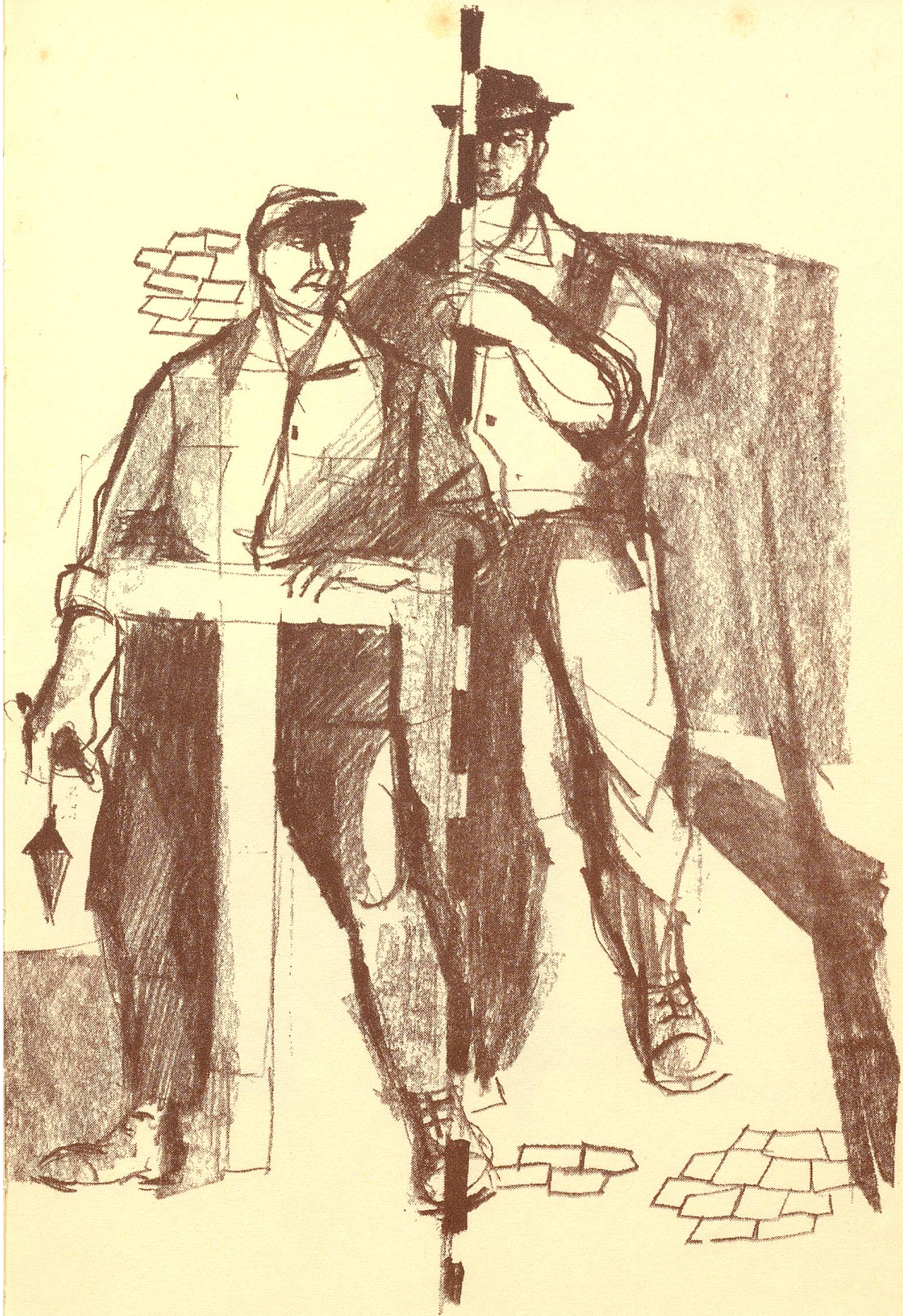
Cellere Frauenfeld baut Straßen