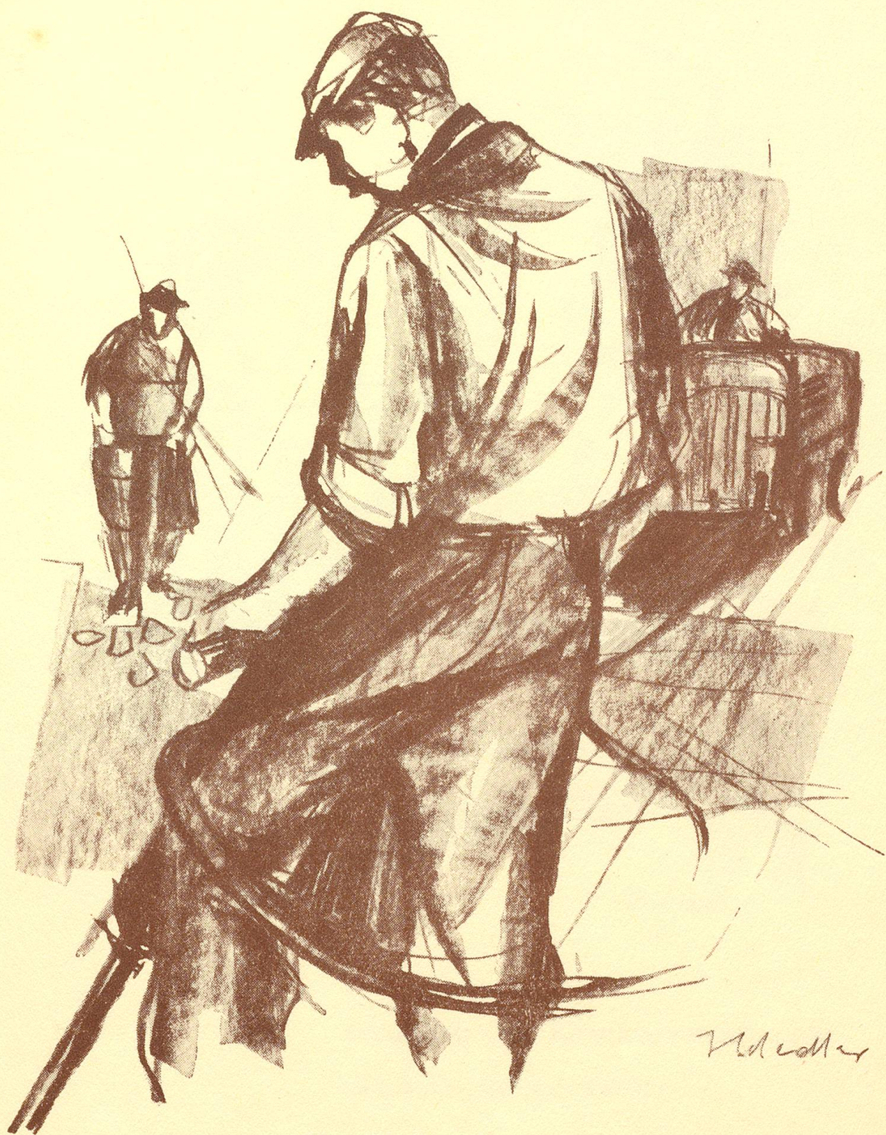
Egolf AG, Straßen- und Tiefbau, Weinfelden