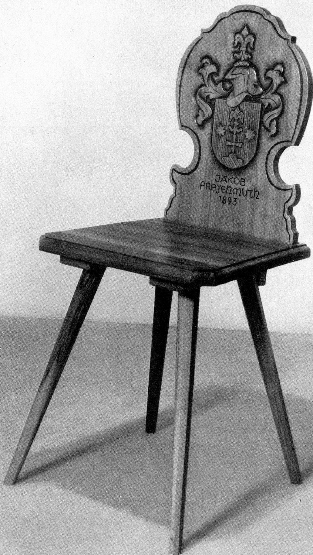
Eine Arbeit aus der Werkstätte für Möbel und Innenausbau Jak. Freyenmuth, Frauenfeld