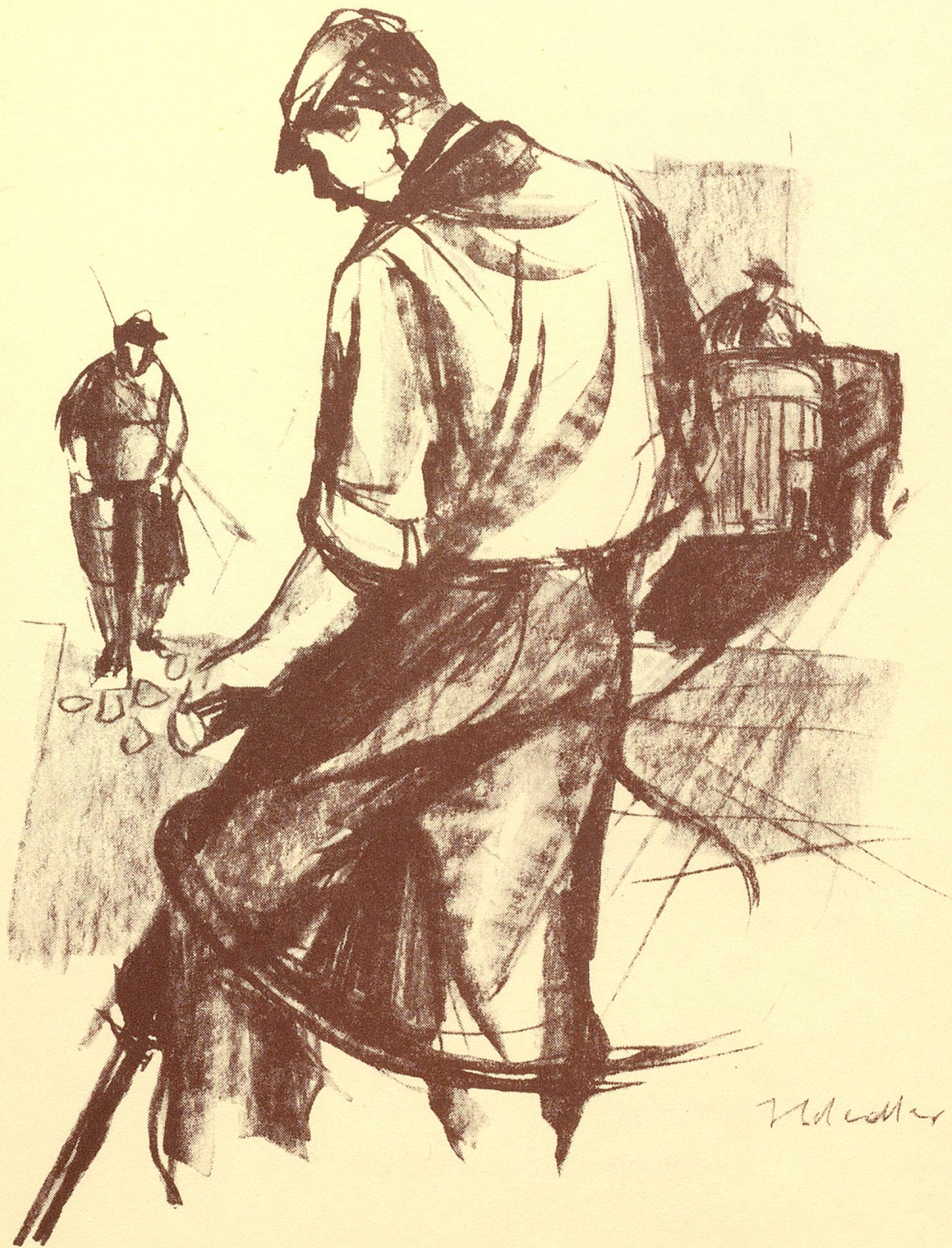
Egolf AG, Straßen- und Tiefbau, Weinfeldern