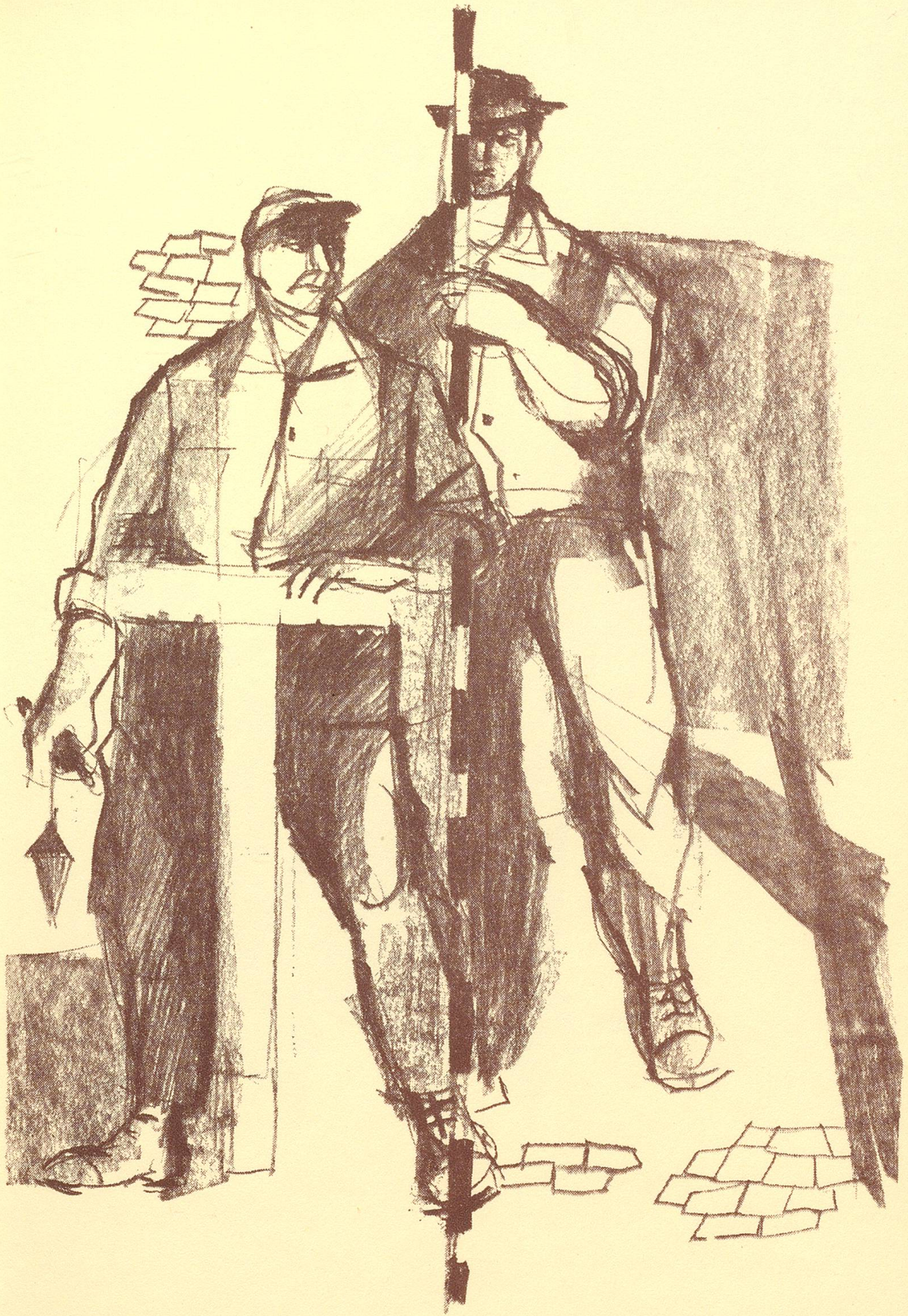
Cellere Frauenfeld baut Straßen