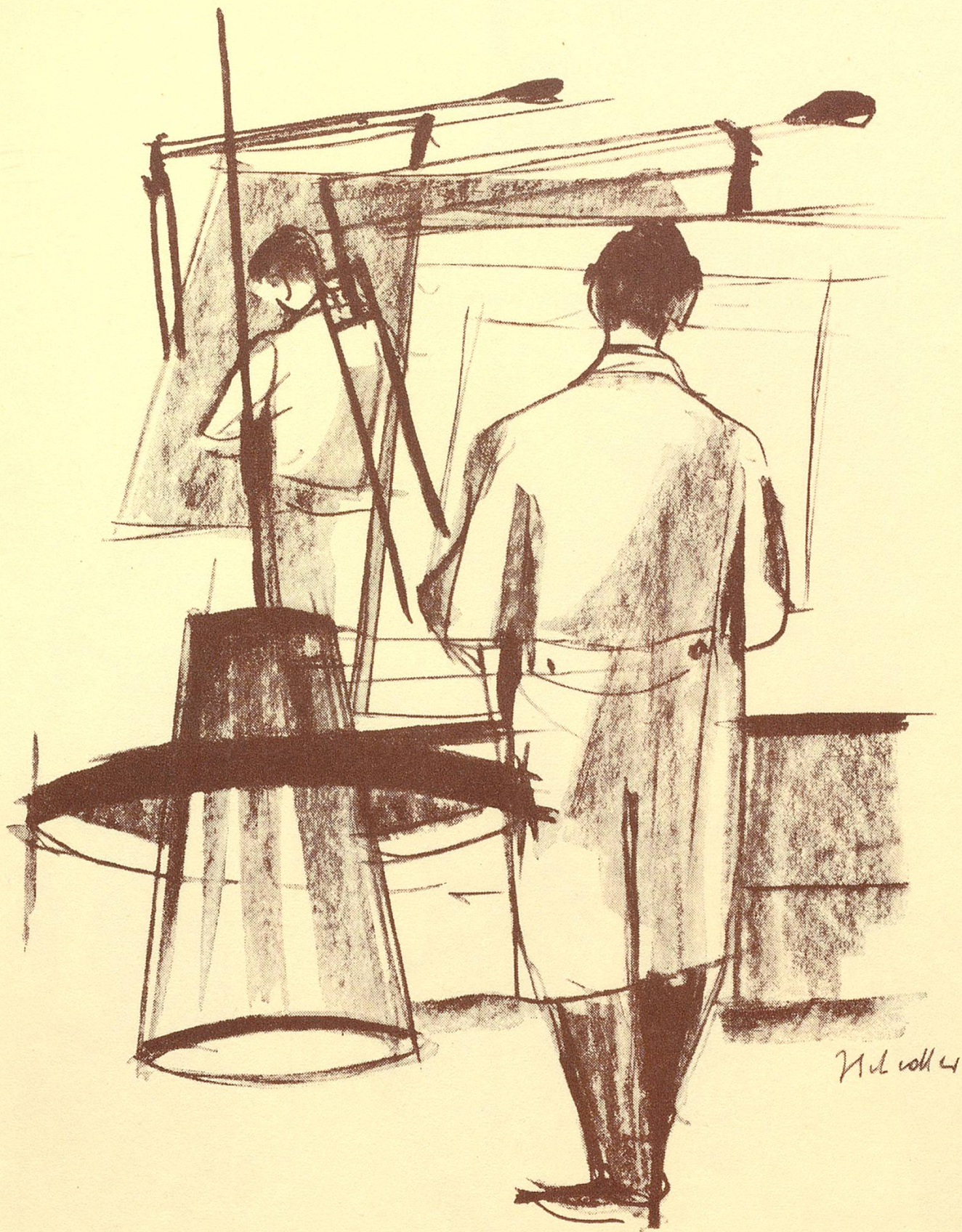
Formschöne Beleuchtungskörper Huco AG, Münchwilen TG