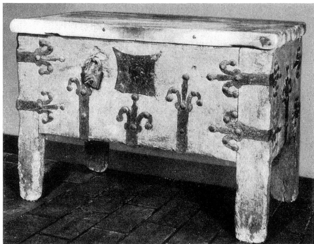
Gotische Truhe Kloster Münsterlingen

Ein bekannter, nun verstorbener Historiker der Innerschweiz hat einmal gesagt: Es ist schade um euch Thurgauer! Ihr seid ein wackeres, gescheites Volk, aber – ihr habt so gar keine Tradition!