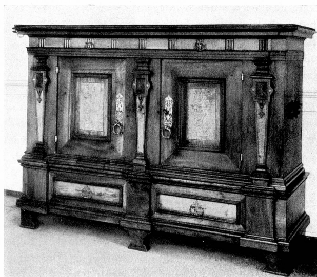
Renaissance-Schrankschrank, 16. Jahrhundert Kreuzlingen

Solche Gedanken kommen einen an, wenn man in der «Römerburg» in Kreuzlingen ist. Dort ist seit einigen Jahren eine wahre Heimstatt für lang Verlorenes und Verschollenes gewachsen. Der sie schuf, ist kein Künstler, kein Sammler im landläufigen Begriff – aber ein Mensch mit dem klaren, unverfälschten Sinn für das Echte, Wahre, Bodenständige. Er hat schon als Kind die Vergangenheit gesucht und wurde allmählich besessen vom Wunsche, seiner Ahnen alten Besitz wie-