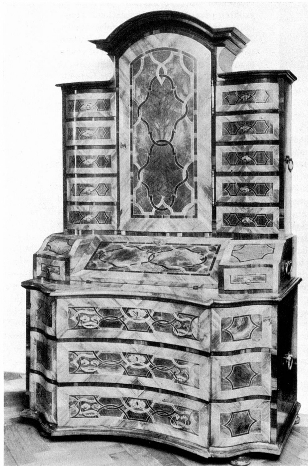
Barock-Stiftsmöbel um 1742 Kloster Fischingen

Haben wir nicht nach Zeugen gesucht? Hier stehen sie. Sie waren nur lange unter Staub und Trauer vergraben. So wie wir sie aber heute besitzen, spiegeln sie das Bild einer großen, ruhigen, in sich gesammelten Zeit. Sie sind ein Bestandteil des Begriffes Heimat, denn einmal wuchsen sie aus unsern Gärten und Wäldern auf und es ist gut, zu wissen, daß sie nun wieder uns gehören.