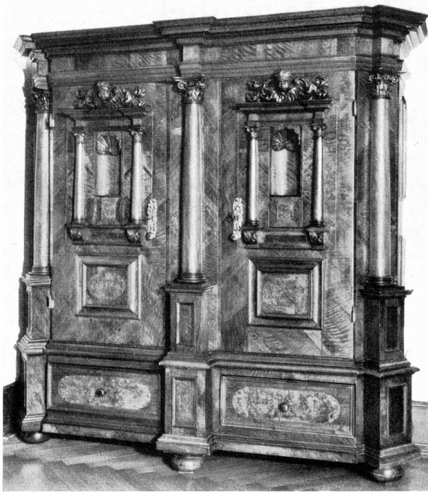
Thurgauer Barockschränk. 17. Jahrhundert Kloster Münsterlingen