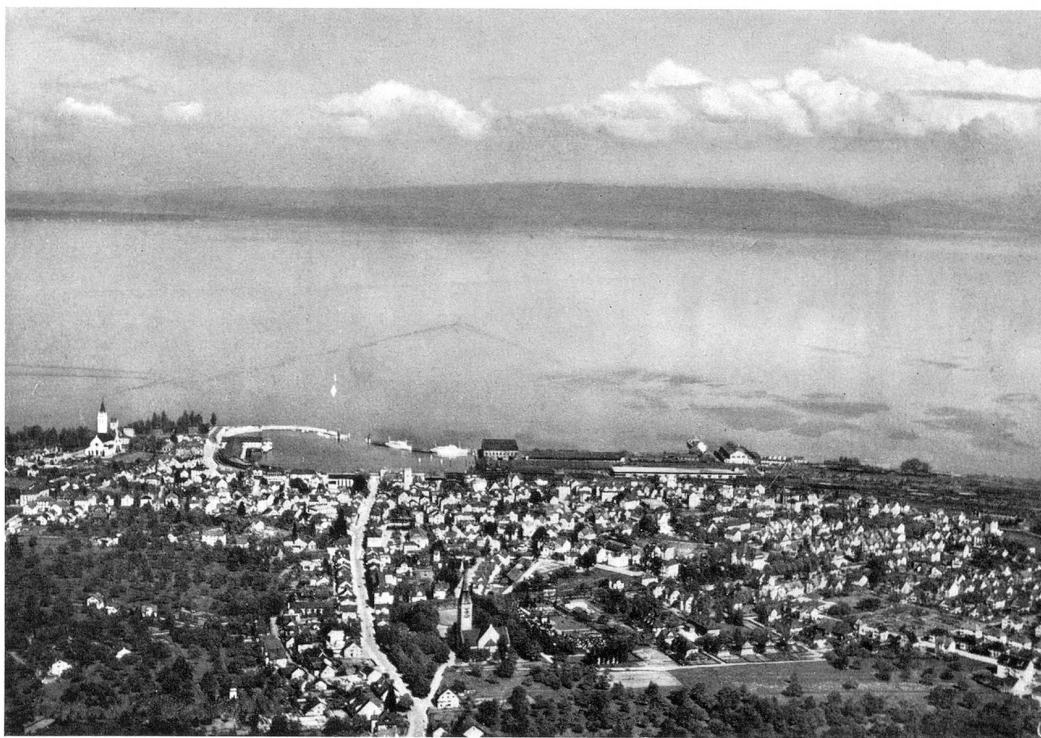
Romanshorn vom Flugzeug aus