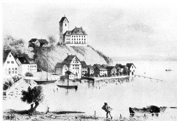
Fischerdorf Romanshorn Zeichnung aus dem Jahre 1760

Es wäre indessen ebenso einseitig wie falsch, diese Kämpfe nur nach ihren Schattenseiten zu beurteilen. Im Grunde bildeten sie die Voraussetzung für den Übergang vom äußeren Aufschwung zur inneren Konsolidierung. Ohne diese Kämpfe besäße Romanshorn keine vorbildliche Wasser- und Elektrizitätsversorgung, kein Gaswerk, das die ganze Seegegend von Egnach und Amriswil bis Kreuzlingen versorgt, kein Krankenhaus, keine Badeanstalten, keine moderne Schwimmanlage, keinen Schloß- und keinen Seepark, keinen Saalbau, auf den selbst größere Städte neidisch sind und keinen Sportplatz, aber auch keine Wohnquar-