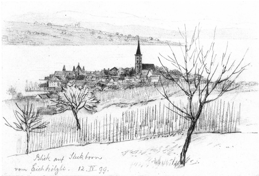
Blick auf Steckborn vom Eichhölzli Nach einer Zeichnung von J. Guhl aus dem Jahre 1899