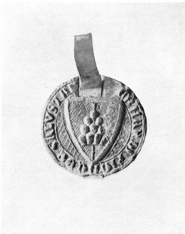
Siegel des Eberhard (III.) von Salenstein aus dem Jahre 1300

Nachkommen zu hinterlassen. Ein anderer Konradus de Salunstein, junior genannt, erscheint zwischen 1260 und 1284 häufig als Zeuge, meist unter Leuten