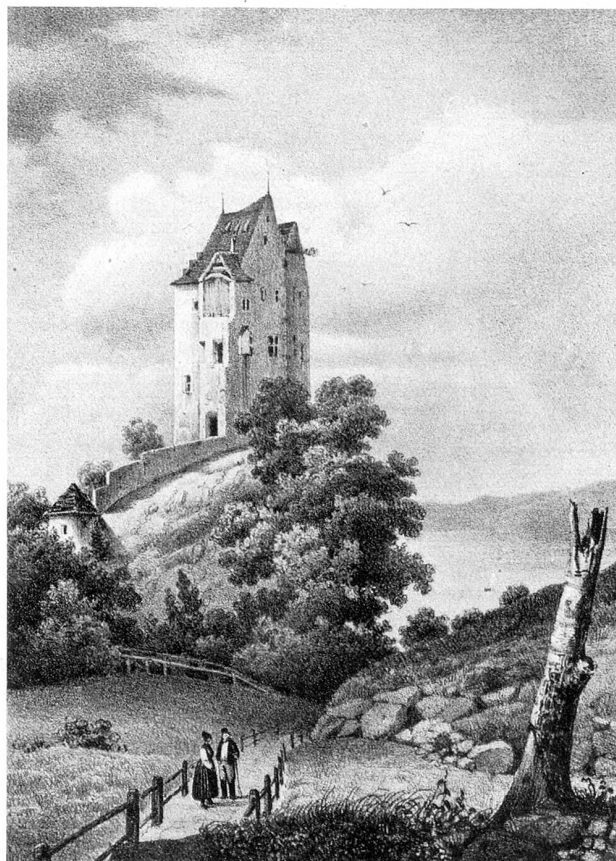
Schloß Salenstein nach dem Abbruch des Südteils (1828)